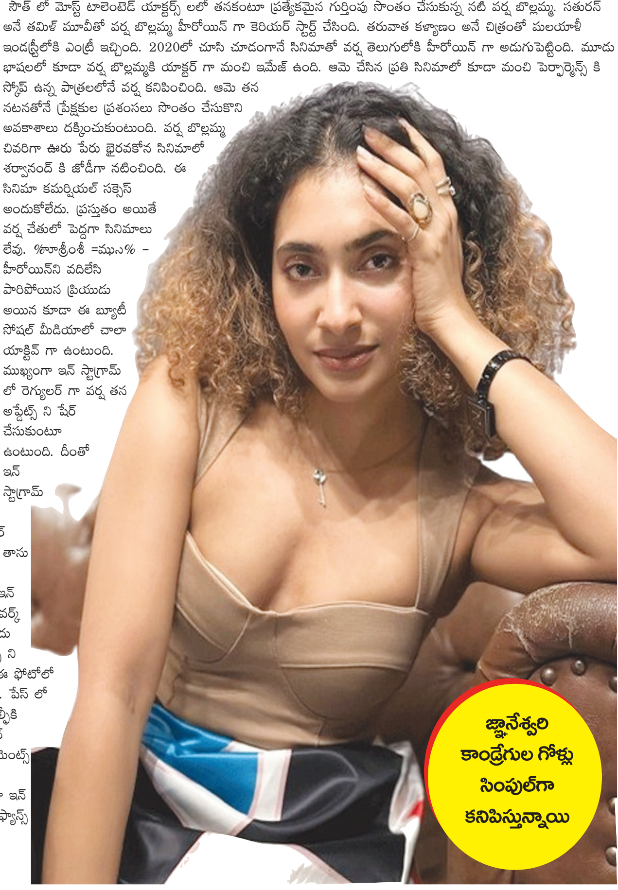
even though n? 🤔👉

లో వర్క కి మంచి ఫ్యాన్ ఫాలోయింగ్ ఉంది. ఆమె ఇన్ స్టాగ్రామ్ లో గ్లామర్ పిక్స్ కంటే డిఫరెంట్ స్టైల్ లో తనని తాను రిప్రజెంట్ చేసుకుంటూ ఫోటోలని పంచుకుంటూ ఉంటుంది. తాజాగా ఇన్ స్టాగ్రామ్ లో ఈ అమ్మడు జిమ్ లో వర్క్ అవుట్స్ చేసిన తర్వాత అద్దం ముందు నిలబడి సెల్ఫీ తీసుకుంది. ఈ పిక్స్ ని ఇన్ స్టాగ్రామ్ లో షేర్ చేసింది. ఈ ఫోటోలో వర్క్ చాలా స్లిమ్ గా కనిపిస్తోంది. పేస్ లో డిఫరెంట్ ఎక్స్ ప్రెషన్ పెట్టి సెల్ఫీకి ఫోజులిచ్చింది. ఈ పిక్ పై ఇన్ స్టాగ్రామ్ లో చాలా ఫన్నీ కామెంట్స్ వస్తున్నాయి. ఇలాంటి ఫన్నీ ఫోటోలని వర్క్ రెగ్యులర్ గా ఇన్ స్టాగ్రామ్ లో షేర్ చేస్తూ ఫ్యాన్స్ కి వివేచనల్ని అందిస్తూ ఉంటుంది.