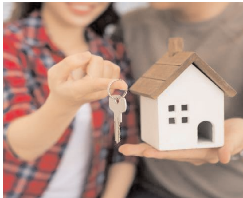
లక్షల లోపున సరసమైన గ్యూజెట్లకు మాత్రం తక్కువ ప్రాధాన్యత ఉన్నట్లు సర్వేలో వెల్లడైంది.

మెంట్ అసగానే బంగారంపై అని అనుకుంటే పొరపాటే అవుతుంది. తాజా సర్వే నివేదికలు మాత్రం అందుకు భిన్నంగా ఉన్నాయి. స్వర్ణం కనీసం టాప్ రెండు స్థానాల్లోనూ లేకపోవడం ఆశ్చర్యపరిచే విషయమే. పడిపోయిన బంగారం స్థానం: రియల్ ఎస్టేట్ కనస్టేబుల్ సర్వే అనరాక్ ఒక సర్వే నిర్వహించింది. మొత్తం 5 వేల 5 వందల మంది ఇందులో పాల్గొన్నారు. వారిలో 50 శాతం మహిళలే. పెట్టుబడుల విషయమై వారిని ప్రశ్నించగా.. 65 శాతం మంది రియల్ ఎస్టేట్లో, 20 శాతం స్టాక్ లో ఇన్వెస్ట్ చేయడానికి ఆసక్తి చూపిస్తున్నట్లు వెల్లడైంది. బంగారంపై ఆసక్తి చూపే వారు కేవలం 8 శాతం మాత్రమే ఉన్నట్లు తెలిసింది. మిగిలిన 7 శాతం మంది ఫిక్స్ డిపాజిట్ల వైపు మొగ్గుచూపిస్తున్నట్లు సర్వే పేర్కొంది. దాదాపు అరకోటిపైనే ఆసక్తి: రూ. 45 లక్షలకు పైగా ఉన్న ఇళ్లపై 83 శాతం మంది మహిళలు ఆసక్తి చూపిస్తున్నట్లు మరో పరిశోధనలో తేలిందని అనరాక్ వెల్లడించింది. రూ. 45-90 లక్షల శ్రేణిని 36 శాతం మంది మహిళలు స్వేచ్ఛా స్థానాల్లో చూస్తున్నారని, 27 శాతం రూ. 90 లక్షల నుంచి రూ. 1.5 కోట్ల వరకు ఉన్న ప్రీమియం గ్యూజెట్లను ఇష్టపడతున్నారని, అయితే దాదాపు 20 శాతం మంది రూ. 1.5 కోట్ల కంటే ఎక్కువ ధర కలిగిన లగ్జరీ గ్యూజెట్ల వైపు మొగ్గుచూపుతున్నారని తెలిసింది. రూ. 45