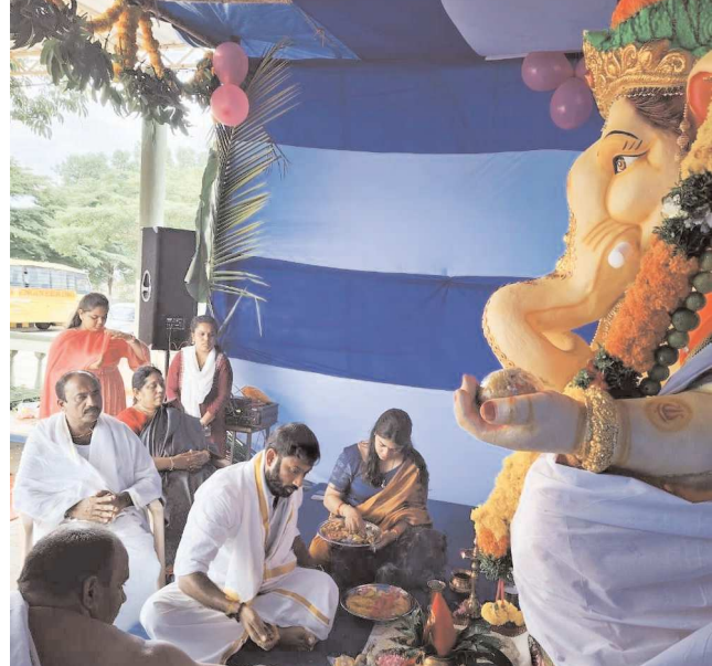
చీరాల, సెప్టెంబర్ 07, పెన్ పవర్:

అధినేత ఆరోగ్యం, ప్రజా సంక్షేమం కోసం వినాయకునికి ప్రత్యేక పూజలు పూజల అనంతరం తక్షణమే వరద ముప్పు బాధితులకు సహాయక చర్యలు