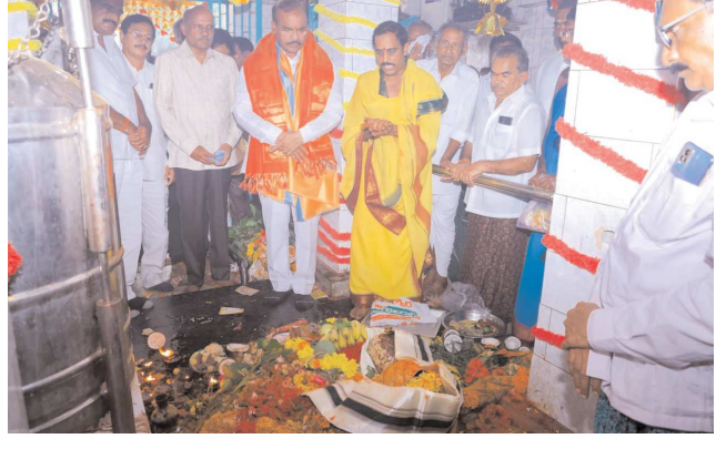
చిలకలూరిపేట పెన్ పవర్ ప్రతినిధి సెప్టెంబర్ 08:

నాదెండ్లలో వినాయక చవితి వేడుకల్లో పాల్గొన్న ప్రతిపాటి