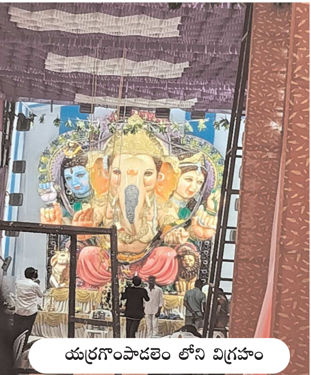
యర్రగంపాడలెం లోని విగ్రహం

పండుగ వాతావరణం గా పల్లెలు పట్టణాలు -గణేశుని విగ్రహాల వద్ద బారులు తీరిన భక్తులు