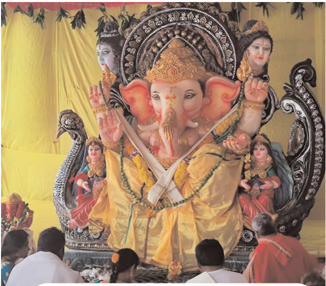
పుల్లచెరువు లోని విగ్రహం

(పెన్ పవర్ ఆర్ సిఇస్ చార్జి యర్రగంపాడలెం సెప్టెంబర్ 7) వినాయక చవితి పర్యవసానం సందర్భంగా నియోజకవర్గ పరిధిలో అన్నీ గ్రామాల్లో ఉత్సవ కమిటీల ఆధ్వర్యంలో ఏర్పాటు చేసిన మండపాల్లో వినాయకుని ప్రతిమలు కొలువు దీరాయి. భారీ ఊరేగింపు నడుమ ప్రధాన సెంటర్ నుండి విగ్రహాలను తరలించడంతో మండల కేంద్రాల్లో