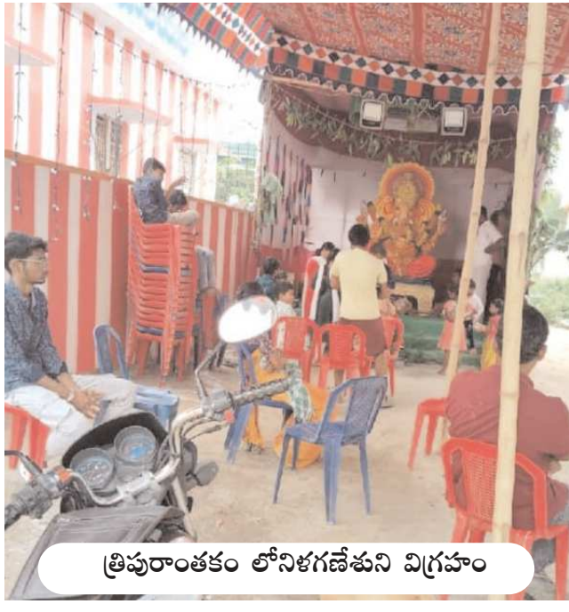
త్రిపురాంతకం లోనిగణేశుని విగ్రహం

కోలాహలం నెలకొంది. ప్రధానంగా యర్రగంపాడలెం, త్రిపురాంతకం, దోర్నాల మండల కేంద్రాల్లో వినాయకుని భారీ విగ్రహాలను ఏర్పాటు చేసి 5లోజుల పాటు భజనలు, వివిధ సాంస్కృతిక కార్యక్రమాలను ఏర్పాటు చేయనున్నారు. తొలిరోజు శనివారం విశేష పూజలు నిర్వహించారు. స్వామివారికి మొక్కులు తీర్చుకున్నారు. ఆయా పార్టీ కార్యాలయాల్లో వేడుకలు జరుపుకుని పురోహితులచే పూజలు జరిపించి అభివృద్ధికి విజ్ఞానం తొలగించి ఆదుకోవాలని బొజ్జ గణపయ్యను కోరారు. కమిటీల ఆధ్వర్యంలో భక్తులకు అసౌకర్యం కలుగకుండా విస్తృత స్థాయిలో ఏర్పాటు చేసారు. యర్రగంపాడలెం మండల కేంద్రంలో డి.డి.పి, వైసీపీ వారుకుల