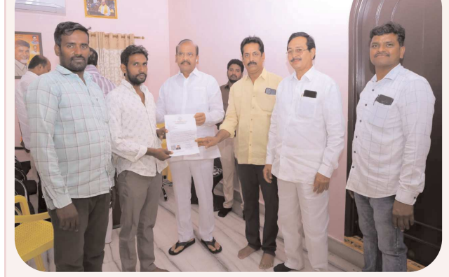
చిలకలూరిపేట పెన్ పవర్ ప్రతినిధి సెప్టెంబర్ 08:

చిన్నారి చికిత్సకు సీఎం సహాయ నిధి చెక్కు అందించిన ప్రతిపాటి