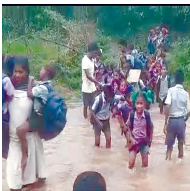
చింతపల్లి సెప్టెంబర్ 7 పెన్ పవర్

కిటిముల పంచాయతీ సీకాయబండ గ్రామ విద్యార్థులు కొత్త వీధికి, పాత వీధికి మధ్యలో పొంగి పొర్లు పారుచున్న కాలువ వర్షాకాలంలో కొండ వాగుల నుంచి జోరగా పారి ఒక్కసారిగా కాలువ పొంగే అవకాశం అభయము తలచి చిన్నారులు పాత వీధి నుండి కొత్త వీధిలో ఉన్న ఎంపీపీ స్కూలుకు 40 మంది చిన్నారులు కాలువ దాటి వెళుతున్నారు కొత్త వీధిలో ఉన్నా ఎంపీపీ స్కూల్లో 72 మంది చిన్నారులు చదువుచున్నారు ఈ వర్షాకాలంలో చదువు కోసం సాహసం చేసి కాలువ దాటి ప్రమాదాలు తప్పవని స్థానికులు చెబుతున్నారు చిన్నారులు చదువు కోసం వెళ్లి తిరిగి వచ్చేవరకు తల్లిదండ్రులు తమ పిల్లల కోసం బిక్కు బిక్కు పంటు ఎదురుచూస్తున్నారు.