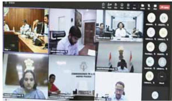
వివిధ జిల్లాల కలెక్టర్లను ఆదేశించిన రాష్ట్ర ప్రభుత్వ