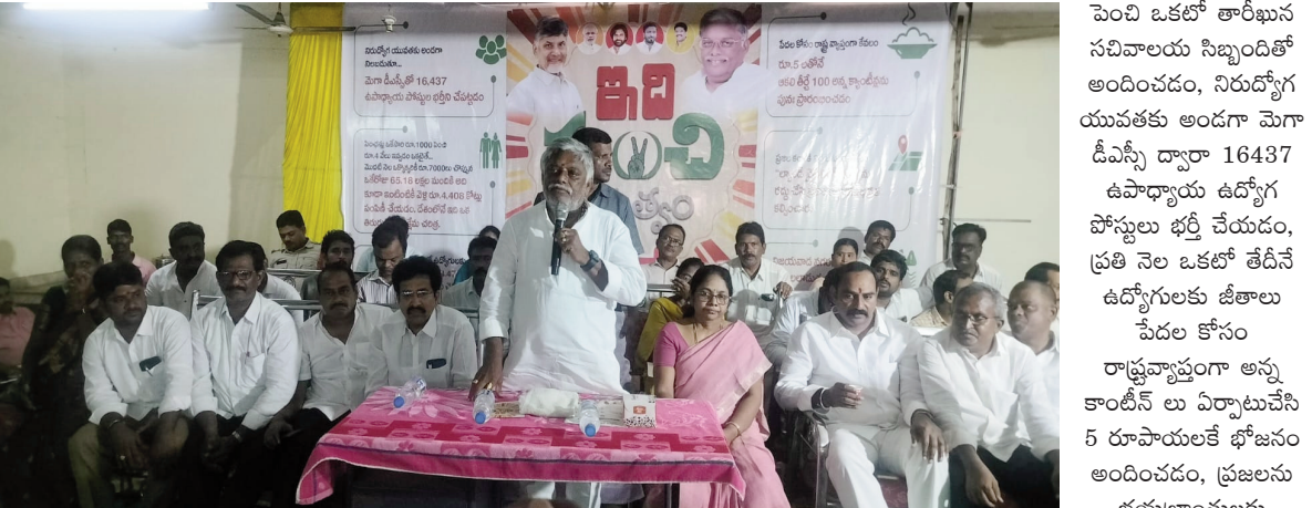
ఇబ్బందులు పడ్డారని కానీ ప్రభుత్వం ముంపు ప్రజలను, రైతులను ఆదుకోవడంలో ముందు ఉందని చంద్రబాబు ప్రజలను ఓ తండ్రి లాగా కాపాడారన్నారు. అదేవిధంగా పిండ్లపై ఒకే సారి మెయ్యి రూపాయలు టైటిల్ గి యాక్ట్ రద్దు చేయడం, పంటి పనులు చేసి ఇది మంచి ప్రభుత్వం అని ప్రజలు మెచ్చుకుంటున్నారన్నారు.