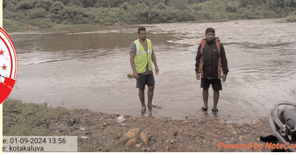
వై రామవరం, పెన్ పవర్, సెప్టెంబర్ 1 :జిల్లా కలెక్టర్ వారి ఆదేశాల సిబ్బందిని కాపలా పెట్టినట్లు మేరకు మండలంలో ప్రవహిస్తున్న సెలయేర్ల వద్ద సచివాలయం ఎంపీడీపీ తెలిపారు.