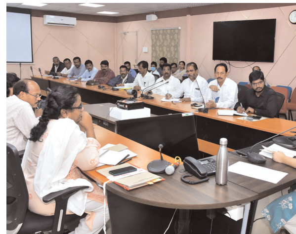
నగరపాలక సంస్థ కమిషనర్ భావన

కాకినాడ, పెన్ పవర్ ఆగస్ట్ 31 : బంగాళాఖాతంలో ఏర్పడిన అల్పవీడన ప్రభావంతో రెండు రోజులుగా విస్తారంగా వర్షాలు కురుస్తున్న నేపథ్యంలో అధికారులు అందరూ సమన్వయంతో పనిచేయాలని, అప్రమత్తంగా ఉండాలని నగరపాలక సంస్థ కమిషనర్ భావన సూచించారు. రానున్న మూడు రోజుల పాటు