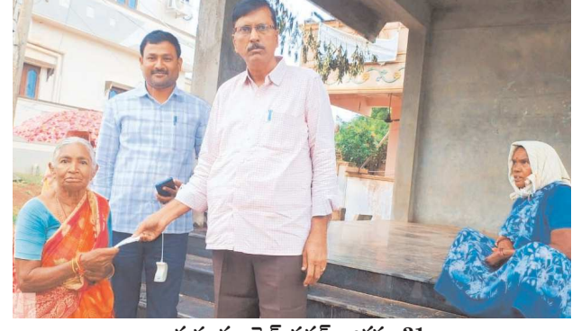
గుడ్లూరు, పెన్ పవర్, ఆగస్టు 31: జోరువానను సైతం లెక్కచేయకుండా, తెల్లవారుజామునే గడప గడపకు వెళ్లి పంచనుదారులకు పెన్ పవర్ అందజేసి, వారి ముఖాల్లో చిరునవ్వులు విరజిల్లించిన సిబ్బంది పనితీరును పలువురు అభినందిస్తున్నారు. మండలంలోని పదహారు సచివాలయాల పరిధిలో ఉన్న 24 పంచాయితీల్లో ఎన్టీఆర్ భరోసా పంచపిణీ కార్యక్రమం శనివారం ముమ్మరంగా జరిగినది. ప్రతి నెల ఒకటి తేదీనే పంచపిణీ ఇవ్వాలని నూతన రాష్ట్ర ప్రభుత్వం లక్ష్యంగా పెట్టుకున్న సంగతి తెలిసిందే. డి.వి.కి తగ్గట్టుగానే పంచపిణీ అందజేస్తుంది. అయితే సెప్టెంబర్ 1వ తేదీన ఆదివారం కావడంతో పంచపిణీ ఒక రోజు ముందుగానే అంటే 31వ తేదీనే పంపిణీ చేయాలని నిర్ణయించింది. ప్రభుత్వం నిర్ణయించినట్లుగానే ఈ ఉదయం నుంచి పంచపిణీ శరవేగంగా కొనసాగింది. ఒకవైపు జోరువాన కురుస్తున్నా సిబ్బంది గొడుగులు, రెయిన్ కోట్ లు ఉపయోగించి సచివాలయ సిబ్బంది, అంగన్వాడీ సిబ్బంది తదితరులు ఉంటింటికి తిరిగి వివిధ రకాల పంచపిణీ చేశారు. తొలిరోజు వరకు మండలం పరిధిలో మొత్తం 94.5 శాతం పంచపిణీ పూర్తయిందని ఎంపీ డి.వి. రాజశేఖర్ తెలిపారు. ఈ పంచపిణీలో సచివాలయ సిబ్బందితో పాటు స్థానిక ప్రజాప్రతినిధులు, నాయకులు స్వయంగా పాల్గొన్నారు. ప్రస్తుతం వాయుగుండం ప్రభావంతో జోరు వార్షులు పడుతున్నందున పంచపిణీ పంపిణీకి కొంత ఆటంకం ఏర్పడుతుందనే ఉద్దేశ్యంతో రాష్ట్ర ముఖ్యమంత్రి ఒకటి, రెండు రోజుల్లో

తొలిరోజు మండలంలో 94.5 శాతం పంపిణీ - నిరంతరం పర్యవేక్షణ చేసిన ఎంపీ డి.వి.