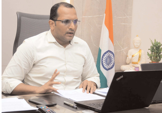
విశాఖ సిటి, పేస్ పవర్, ఆగస్టు 31

టెలికాన్ఫరెన్స్ లో ఆదేశాలు జారీ చేసిన జిల్లా కలెక్టర్