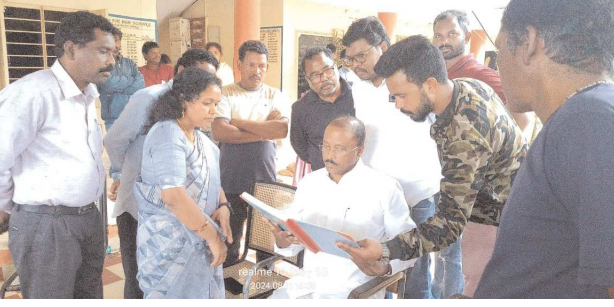
స్టాఫ్ రిపోర్టర్,పాడేరు/గుడెం కొత్తవీధి, ఆరుకు వెలి,పెన్ పవర్, ఆగస్టు 31