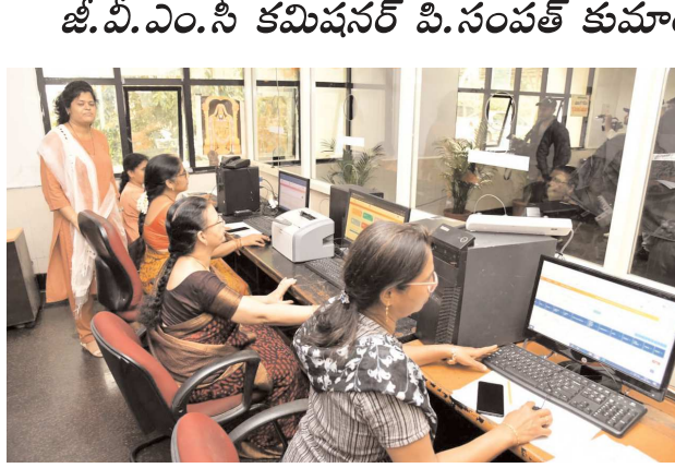
విశాఖ సిటి, పేస్ పవర్, ఆగస్టు-31