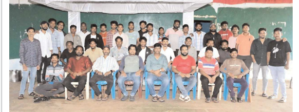
స్టాఫ్ రిపోర్టర్, పాడేరు/ చింతపల్లి/ గూడెం కొత్తవీధి, పెన్ పవర్, ఆగస్టు 31