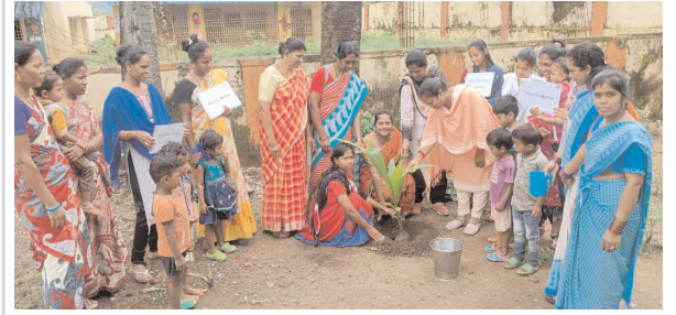
కొయ్యూరు, పెన్ పవర్ ఆగస్టు 31

ఐసిడిఎస్ కార్యాలయంలో మొక్కలు నాటిన సిడిపిఓ అధికారులు