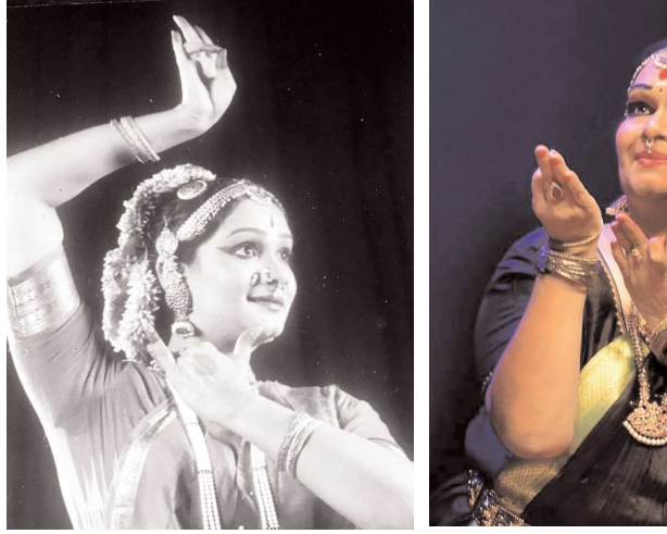
విశాఖ కల్చరల్, పెన్ పవర్ ఆగస్టు 31: