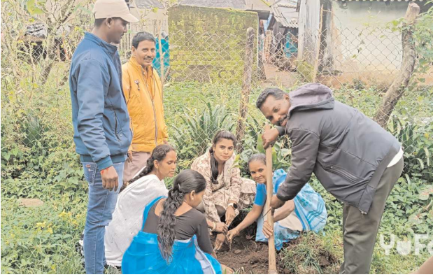
గూడెం కొత్తవీధి, పెన్ పవర్, ఆగస్టు 31

అల్లూరి సీతారామరాజు జిల్లా గూడెం కొత్త వీధి మండలం ఐసిడిఎస్