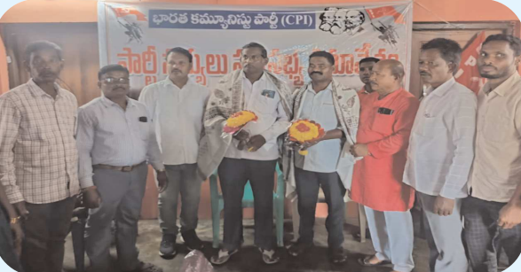
స్టాఫ్ రిపోర్టర్, పాడేరు/చింతపల్లి/ గుడెం కొత్తవీధి, పెన్ పవర్, ఆగస్టు 31