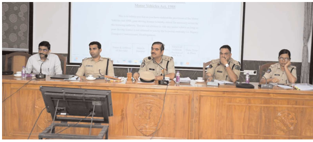
విశాఖ సిటి, పేస్ పవర్, ఆగస్టు 31

నగర పోలీసు కమిషనర్ డా.శంఖభట్ బాగ్గి, ఐ.డి.ఎస్. కాన్ఫరెన్స్ హాల్ నందు పోలీసు ఉన్నతాధికారులతో కలిసి ఏ.డి.సి.పి.లు నుండి ఇన్స్పెక్టర్ స్టాయి అధికారులతో ఏర్పాటు చేసిన ఆగస్టు రివ్యూ మీటింగ్ లో ప్రతి ఒక్క పోలీస్ స్టేషన్ ఇన్స్పెక్టర్ల పనితీరును పరిశీలించారు. ఆగస్టు సమీక్షా సమావేశంలో ముఖ్యముగా ఏ.డి.సి.పి. కేసులు నమోదు చేసేటప్పుడు కఠిన శిక్షలు పడేలా, కేసులను పటిష్టముగా నమోదు చేసేందుకు ఆయా ఏ.డి.సి.పి. చట్టాలపై పూర్తి అవగాహన కల్పించారు. ఏ.డి.సి.పి. యాక్ట్ నందు సేరం పునరాపుతం చేస్తే కఠినముగా వ్యవహరిస్తూ ఏ.డి యాక్ట్ నమోదు చేసేలా, ఓట్లు తెరిచే విధముగా, ఇతర చర్యలపై పబ్లిక్ ప్రాసిక్యూటర్లతో అవగాహన కల్పించారు. అదేవిధంగా సెప్టెంబర్ 01 వ తేదీ నుండి మోటార్ వెహికల్ యాక్ట్ కఠినముగా అమలు చేయు నేపథ్యంలో ఆయా సంబంధిత ఆర్.టి.ఓ అధికారులతో సమావేశమై మోటార్ వెహికల్ యాక్ట్ నందు కేసులు నమోదు పై అవగాహన కల్పించారు. అదేవిధముగా బిడ్స్ యాక్ట్ పైన అవగాహన కల్పించారు, నగరంలో అనధికారిక డిమాండ్లను సేకరించే వారిపై, అనధికారిక చీటీలు / ఫండ్ లు నిర్వహించే వారిపై చట్ట ప్రకారం ఏ విధమైన చర్యలు తీసుకోవాలో, వారి బారిన పడి మోసపోయిన బాధితులకు ఏవిధముగా న్యాయం చేయటం వీలు కలుగుతుందో , నిందితుల ఆస్తులు జప్తు చేసి బాధితులకు న్యాయం చేసే చట్టపరమైన పద్ధతులను అనుభవజ్ఞులైన పబ్లిక్ ప్రాసిక్యూటర్ల తో వివరిస్తూ అవగాహన కల్పించారు. నగరంలో ప్రతి పోలీస్ స్టేషన్ పరిధిలో యాక్ట్ గా ఉన్న