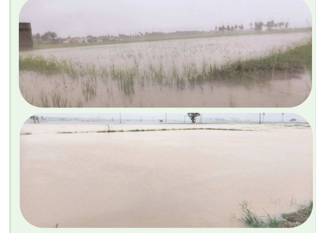
భట్టిప్రోలు పెన్ పవర్ ఆగస్టు 31: బంగాళాఖాతంలో ఏర్పడిన అల్పపీడనం ప్రభావంతో మండలంలో కురుస్తున్న భారీ వర్షాల లోతట్టు ప్రాంతాల్లో వర్షపు నీరు భారీగా చేరుకుంది. అలాగే మండల వ్యాప్తంగా సాగుచేసిన వరి పొలాలు ఆదిలోనే ముంపుకు గురయ్యాయి. దీంతో రైతాంగం ఆందోళనచెందుతున్నాయి. కృష్ణ నదివరవాహ లంక గ్రామాల కూడా కృష్ణ బ్యారేజీ నుండి అధికారులు దిగువకు విడుదల చేసిన వరద నీటి ప్రవాహం ఏ సమయంలో ముంపుకు గురి చేస్తుందోనని భయాందోళన చెందుతున్నారు. ఎడతెరిపి లేకుండా కురుస్తున్న వర్షం కారణంగా పల్లవు ప్రాంతాలలోని గృహాల్లో వర్షపు నీరు చేరి ప్రజలు ఇబ్బందులు పడుతున్నారు. తుఫాన్ తీరం దాటికొద్దీ ఉదురు గాలులు వీచే అవకాశం ఉందని అధికారులు తెలియజేస్తున్న నేపథ్యంలో ఎటువంటి వైపరీత్యాన్ని చవిచూడాల్సి వస్తుందో సని ప్రజలు రైతులు, ఆందోళన చెందుతున్నారు.