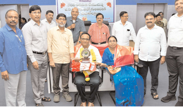
విశాఖ సిటి, పెన్ పవర్, ఆగస్టు 31

జీ.వీ.ఎం.సీలో సుదీర్ఘకాలం విధులు నిర్వహించి ఉద్యోగ విరమణ పొందడం ప్రతి ఉద్యోగికి తప్పనిసరిగా ఉన్నది. ఉద్యోగ విరమణ శేష జీవితానికి వునాది లాంటిది జీ.వీ.ఎం.సీ అదనపు కమిషనర్ ఎస్.ఎస్.వర్మ పేర్కొన్నారు. శనివారం జీవీఎంసీలో వివిధ హోదాలో విధులు నిర్వహించి ఉద్యోగ విరమణ పొందుతున్న 17 మంది జీవీఎంసీ అధికారులు, ఉద్యోగులను ఉన్నతాధికారి కలసి ఆయన సన్మానించారు. ఈ సందర్భంగా అదనపు కమిషనర్ ఎస్.ఎస్.వర్మ మాట్లాడుతూ ఉద్యోగ విరమణ పొందిన వారు జీవీఎంసీలో సుదీర్ఘకాలం ప్రజల కొరకు ఎన్నో సేవలు అందించారు, రోజుల తన కుటుంబం కంటే తమ సంస్థ కొరకు అంతిమ సమయంలో సేవలు అందించి, ఉద్యోగ విరమణ పొందిన ప్రతి ఉద్యోగి తమ శేష జీవితాన్ని అనందంగా గడపాలని అలాగే చిరు స్థాయి నుండి అసిస్టెంట్ కమిషనర్ గా పని చేసిన కొ.రమేష్ జీవితం అంతా సంస్థ సేవ కొరకే అందించారని కొనియాడారు. ఇక వారి శేష జీవితం అనందంగా గడపాలని కోరుకున్నట్లు తెలిపారు. అదనపు కమిషనర్ డి.వి.రమణమూర్తి మాట్లాడుతూ మానవసేవే మాధవ సేవగా భావించి జీవీఎంసీ ఉద్యోగులు పనిచేస్తున్నారని ఉదయం నుండి రాత్రి వరకు రోడ్లపై, కార్యాలయాలలో పనిచేసే ప్రజలకు అనేక సేవలు అందించారని అటువంటి ఉద్యోగులు ఉద్యోగ విరమణ పొందినప్పుడు వారిని