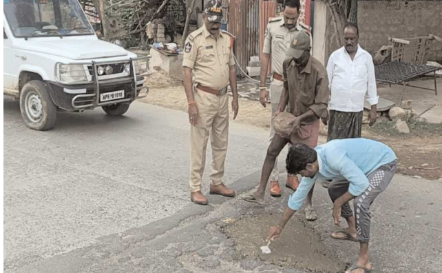
కొమరోలు పెన్ పవర్ సెప్టెంబర్ 3

ఇటీవల రోడ్లపై ఉన్న గుంతలో ద్విచక్ర వాహనం పడి ప్రాణాలు కోల్పోయిన బుల్లెట్ భాషా. పోలీసులను అభినందిస్తూ ధన్యవాదాలు తెలుపుతున్న ప్రయాణికులు, వాహనదారులు.