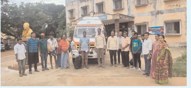
కావలి, పెన్ పవర్ సూపర్ సెషియం 3