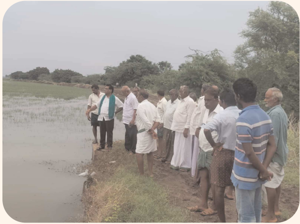
పొన్నూరు పెన్ పవర్ సెప్టెంబర్ 03