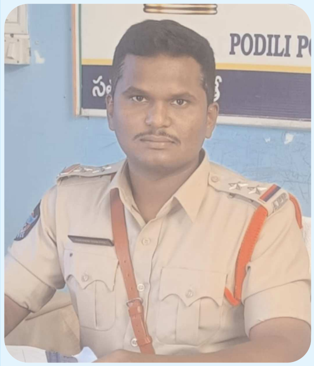
పొదిలి, పెన్ పవర్ సెప్టెంబర్ 03