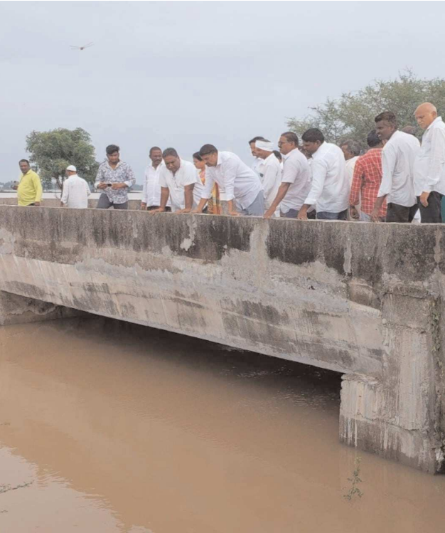
పెన్ పవర్ స్టాఫ్ రిపోర్టర్ బాపట్ల సెప్టెంబర్ 3: పట్టణవాసిపాలెం మండలం భవనం వారి పాలెం కోమలి గ్రామాలలో నీటిమొంపుకు గురైన వరి పొలాలను పరిశీలించారు ఈ సందర్భంగా