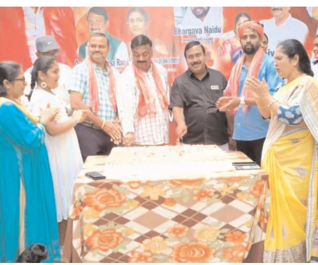
పాదిలి, పెన్ పవర్ సెప్టెంబర్ 3