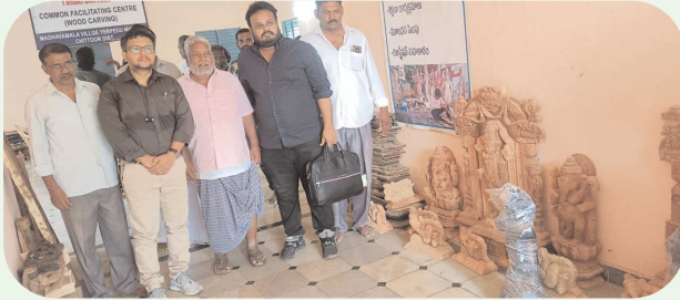
పెన్ పవర్ - ఏప్రిల్, సెప్టెంబర్, 03

మాధవమాల కొయ్య బొమ్మల బౌగోలిక గుర్తింపునకు అధ్యయనం చేయడానికి మండలంలోని మాధవమాల గ్రామంలో బాలాజీ వుడ్ కార్పొరేషన్ సహకారం... (Text continues with details of the study team and their work.)