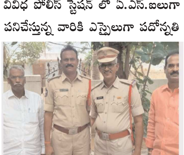
కావలి, పెన్ పవర్ స్కూల్ సెప్టెంబర్ 3

పనిచేస్తున్న వారికి ఎస్సెలుగా పదోన్నతి వివిధ పోలీస్ స్టేషన్ లో ఏ.ఎస్.ఐలుగా పనిచేస్తున్న వారికి ఎస్సెలుగా పదోన్నతిని ప్రకాశం పోలీస్ స్టేషన్ లో పంపిణీ చేసారు... (Text continues with details of the promotion ceremony.)