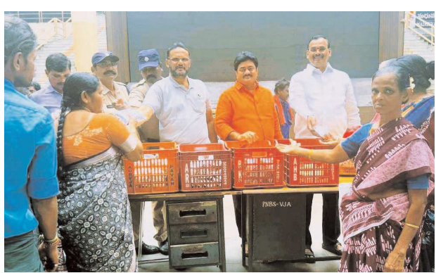
పెన్ పవర్ పాపూరు సెప్టెంబర్ 3