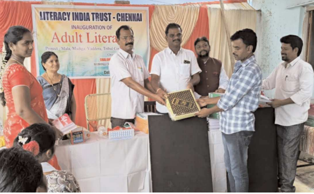
కొమరోలు పెన్ పవర్ సెషియం 3