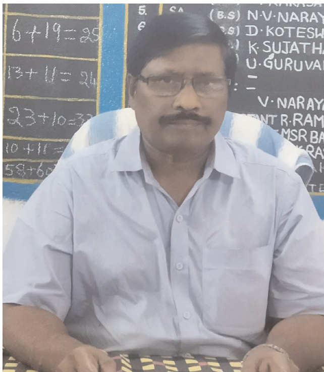
కొమరోలు పెన్ పవర్ సెప్టెంబర్ 3

మరెన్నో ఉత్తమ అవార్డులు అందుకోవాలని అల్లినగరం గ్రామస్తుల ఆకాంక్ష.