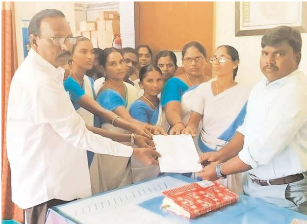
రోజులైనా సొంత డబ్బులు ఖర్చు పెట్టుకోవాల్సి పరిస్థితి ఏర్పడిందన్నారు. ఆశా వర్షం సమస్యలు పరిష్కరించేయాలని, వెంటనే వారికి జీతాలు పెంచాలని సిబిటియూ రాష్ట్ర కమిటీ పిలుపువేసినందుకు, మండల కేంద్రమైన గుడ్లూరులో ఆశావర్షం సిబిటియూ అధ్యక్షులతో ప్రాథమిక ఆరోగ్య కేంద్రం వద్ద మంగళవారం ధర్మా చేపట్టారు.

ఆశా వర్షం సమస్యలు పరిష్కరించేయాలని, వెంటనే వారికి జీతాలు పెంచాలని సిబిటియూ రాష్ట్ర కమిటీ పిలుపువేసినందుకు, మండల కేంద్రమైన గుడ్లూరులో ఆశావర్షం సిబిటియూ అధ్యక్షులతో ప్రాథమిక ఆరోగ్య కేంద్రం వద్ద మంగళవారం ధర్మా చేపట్టారు... (Text continues with details of the protest and demands.)