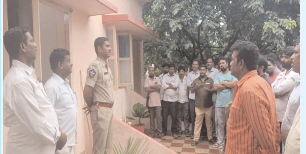
పెన్ పవర్ పాఠశాల సెప్టెంబర్ 03