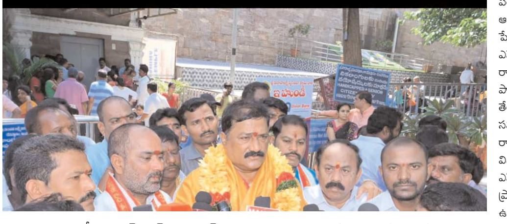
భీమిలి, పెన్ పవర్ , సెప్టెంబర్ 16 :

స్టీల్ ప్లాంట్ పరిరక్షణే మా విధానం, మా నినాదం నా రాజీనామాపై మీవి చవకబారు విమర్శలు