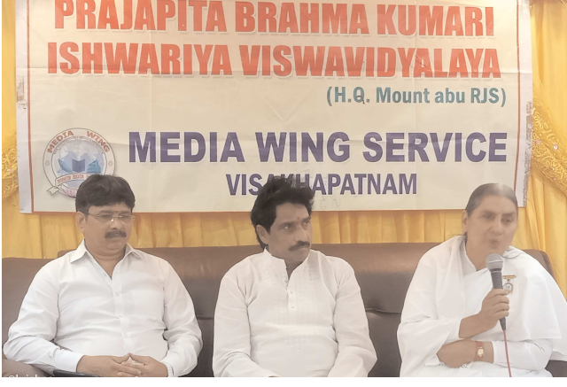
విశాఖ సీటీ, పెన్ పవర్, అక్టోబర్ 16 :