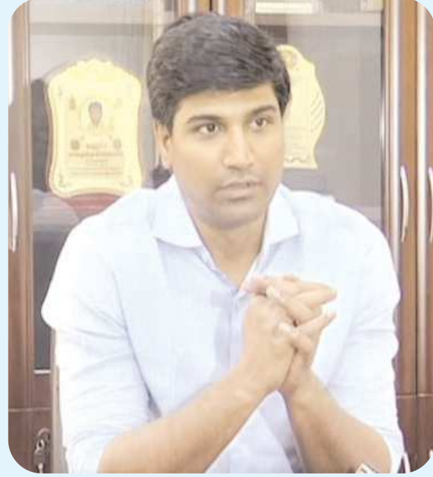
చిలకలూరిపేట పెన్ పవర్ ప్రతినిధి ఆగస్టు 31:

టీడీపీ పార్లమెంటరీ పార్టీ నేత లావు శ్రీకృష్ణదేవరాయలు