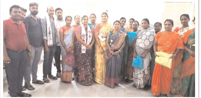
కావలి పేన్ పవర్ ఆగస్టు 31