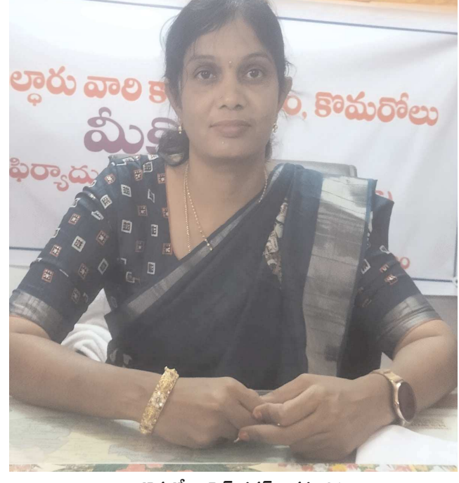
కొమరోలు పెన్ పవర్ ఆగస్టు 31 బంగాళాఖాతంలో ఏర్పడిన అల్పవీడన ప్రభావంతో రాష్ట్రవ్యాప్తంగా