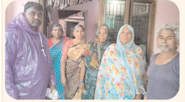
పేన్ పవర్, ఆగస్టు 31, సంతమాగులూరు ఒకవక్క ఎడతెరిపి లేకుండా వర్షం జోరున కురుస్తున్న వర్షాన్ని సైతం లెక్కచేయకుండా ప్రతి గ్రామంలో సచివాలయం సిబ్బంది జోరు వానలో ఇంటింటికి వెళ్లి పించన్న దారులకు నగదు అందించారు. రాష్ట్ర ప్రభుత్వం సెప్టెంబర్ ఒకటవ తారీఖున అందించాల్సిన పించన్న డబ్బులు ఒకటవ తారీఖు ఆదివారం కావడంతో ఆగస్టు 31వ తేదీన శనివారం వృద్ధాప్య పెన్షన్ అందించాలని అధికారులను ఆదేశించడంతో వర్షాన్ని సైతం లెక్కచేయకుండా గ్రామ గ్రామంలో ఉన్న సచివాలయం సిబ్బంది నగదు పంపిణీ చేయడం జరిగింది.