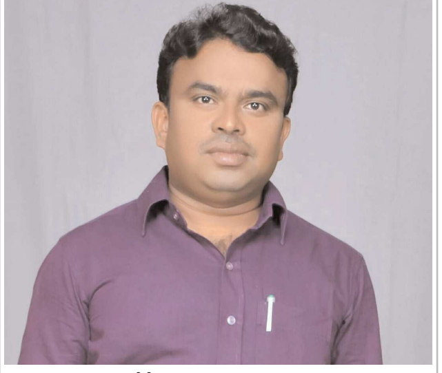
వీసీపల్లి పేన్ పవర్ ఆగస్టు 31