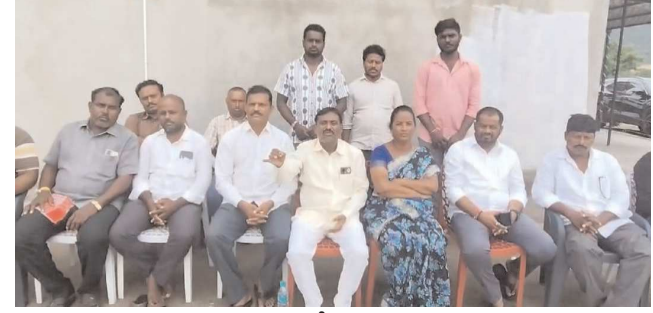
పేన్ పవర్ - శ్రీ కాళహస్తి, ఆగస్టు 31