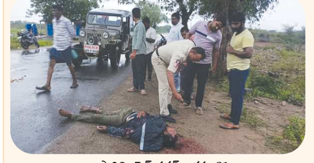
పొదిలి, పేన్ పవర్ ఆగస్టు 31 రోడ్డు ప్రమాదంలో ఒక యువకుడు దుర్మరణం చెందిన సంఘటన పొదిలిలో శనివారం రాత్రి చోటు చేసుకుంది పట్టణ శివారులోని దర్శి రోడ్డు ప్రాంతంలో మోటార్ సైకిల్ పై వెళ్తున్న ఒక యువకుడిని ఒక బెంటో వాహనం ఈ ప్రమాదంలో యువకుడు అక్కడికక్కడే మృతి చెందారు. ప్రమాదంలో మరణించిన యువకుడు మండలంలోని అమూడాలపల్లి కి చెందిన యువకుడిగా తెలిసింది ఈ సంఘటనపై పొదిలి పోలీసులు కేసు నమోదు చేసుకుని దర్యాప్తు జరుపుతున్నారు