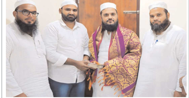
స్టాఫ్ రిపోర్టర్ యర్రగంపాడలెం పెన్ పవర్ సెప్టెంబర్ 7