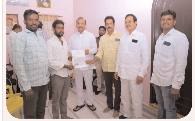
చిలకలూరిపేట పెన్ పవర్ ప్రతినిధి సెప్టెంబర్ 08:

చిన్నారి చికిత్సకు సీఎం సహాయ నిధి చెక్కు అందించిన ప్రతిపాటి