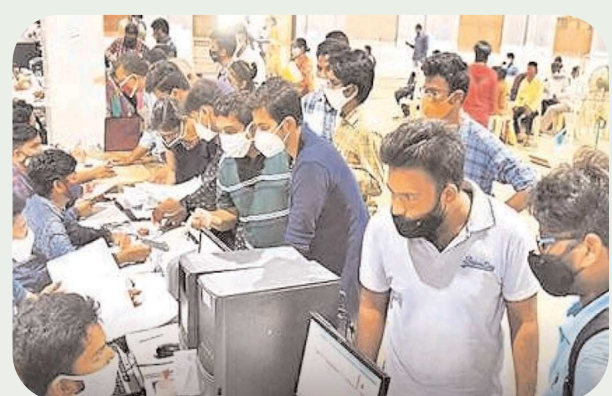
పెన్ పవర్ ప్రతినిధి సెప్టెంబర్ 08: