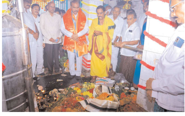
చిలకలూరిపేట పెన్ పవర్ ప్రతినిధి సెప్టెంబర్ 08:

నాదెండ్లలో వినాయక చవితి వేడుకల్లో పాల్గొన్న ప్రతిపాటి