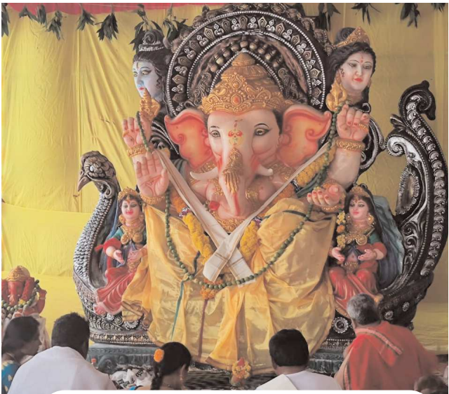
పుల్లచెరువు లోని విగ్రహం

(పెన్ పవర్ ఆర్ సిఇస్ చార్జి యర్రగంపాడలెం సెప్టెంబర్ 7) వినాయక చవితి పర్యటనం సందర్భంగా నియోజకవర్గ పరిధిలో అన్నీ గ్రామాల్లో ఉత్సవ కమిటీల ఆధ్వర్యంలో ఏర్పాటు చేసిన మండపాల్లో వినాయకుని ప్రతిమలు కొలువు దీరాయి. భారీ ఊరేగింపు నడుమ ప్రధాన సెంటర్ నుండి విగ్రహాలను తరలించడంతో మండల కేంద్రాల్లో