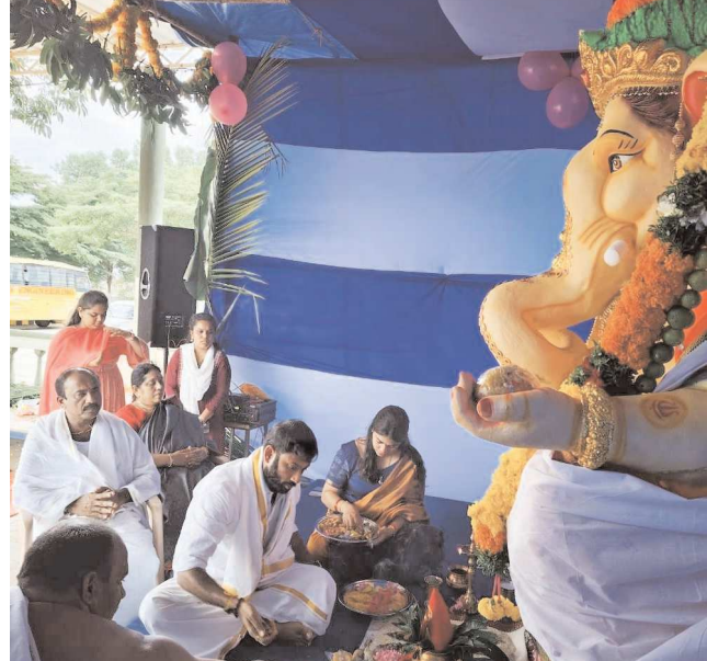
చీరాల, సెప్టెంబర్ 07, పెన్ పవర్:

అధినేత ఆరోగ్యం, ప్రజా సంక్షేమం కోసం వినాయకునికి ప్రత్యేక పూజలు పూజల అనంతరం తక్షణమే వరద ముప్పు బాధితులకు సహాయక చర్యలు