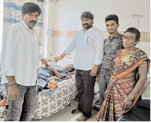
కొమరోలు పెన్ పవర్ సెప్టెంబర్ 7