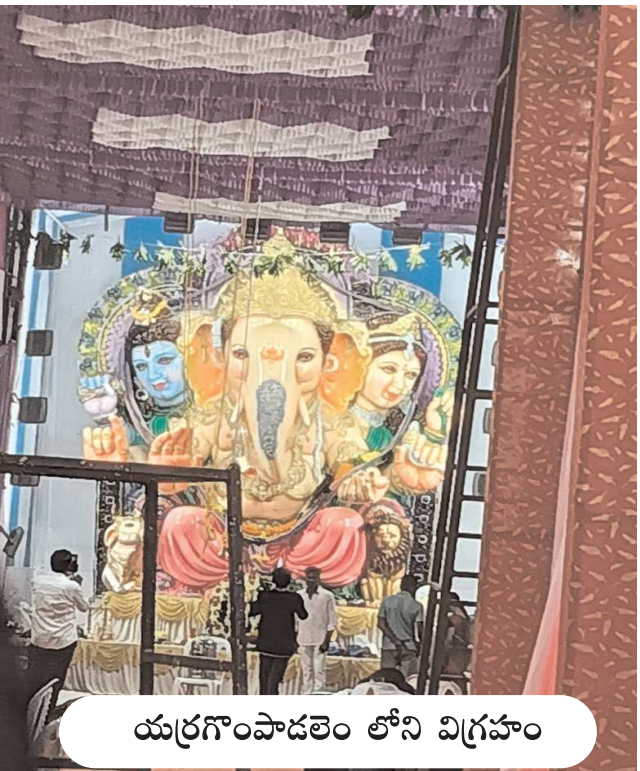
యర్రగంపాడలెం లోని విగ్రహం

పండుగ వాతావరణం గా పల్లెలు పట్టణాలు -గణేశుని విగ్రహాల వద్ద బారులు తీరిన భక్తులు