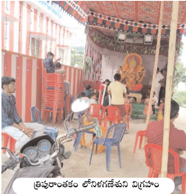
త్రిపురాంతకం లోనిగణేశుని విగ్రహం

కోలాహలం నెలకొంది. ప్రధానంగా యర్రగంపాడలెం, త్రిపురాంతకం, దోర్నాల మండల కేంద్రాల్లో వినాయకుని భారీ విగ్రహాలను ఏర్పాటు చేసి 5లోజల పాటు భజనలు, వివిధ సాంస్కృతిక కార్యక్రమాలను ఏర్పాటు చేయనున్నారు. తొలిరోజు శనివారం విశేష పూజలు నిర్వహించారు. స్వామివారికి మొక్కులు తీర్చుకున్నారు. ఆయా పార్టీ కార్యాలయాల్లో వేడుకలు జరుపుకుని పురోహతులచే పూజలు జరిపించి అభివృద్ధికి విజ్ఞానం తొలగించి ఆదుకోవాలని బొజ్జ గణపయ్యను కోరారు. కమిటీల ఆధ్వర్యంలో భక్తులకు అసౌకర్యం కలుగకుండా విస్తృత స్థాయిలో ఏర్పాటు చేసారు. యర్రగంపాడలెం మండల కేంద్రంలో డి.డి.పి, వైసీపీ వారుకుల