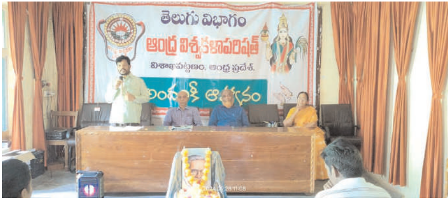
● గుర్తింపుగా 129వ జయంతి వేడుకలు