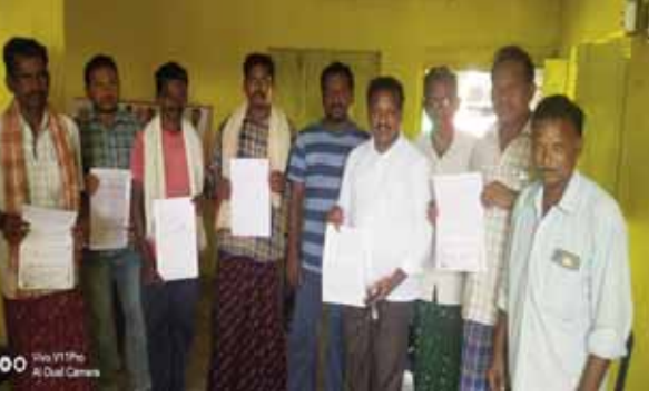
వ్యవసాయం చేసుకోవద్దని ఫారెస్ట్ అధికారులు ఎవరు అడ్డు పడలేదని ఇప్పుడున్న అధికారి మాత్రం వ్యవసాయం చేసుకోనివ్వడానికి వీలులేదని ఆ భూమి ఫారెస్ట్ భూమిని, ఫారెస్ట్ కు సంబంధించిన భూమిలో ఎలా వ్యవసాయం చేస్తారని అంటున్నారని గిరిజన రైతులు ఆవేదన చెందుతున్నారు. 1977 సంవత్సరంలోనే సర్వేనెంబర్ 23 కు సంబంధించిన భూమికి ప్రభుత్వం సెటిల్మెంట్ పట్టాలు ఇచ్చిందని, ఆనాటి నుండి సాగు చేసుకుంటున్నా అన్న గిరిజన రైతులు తెలిపారు.