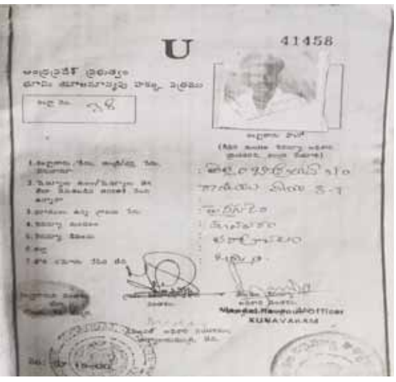
లేదని గిరిజన రైతులను సాగు చేసుకోకుండా అడ్డుపడుతున్నారని తెలిపారు. ఆనాటి నుండి సాగు చేసుకుంటున్నా మమ్మలను ఎవరు