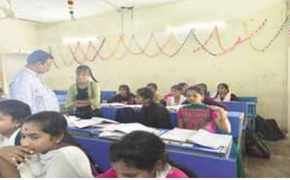
పఠనా సామర్థ్యాలును, వర్క్ బుక్స్, నోట్ బుక్స్ పరిశీలించారు. వెనుకబడిన విద్యార్థులకు రెమిడియల్ తరగతులు నిర్వహించాలని డీఓఐఓ ను ఆదేశించారు. అనంతరం మధ్యాహ్న భోజనం పరిశీలించి రుచి చూడడం జరిగింది. విద్యార్థులు అందరూ మధ్యాహ్నం భోజనం చూడాలని డీఓఐఓ ని ఆదేశించారు.