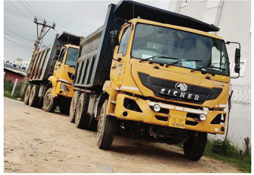
శుక్రవారం సీజ్ చేసిన టిప్పర్ వాహనాలు..