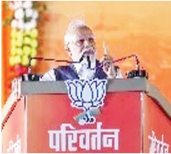
క్రియాశీల రాజకీయాల వైపు యువత మొగ్గుచూపుతోందని ప్రధాని వెల్లడించారు. ఈ

హైదరాబాద్ పెన్ పవర్: ప్రధాని నరేంద్ర మోదీ నేడు ఆకాశవాణి (రేడియో)లో 'మన్ కీ బాత్' ప్రసంగం వినిపించారు. ఈ కార్యక్రమంలో మోదీ మాట్లాడుతూ, ఆగస్టు 29న తెలుగు భాష దినోత్సవం జరుపుకుంటారని, ప్రపంచవ్యాప్తంగా ఉన్న తెలుగువారికి తెలుగు భాష దినోత్సవ శుభాకాంక్షలు తెలియజేస్తున్నారని వివరించారు. ఇక, అంతరిక్ష రంగంలో భారత్ దూసుకెళ్తుందని అన్నారు. చంద్రుడి దక్షిణ ధ్రువంపై దిగిన తొలి దేశంగా భారత్ చరిత్ర సృష్టించిందని వెల్లడించారు. చంద్రయాన్-3 విజయానికి గుర్తుగా అంతరిక్ష దినోత్సవం నిర్వహిస్తున్నామని తెలిపారు. ఈ ఏడాది తొలిసారి అంతరిక్ష దినోత్సవం జరుపుకుంటున్నామని మోదీ వివరించారు. గతంలో లేని విధంగా ఇప్పుడు స్పేస్ సైన్స్ పట్ల యువత ఆకర్షితమవుతోందని పేర్కొన్నారు. రాజకీయాల్లోకి రావాలన్న పిలుపుతో యువత నుంచి స్పందన వచ్చిందని,