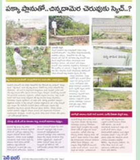
చెరువు కట్టాపై 2021 మే 27న పెన్ పవర్ దినపత్రికలో వచ్చిన కథనం..