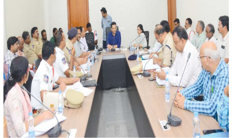
సంబంధిత అధికారులతో కలెక్టర్ సమావేశం..