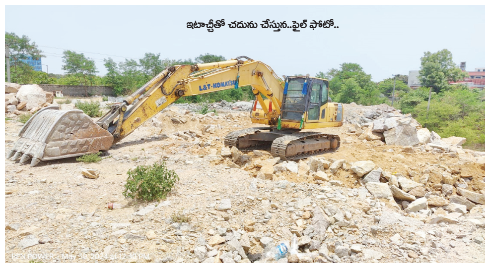
ఇలాచీతో చదును చేస్తున్న..ఫైల్ ఫోటో..