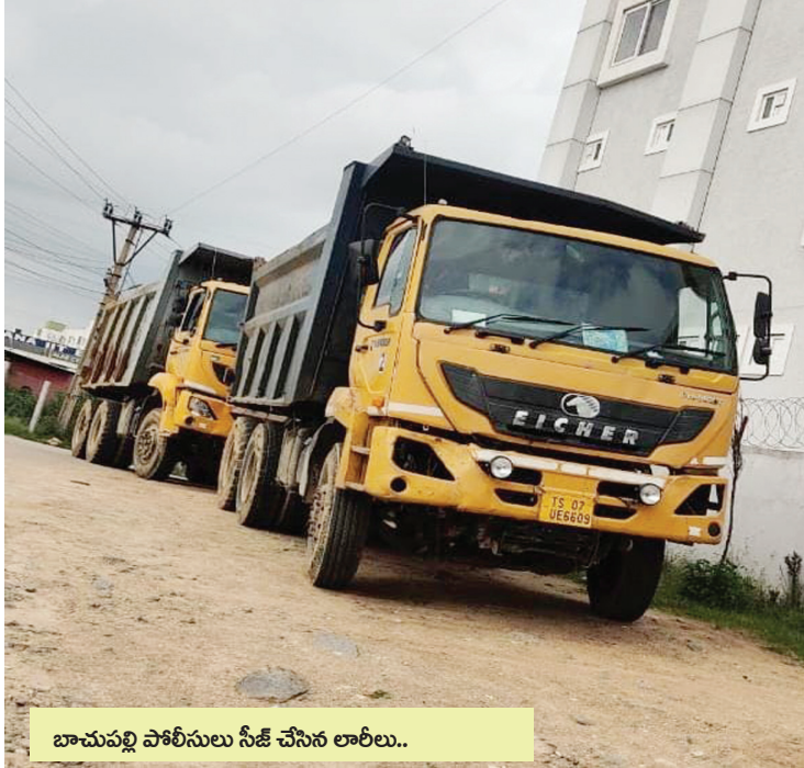
బాచుపల్లి పోలీసులు సీజ్ చేసిన లారీలు..