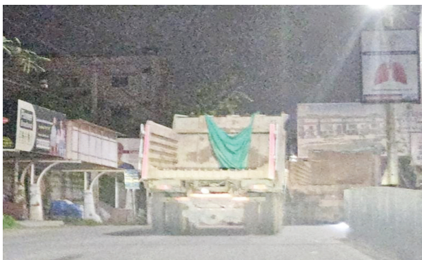
నిజాంపేట్లో వ్యర్థాలను డంపింగ్ చేసి వెక్యుటీవ్ లారీ..