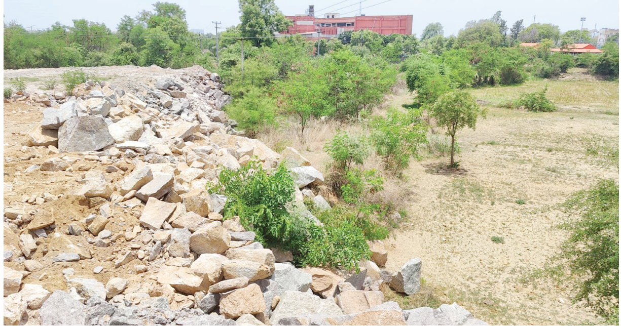
భారంపేట్ సర్వే నెం.472 దిల్ సంస్థ భూమిలో గత మే నెలలో మట్టినొపిన కబ్జాదారులు..ఫైల్ ఫోటో.