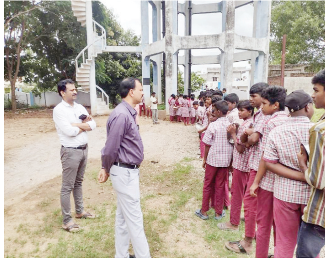
విద్యార్థులతో మాట్లాడుతున్న జేసి..