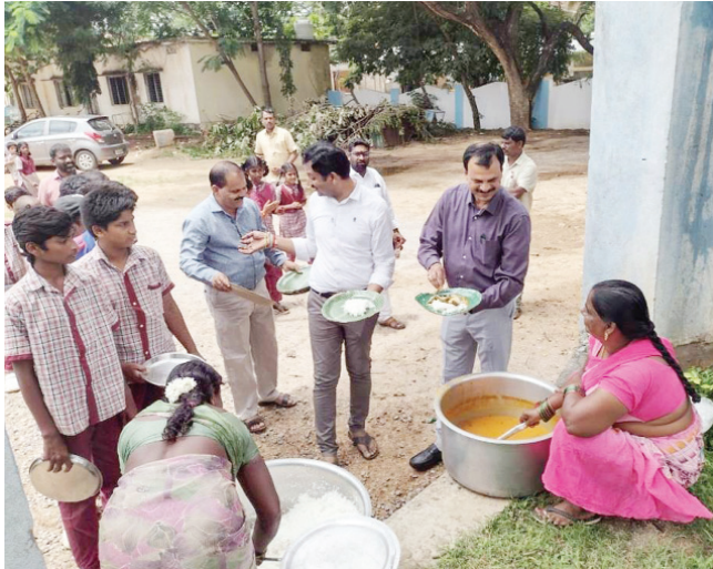
ప్రభుత్వ పాఠశాల విద్యార్థులతో భోజనం చేస్తున్న అదనపు కలెక్టర్ విజయేందర్ రెడ్డి..