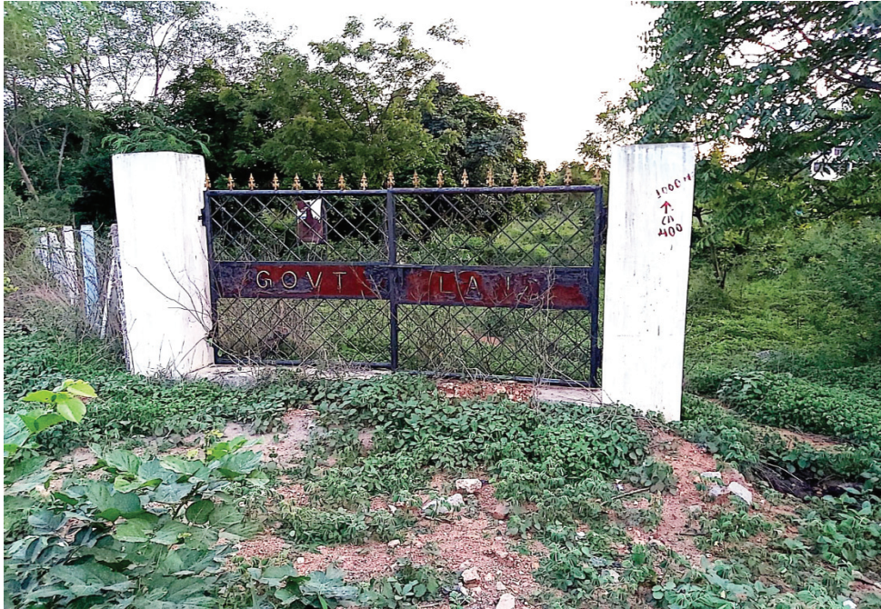
ఎర్రకుంట సర్వే నెం.134ను ప్రభుత్వ భూమిగా ఉమ్మడి ఆంధ్రప్రదేశ్ ప్రభుత్వం ఏర్పాటు చేసిన గేటు.. ఫైల్ ఫోటో..