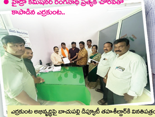
ఎర్రకుంట అభివృద్ధిపై బాచుపల్లి డిప్యూటీ తహశీల్దార్ కి వినితివ్వడం..