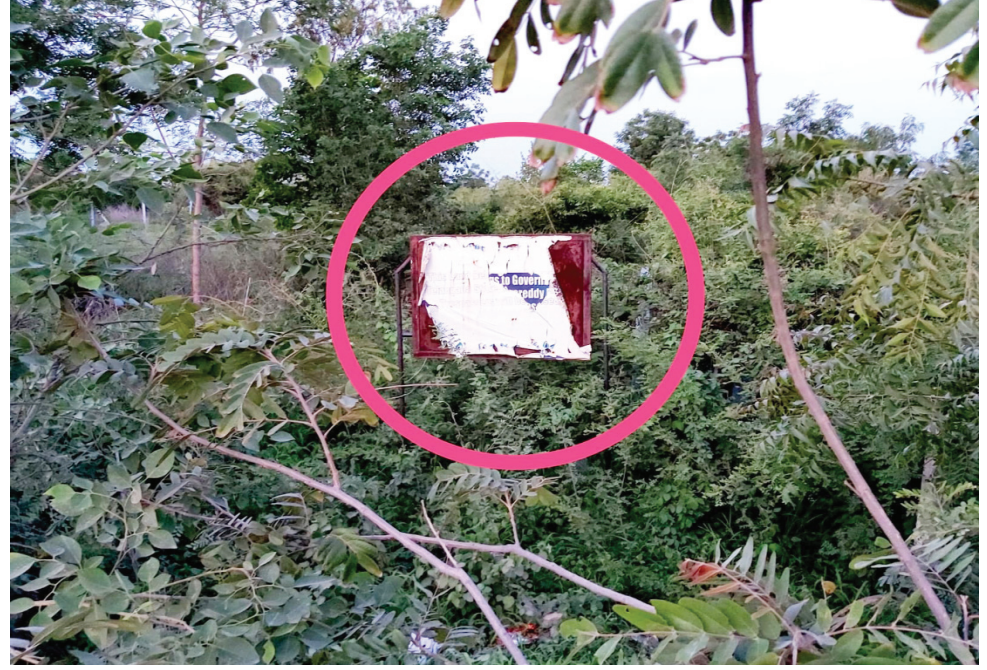
ప్రస్తుతం ఎర్రకుంట కూల్చివేతల స్థానంలో.. గతంలో ఇలా ప్రభుత్వ హెచ్చరిక బోర్డు ఉండేది..ఆరేళ్ళక్రితం ఫైల్ ఫోటో..