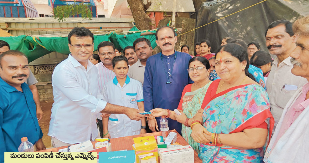
మందులు పంపిణీ చేస్తున్న ఎమ్మెల్యే..