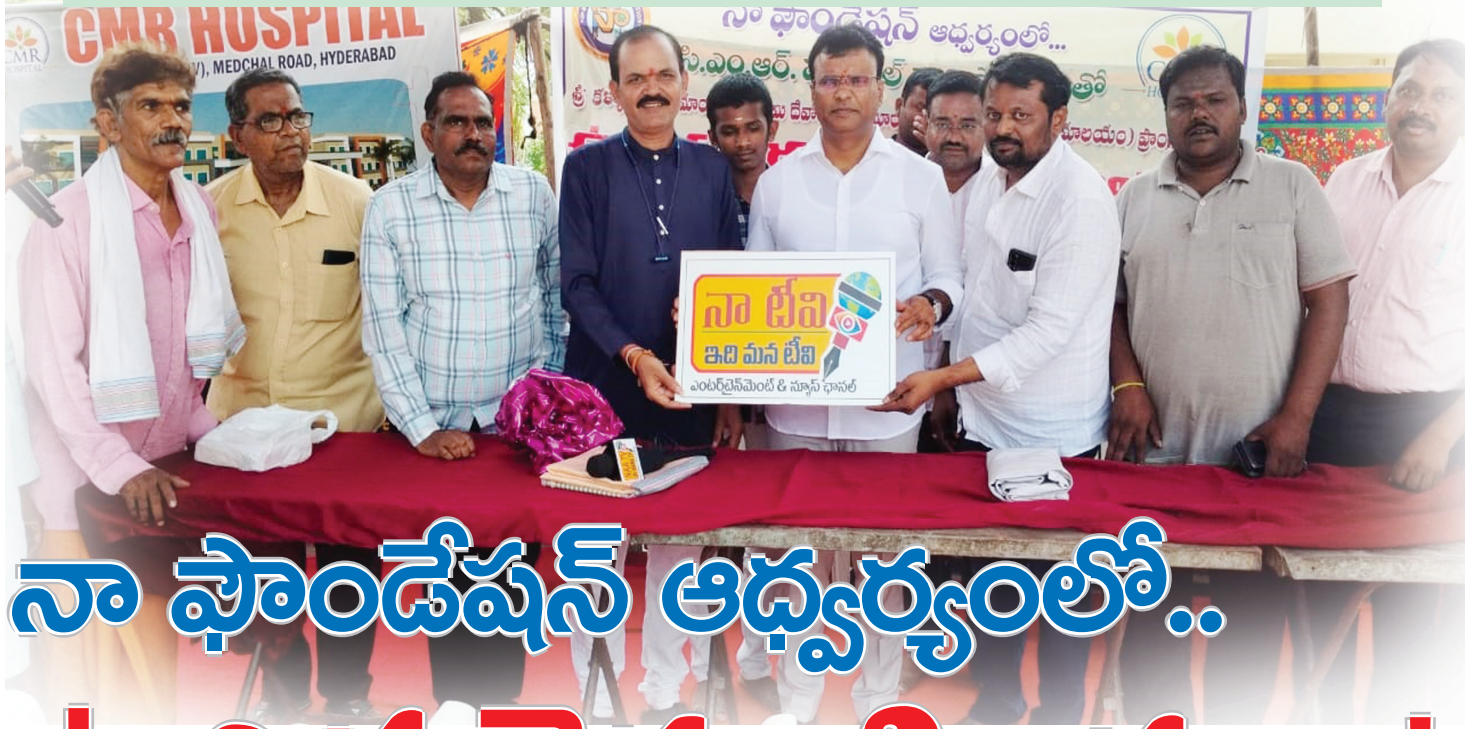
నా టీవీ లోగో ఆవిష్కరణలో ఎమ్మెల్యే వివేకానంద్, సుధీర్ మంకాల, గోగులపాటి, సర్వేపల్లి రమేష్..