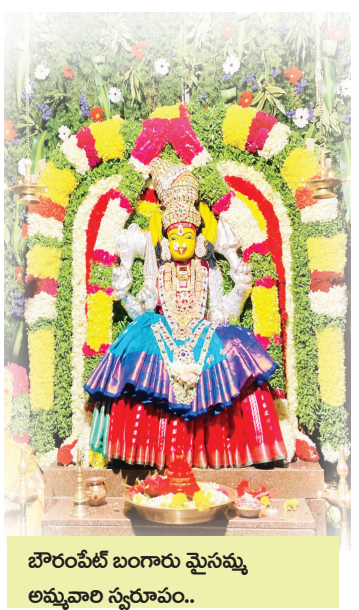
బొరంపేటి బంగారు మైసమ్మ అమ్మవారి స్వరూపం..

దుండిగల్, పెన్ పవర్, ఆగస్టు 11: హైదరాబాద్లో ఆషాఢమాసం బోనాలు ముగిసాయి.. గ్రామాల్లో శ్రావణమాసం బోనాల సంబరాలు మొదలయ్యాయి.. ఈ శ్రావణమాసం బోనాలు తెలంగాణ వ్యాప్తంగా పల్లె పల్లెల్లో ఘనంగా నిర్వహించడం అనాదిగా వస్తున్న ఆచారం.. ఒక్కో గ్రామంలో ఒక్కో అమ్మవారికి ఈ శ్రావణమాసంలో