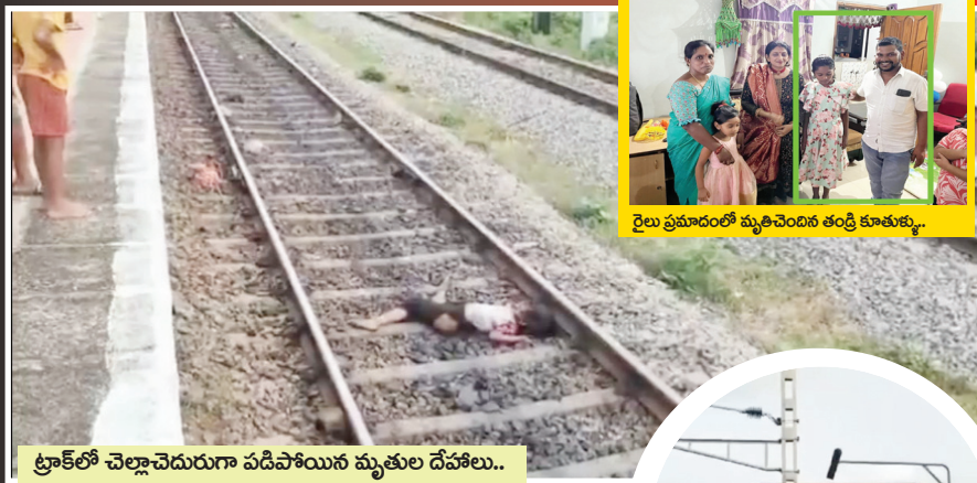
ట్రాక్లో చెల్లాచెదురుగా పడిపోయిన మృతుల దేహాలు..