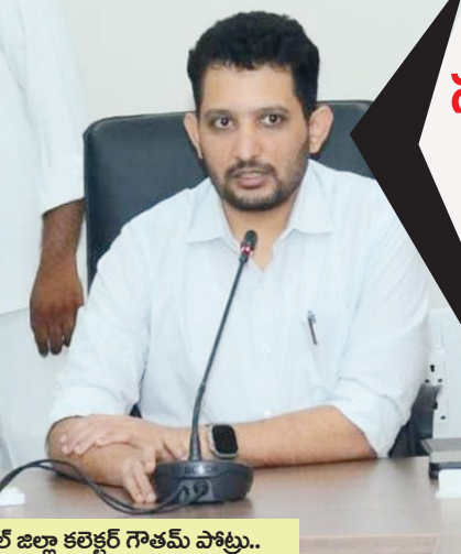
మేడ్చల్ జిల్లా కలెక్టర్ గౌతమ్ పాట్లు..

మేడ్చల్ జిల్లా బ్యూరో, పెన్ పవర్, ఆగస్టు 9: స్వాతంత్ర్య దినోత్సవం వేడుకల ఏర్పాట్లు ఘనంగా నిర్వహించాలని మేడ్చల్ మల్కాజిగిరి జిల్లా కలెక్టర్ గౌతమ్ పాట్లు అధికారులను ఆదేశించారు. ఈ నెల 15న కలెక్టరేట్ ఆవరణలో నిర్వహించబోయే భారత స్వాతంత్ర్య దినోత్సవ వేడుకల ఏర్పాట్లపై శుక్రవారం లోకల్ బాడిస్ అదనపు కలెక్టర్ రాధికా గుప్తా, రెవెన్యూ