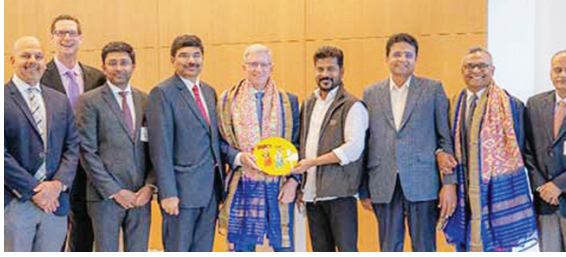
ఈ మేరకు సీఎం రేవంత్ రెడ్డి, మంత్రి శ్రీధర్ బాబు సమక్షంలో ఒప్పందం చేసుకున్నారు. బయోటెక్నాలజీ దిగ్గజ సంస్థ ఆమ్జెన్-మిగతా 2లో హైదరాబాద్ లో టెక్నాలజీ,

హైదరాబాద్ పెన్ పవర్:అమెరికాలో పర్యటనలో ఉన్న సీఎం రేవంత్ రెడ్డి పెట్టుబడుల విషయంలో వేగంగా అడుగులు వేస్తున్నారు. అమెరికాలోనే అతి పెద్ద బయో టెక్నాలజీ సంస్థ అయిన ఆమ్ జాన్ కంపెనీ.. హైదరాబాద్ లో భారీ పెట్టుబడులకు సిద్ధం అయ్యింది. శాన్ ఫ్రాన్సిస్కోలోని ఆమ్ జాన్ కంపెనీ రీసెర్చ్ అండ్ డెవలప్ మెంట్ విభాగంతో.. ఈ మేరకు సీఎం రేవంత్ రెడ్డి, మంత్రి శ్రీధర్ బాబు సమక్షంలో ఒప్పందం చేసుకున్నారు. బయోటెక్నాలజీ దిగ్గజ సంస్థ ఆమ్జెన్-మిగతా 2లో హైదరాబాద్ లో టెక్నాలజీ,