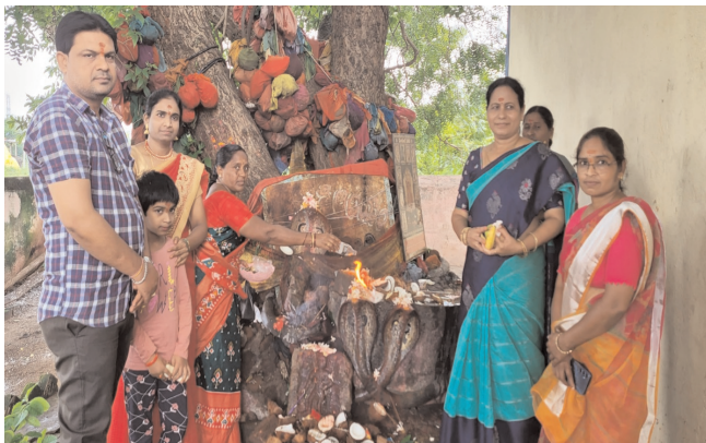
సంతాన నాగేంద్రస్వామిగా మంథని ప్రాంతంలో పేరుగాంచిన శ్రీ సంతానం నాగేంద్ర స్వామి ఆలయంలో గ్రామస్తులతో పాటు ఇతర గ్రామాల నుంచి పెద్దఎత్తున వచ్చిన భక్తులు, పుట్టలో పాలు పోసి ప్రత్యేక పూజలు నిర్వహించారు. పెద్ద

పుట్టలో పాలు పోసి తమ భక్తిని చాటుకున్న మహిళలు మంథని, పెన్‌పవర్ ఆగస్టు 09: నాగుల పంచమి వేడుకలను మహిళలు అత్యంత భక్తిశ్రద్ధలతో మంథని పట్టణంతోపాటు మండలంలోని పలు గ్రామాల్లో ఘనంగా జరుపుకున్నారు. మంథని మున్సిపల్ పరిధిలోని బోయినిపేటలోని శ్రీ నాగులమ్మ ఆలయం తో పాటు, పట్టణంలోని పెంజేరుకట్ట వీధిలోని పురాతన శ్రీనాగమయ్య పుట్ట వద్ద భక్తులు పాలు పోసి ప్రత్యేక పూజలు నిర్వహించి తమ భక్తిని చాటుకున్నారు. ఆలయానికి వచ్చిన భక్తులకు ఎలాంటి ఆసకార్యాలు కలుగకుండా ఆలయ కమిటీ నిర్వాహకులు ఏర్పాట్లు చేశారు. భక్తులు ఇతర దేవాలయాలను సైతం దర్శించుకున్నారు. గాజులపల్లిలోని శ్రీ సంతాన నాగేంద్రస్వామి ఆలయంతో పాటు పలు గ్రామాల్లోని పుట్టల వద్ద పూలు, పండ్లతో భక్తులు పూజలు నిర్వహించారు.