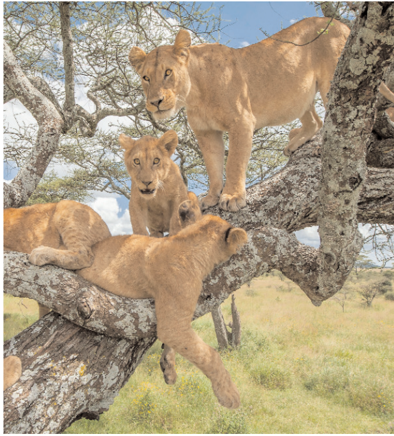
వేటాడుతుంటాయి. వీటి ఆహారం జింకలు, కంచర గాడిదలు, అడవి పందులు, అడవి

పులికి సింహానికి దగ్గరి బంధుత్వం కూడా ఉంది. కాని, పులుల మాదిరిగా సింహాలు ఒంటరిగా ఉండవు. ఒక్కో సమూహంలో 5 నుంచి 16 దాకా కలిసి ఉంటూ జంతువులను వేటాడుతుంటాయి. సింహాలు రోజులో 20 గంటలు విశ్రాంతి తీసుకొంటూ... వాతావరణం బాగుందనుకున్నప్పుడు ఓ నాలుగు గంటలు... అది కూడా రాత్రులే ఎక్కువగా