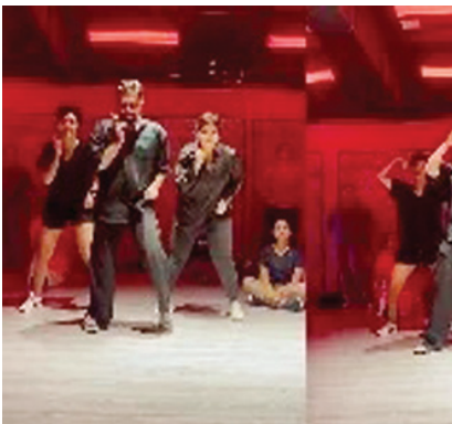
క్రికెటర్లు కూడా ఆశ్చర్యపోయారు. ఈ వీడియో ఇంతగా వైరల్ అయిన తర్వాత తెలిసిందేంటంటే.. అతడు మురళీధరన్ కాదని.

హైదరాబాద్ పెన్ పవర్: మణిక్ గట్టు మాయాజాలంతో దిగ్గజ బ్యాటర్లను సైతం వణికించిన బౌలర్ గానే ముత్యము మురళీధరన్ మనకు తెలుసు. ఎన్నో రికార్డులను తన పేరున రాసుకున్న మురళీధరన్ ప్రస్తుతం ఐపీఎల్ లో సన్ రైజర్స్ హైదరాబాద్ (ఎస్ఆర్హెచ్) కు బౌలింగ్ కోచ్ గా వ్యవహరిస్తున్నాడు. ఇప్పుడీ క్రికెటర్ గురించి ఎందుకు ప్రస్తావించాల్సి వచ్చిందనేగా మీ డౌట్. దానికి ఓ కారణం ఉంది. సోషల్ మీడియాలో ఓ వీడియో ప్రపంచవ్యాప్తంగా వైరల్ అయింది. అందులో మురళీధరన్ బాలీవుడ్ హిట్ సాంగ్ 'తాబా తాబా..' పాటకు డ్యాన్స్ ఇరగడిశాడు. ఇంకేముంది.. ఈ స్పిన్ మాంత్రికుడిలో ఈ కళ కూడా ఉందా? అని అభిమానులే కాదు..