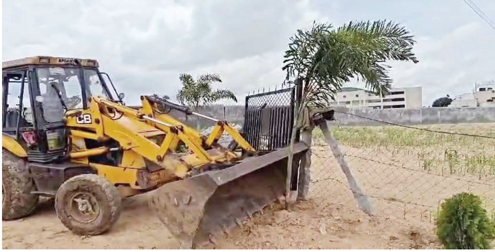
అదనపు కలెక్టర్ ఆదేశాలతో సర్వే నెం.166లో గేటు ఫెన్సింగ్ కూల్చివేత..