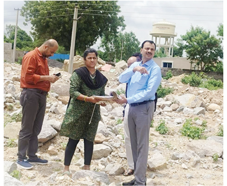
సర్వే నెం.472 దిల్ సంస్థ భూమిలో అదనపు కలెక్టర్, తహశీల్దార్, సర్వేయర్..