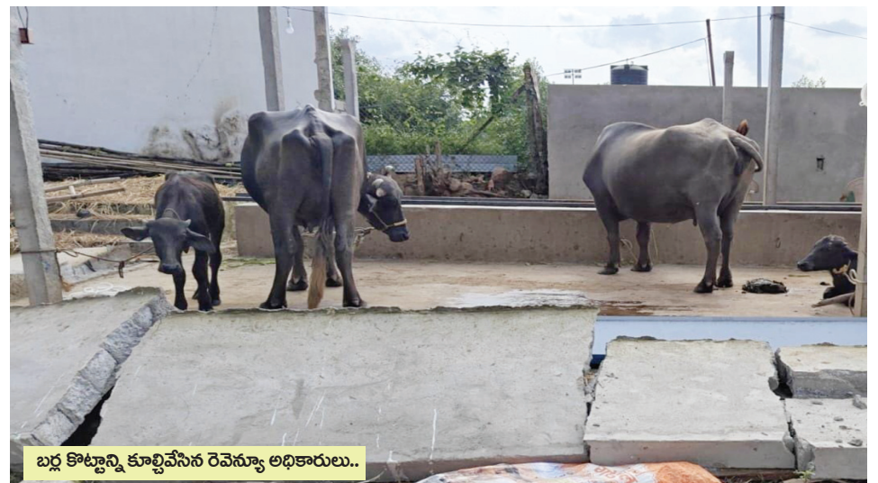
బర్ల కొట్లాన్ని కూల్చివేసిన రెవెన్యూ అధికారులు..