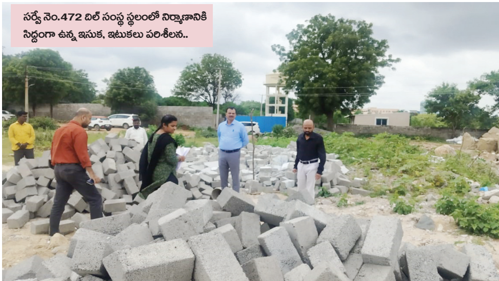
సర్వే నెం.472 దిల్ సంస్థ స్థలంలో నిర్మాణానికి సిద్ధంగా ఉన్న ఇసుక, ఇటుకలు పరిశీలన..

- మొదటి పేజీ తరువాయి 166లో ప్రభుత్వ భూమికి అక్రమంగా ఏర్పాటు చేసిన ఫెన్సింగ్.. 472లో మరొకాన్ని అక్రమ నిర్మాణాలు