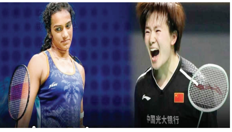
10:00 గంటలకు మ్యాచ్ ప్రారంభమవుతుంది. ఈ మ్యాచ్ సెప్టెంబర్ 18 ఛానెల్ లో ప్రత్యక్ష ప్రసారమవుతుంది. జియో సినిమా యాప్ వెబ్ సైట్ లోనూ అందుబాటులో ఉంటుంది.

హైదరాబాద్ పెన్ పవర్: పారిస్ ఒలింపిక్స్ భారత బ్యాడ్మింటన్ స్టార్ షేయర్ పీవీ సింధు ప్రీ క్వార్టర్స్ చేరుకున్న సంగతి తెలిసిందే. దీంతో సింధు తన కెరీర్ లో వరుసగా మూడోసారి ఒలింపిక్స్ లో నాకౌట్ దశకు చేరుకుంది. తొలి రౌండ్ లో మాల్దీవులకు చెందిన ఫాతిమత్ నబాబ్ అబ్దుల్ రజాక్ ను 21-9, 21-6 తో వరుస సెట్లలో ఓడించిన సింధు.. రెండో రౌండ్ లో 21-5, 21-10 తో ఎస్టోనియాకు చెందిన క్రిస్టీన్ కుబాను వరుస గేమ్లలో ఓడించి నాకౌట్ రౌండ్ (రౌండ్ ఆఫ్ 16) కు చేరుకుంది. ఏకపక్షంగా సాగిన ఈ మ్యాచ్ ను కేవలం 34 నిమిషాల్లోనే ముగించింది. తొలి రెండు మ్యాచ్ లను సునాయానంగా గెలిచిన సింధుకు ప్రీ క్వార్టర్స్ పైనల్ లో మాత్రం కలిసే ప్రత్యర్థి ఎదురు కానుంది. చైనాకు చెందిన 9వ ర్యాంకర్ హీ బింగ్ జియావోతో ఆమె తలపడనుంది. సింధు కన్నా ర్యాంకింగ్ లో మెరుగ్గా ఉన్న చైనా షేయర్ ను ఎదుర్కొని మ్యాచ్ గెలవడం ఈ తెలుగు షేయర్ కు పెద్ద సవాలుగా మారింది. అయితే చివరిసారిగా జరిగిన టోక్యో ఒలింపిక్స్ లో సింధు విజయం సాధించడం విశేషం. కాంస్యం కోసం జరిగిన ఈ పోరులో సింధు 21-13, 21-15 తో బింగ్ జియావోను ఓడించింది. హెడ్-టు-హెడ్ రికార్డ్ లో 9-11 తో బింగ్ జియావోపై భారత షట్టర్ వెనుకంజలో ఉంది. పివి సింధు, హే బింగ్ జియావోల మధ్య రౌండ్ ఆఫ్ 16 మ్యాచ్ గురువారం (ఆగస్టు 1వ తేదీ) పోర్టో డి లా చాపెల్లై ఎరీనాలో జరగాల్సి ఉంది. భారత కాలమాన ప్రకారం రాత్రి