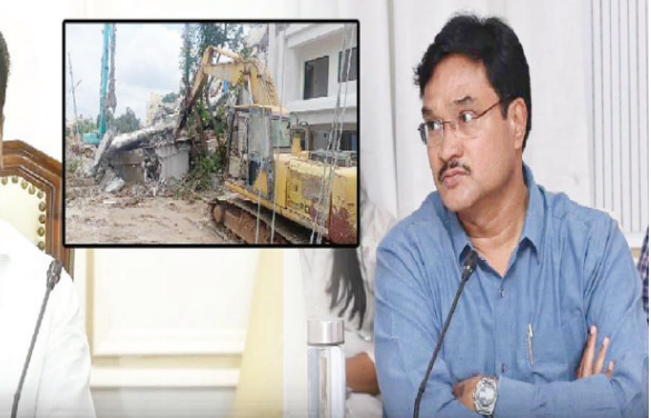
కూడా కొనసాగుతుండన్నారు. ప్రస్తుతం ఉన్న సిబ్బందితో 72 టీమ్స్?ను ఏర్పాటు చేశామని ఆయన వివరించారు.

త్వరలో హైద్రా పోలీస్ స్టేషన్: రంగనాథ్ 2,500 చదరపు కిలో మీటర్ల పరిధి ఉన్న హైద్రాకు త్వరలోనే ప్రత్యేక పోలీస్ స్టేషన్ ఏర్పాటువుతుందని రంగనాథ్ వెల్లడించిన సంగతి తెలిసిందే.. ఈ పోలీస్ స్టేషన్ ద్వారానే ఎస్?వోటీ ఏర్పాటు చేసి కట్టాచారాలపై క్రిమినల్ కేసులు పెద్దామన్నారు. హైద్రాకు రాష్ట్ర ప్రభుత్వం నుంచి ఫుల్ సపోర్టు ఉందని చెప్పారు. పార్ట్? స్థలాలను కాపాడే కాలనీ సంఘాలకు మద్దతిస్తామన్నారు. హైద్రాకు మొత్తం 3,500 మంది సిబ్బంది అవసరమని, త్వరలో రాష్ట్ర ప్రభుత్వం సమకూరుస్తుందని తెలిపారు. హైద్రా కింద అసెట్? ప్రాబ్లెమ్?తోపాటు డిజాస్టర్ రెస్పాన్స్ ఫోర్స్