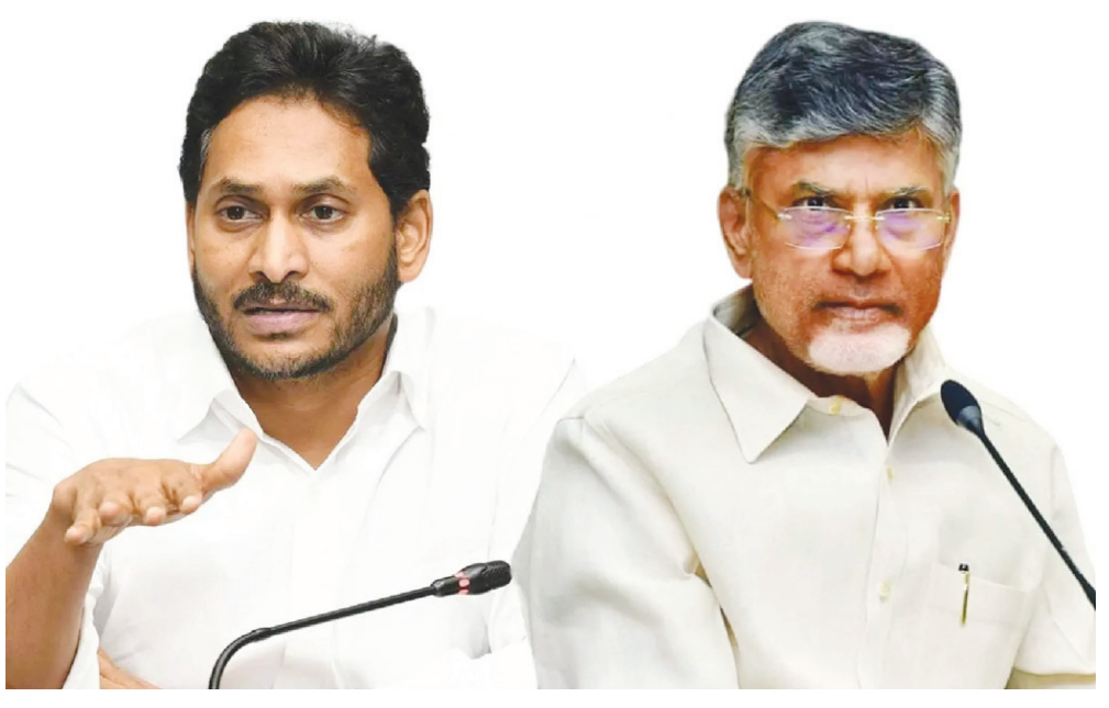
ఆధారప డి ఉంది. ఆ పలుకుబడిని వాడుకుని ఆ ఐదు తీసుకురావాలని కోరుతున్నాను" అంటూ జగన్ తన మెడికల్ కాలేజీలకు వెంటనే అనుమతులు లేఖలో పేర్కొన్నారు.

పెన్ పవర్ డెన్యూరాష్ట్రంలో ప్రజారోగ్య రంగానికి మీ ప్రభుత్వం ఉరితాడు బిగిస్తోంది అంటూ వైసీపీ అధ్యక్షుడు జగన్ ముఖ్యమంత్రి చంద్రబాబుకు బహిరంగ లేఖ రాశారు. సామాన్యులకు నాణ్యమైన వైద్యం అందకుండా చేస్తున్నారని, ఇప్పటికే స్వేచ్ఛబద్ధ డాక్టర్ల సహా సిబ్బంది నియామకాలను ఆపడంతో జీరో వేకెన్సీ పాలిటికి గండి కొడుతున్నారని జగన్ విమర్శించారు. మరోవంక బిల్లులు చెల్లించకుండా ఆరోగ్యశ్రీని నిరుగారుస్తున్నారని, తద్వారా ప్రజలు తమ ఆరోగ్యాన్ని కాపాడుకోవడం కోసం తిరిగి ఆస్పలు అమ్ముకునే పరిస్థితిని తీసుకువస్తున్నారని మండిపడ్డారు. ఈ ఏడాది కొత్తగా ప్రారంభం కావాల్సిన ఐదు మెడికల్ కాలేజీలను ఉద్దేశపూర్వకంగా నిర్లక్ష్యం చేస్తున్నారని, ఈ ఏడాది ఆయా కాలేజీల్లో తరగతులు ప్రారంభం కాకపోవడం మీ ప్రభుత్వ అసమర్థతకు నిదర్శనం అని జగన్ స్పష్టం చేశారు. "అన్ని వసతులు ఉన్నప్పటికీ మీ వైఖరి కారణంగా ఈ కాలేజీలకు గ్రహాణం పట్టింది. కేంద్రంలోని బీజేపీతో పొత్తు ఉన్నప్పటికీ మీరు అనుమతులు తెచ్చుకోలేకపోయారు. ఇది మీ వైఫల్యమే. మీ మద్దతుపైనే కేంద్ర ప్రభుత్వం