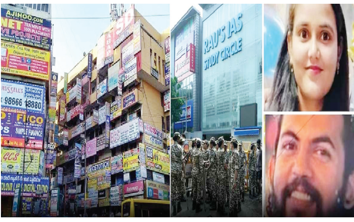
ఉన్నారని ఆరా తీయాయి. సేఫ్టీ రూల్స్ పాటించని కోచింగ్ వర్కస్ చక్క చేయాలని పలువురు విద్యార్థి సంఘాల నాయకులు సెంటర్లపై యాక్షన్ తీసుకోవాలి. ఇన్ స్టిట్యూట్లు నడిపిస్తున్న సంస్థల ప్రభుత్వాన్ని కోరుతున్నారు.

ధిల్లీలో రావుస్ ఐఎస్ స్టడీ సర్కిల్లో జరిగిన విషాదం హైదరాబాద్ లో రిపీట్ కాకూడదు. ధిల్లీలోని ఓల్డ్ రాజేందర్ నగర్ లో జూలై 28న నివిట్ కోచింగ్ సెంటర్ జేస్ మెంట్ లోకి వరదలు వచ్చి ముగ్గురు విద్యార్థులు చనిపోయారు. ప్రమాద సమయంలో గ్రౌండ్ ఫ్లోర్ లో వదుల సంఖ్యలో అభ్యర్థులు చదువుకుంటున్నారు. రోడ్డుపై చేరిన వరద నీరు కారణంగా జేస్మెంట్ గేట్లు విరిగిపోయి అందులోకి నీరు చేరింది. జూలై 28న రాత్రంతా వారం ప్రాణాలు అరచేతిలో పెట్టుకొని బిక్కుబిక్కుమంటూ గడిపారు. రెస్ట్రాన్ టీం ఎంత ప్రయత్నించినా ముగ్గురి ప్రాణాలు పోయాయి. అయితే అదే తరహాలో హైదరాబాద్ లో అమీర్ పేట్, అక్రీసీ క్రాస్ రోడ్, అశోక్ నగర్, దిల్ షుక్ నగర్ లో కూడా భారీగా కోచింగ్ సెంటర్లు ఉన్నాయి. రెండు తెలుగు రాష్ట్రాల సుంచి వచ్చి ఎంతో మంది విద్యార్థులు హైదరాబాద్ లో కోచింగ్ తీసుకుంటున్నారు. ఒక్కో క్రాస్ రూంలో వందల మంది కూర్చుంటారు. స్టడీ హాల్స్ కుప్పలు తెప్పలుగా వెలిశాయి. వాటికి అనుమతులు ఉన్నాయా? వాటిలో ఎన్ని బిల్డింగులకు ఫైర్ సేఫ్టీ వర్కస్ ఉన్నాయి. వివేకపూరి పరిస్థితుల్లో బయటదేండుకు కోచింగ్ సెంటర్లు సేఫ్టీ ప్రికాషన్లు పాటిస్తున్నాయా? GHMC అధికారులు అప్పుడప్పుడు సోదాలు చేస్తున్నారు. జరగరాంది ఏమైనా జరిగితే సంస్థం భారీగా ఉంటుంది. ఇప్పటికైనా గ్రేటర్ హైదరాబాద్ మున్సిపల్ అధికారులు కోచింగ్ సెంటర్లపై దృష్టి పెట్టాలి. ఆ బిల్డింగుల సామర్థ్యం ఎంత.. ఎంతమంది విద్యార్థులు అక్కడ