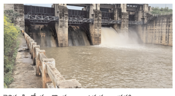
నెల్లిపూడి లో గల కొండ కాల్వ ఉద్బుతంగా ప్రవహించాయి.

గంగవరం, పెన్ పవర్ స్టాప్ రిపోర్ట్ , ఆగస్టు 2: మండలంలో అర్ధరాత్రి నుండి కురిసిన భారీ వర్షాలకు పలుకొండ వాగుల కడతగంగా ప్రవహించాయి. సూరంపాలెం రిజర్వాయర్ 105 చదరపు అడుగులు ఎఫ్ ఆర్ ఎల్ స్థాయిని మించి వరద నీరు ప్రాజెక్టులోకి చేరడంతో ప్రాజెక్టులోని ఒక గేటు ఎత్తి సుమారు 350 క్యూసెక్కుల నీటిని బురద కాలువ పైకి వదిలివేశారు. అర్ధరాత్రి నుండి కురుస్తున్న వర్షాలకు కొండవాగులు ఉద్బుతి ఎక్కువగా ఉన్నాయి. మండల సచివాలయంలో గల పెద్దేరు వాగు,