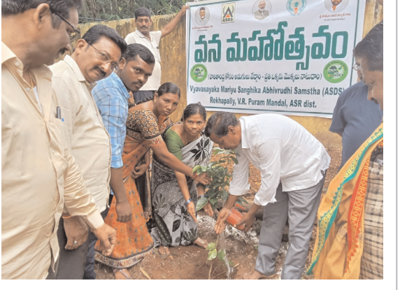
ప్రభుత్వ అధికారులు, ప్రజాప్రతినిధులు, పార్టీల నాయకులు