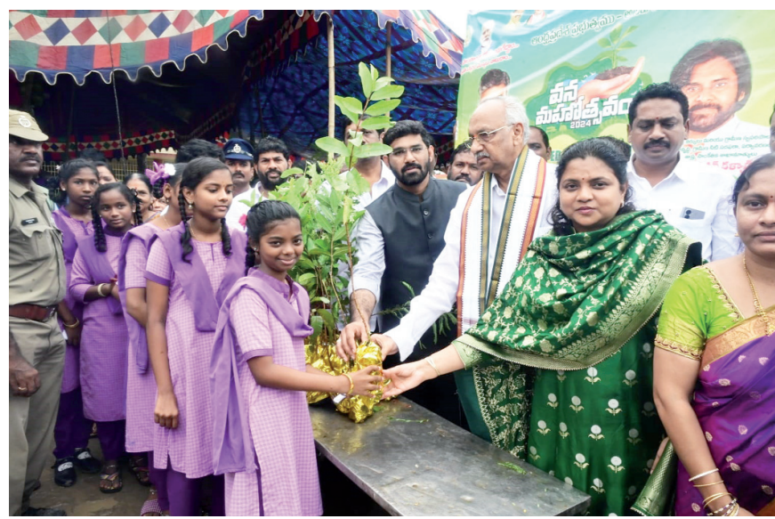
● బేతపూడి ఉన్నత పాఠశాలలో పని మహిళాత్వం కార్యక్రమం