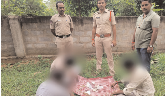
ముగ్గురు వ్యక్తులు అరెస్ట్

జగ్గంపేట, పెన్ పవర్, ఆగస్ట్ 18: జగ్గంపేట గ్రామంలోని శెట్టిబలిజకాలనీ శివారు పంట పొలాలలో రహస్యంగా ఆడుతున్న పేకాట శిబిరంపై ఆదివారం జగ్గంపేట ఎస్సై టి. రఘునాథరావు తన సిబ్బందితో దాడులు నిర్వహించారు. ఈ దాడుల్లో ముగ్గురు పేకాట రాయలను అదుపులోకి తీసుకుని, వారి వద్ద నుంచి రూ.5200 నగదును, పేక ముక్కలను స్వాధీనం చేసుకున్నట్లు ఎస్సై రఘునాథరావు తెలిపారు. వీరిని కోర్టులో హాజరు పరచడం జరుగుతుందని ఎస్ఐ తెలిపారు. జగ్గంపేట మండల పరిధిలో పేకాట, కోడిపందాలు వంటి జూదాలు నిర్వహిస్తే కఠిన చర్యలు తప్పవని ఎస్ఐ హెచ్చరించారు. ఎక్కడైనా చట్ట వ్యతిరేక కార్యకలాపాలు నిర్వహిస్తున్నట్లు తెలిస్తే పోలీసులకు సమాచారం అందించాలని ఎస్సై కోరారు.