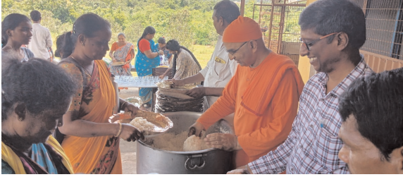
● 160 మందికి వైద్య సేవలు