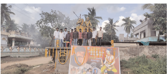
● వాడవాడల పాపన్న గౌడ 374 జయంతి వేడుకలు ఘనంగా