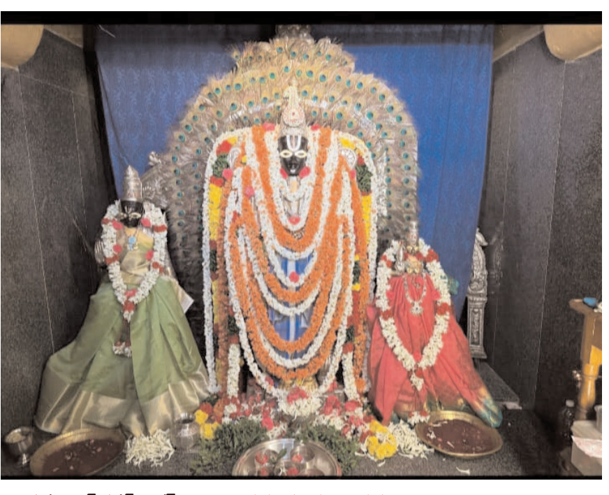
పెద్దాపురం, పెన్ పవర్, ఆగస్ట్ 10 : పెద్దాపురం మండలం తిరుపతి గ్రామంలో కొలువై తొలి తిరుపతిగా ప్రసిద్ధి గాంచిన శ్రీదేవీ, భూదేవీ