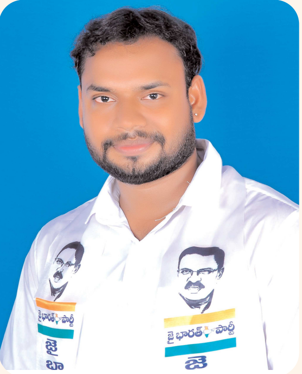
కందుకూరు పెన్ పవర్, ఆగస్టు 8: