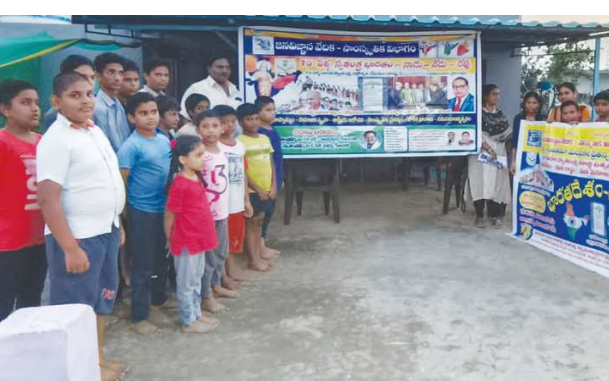
బాపట్ల పెన్ పవర్ ఆగస్టు 08