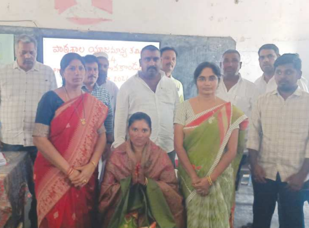
దొనకొండ, 10వ పవర్ ఆగస్టు 8 దొనకొండ లో ప్రశాంతంగా ముగిసిన స్కూల్ మేనేజ్మెంట్ కమిటీ (ఎస్ఎంసీ) ఎన్నికలు పలుచోట్ల చిన్నచిన్న లోపాలతో ఏడు స్కూల్స్ లలో నిదానంగా కోరం లేక ఎన్నిక కావడం జరిగింది. మిగిలిన స్కూల్స్ ఏకగ్రీవంగా చైర్మన్ లను ఉప చైర్మన్ లను ఎన్నుకోవడం జరిగింది.