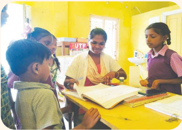
బాపట్ల పెన్ పవర్ ఆగస్టు 08