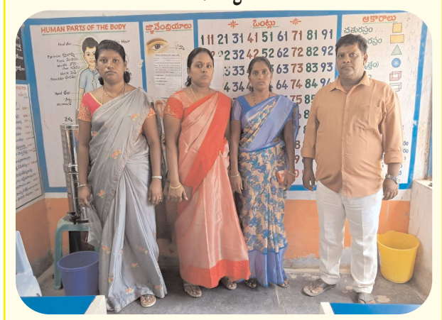
పెద్దగుడిపాడు ఎస్సీ కాలనీ ముగిసిన విద్యా కమిటీ ఎన్నిక