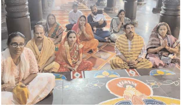
సింహచలం, పెన్ పవర్, ఆగస్టు 5

శ్రీ వరాహ లక్ష్మీస్వామిహస్తామివారి దేవస్థానం, సింహచలంలో గురువారం ఆలయ వైదిక సిద్ధాంత ఆధ్వర్యంలో శాస్త్రోక్తముగా స్వామివారికి 108 బంగారు సంవెంగలతో అత్యంత వైభవంగా స్వర్ణపుష్పార్చన, జరిపించినట్లు ఆలయ కార్యనిర్వహణాధికారి శ్రీనివాసమూర్తి తెలియజేశారు. ఉదయం స్వామివారికి స్వర్ణపుష్పార్చనలో భక్తులు పెద్ద సంఖ్యలో హాజరై స్వర్ణపుష్పార్చణ అత్యంత వైభవంగా, సింహచల పుణ్య క్షేత్రములో దేవస్థాన వేదపండితుల వేదమంత్రాల, నాదస్వర మంగళ వాయిద్యాలతో శాస్త్రోక్తంగా స్వర్ణ పుష్పార్చన వైభవంగా నిర్వహించారు. అర్చకులు వేకువ జామున స్వామిని సుప్రభాత సేవతో మేల్కొలిపి ప్రాతఃకాల పూజలు సాంప్రదాయ బద్ధంగా జరిగాయి. శ్రీదేవి, భూదేవి సమేత శ్రీ గోవిందరాజు స్వామిని సర్వంగ సుందరంగా అలంకరించి, ఆలయ కల్యాణ మండపములో వేదికపై అధిష్టించ జేసి వేద మంత్రాల నాద స్వర మంగళ వాయిద్యాల సదుపయ్య స్వర్ణపుష్పార్చన, సేవ వైభవంగా నిర్వహించారు. ప్రత్యేకంగా భక్తులు స్వామివారి అత్తత సేవలలో పాల్గొని తరించారు.