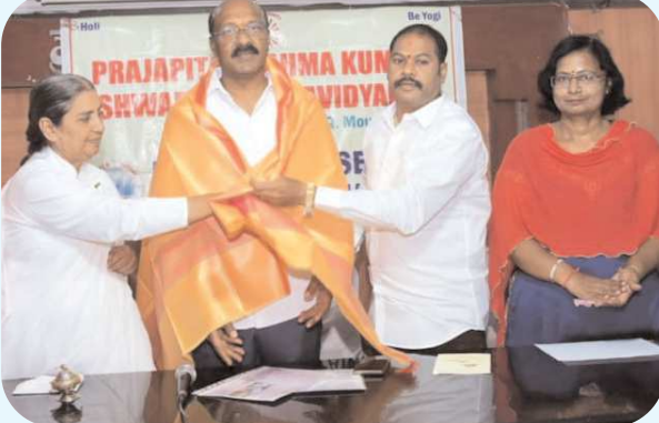
ఎన్.వి.పి, పెన్ పవర్, ఆగస్టు 5