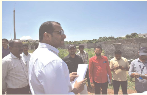
విశాఖ సీటీ, పెన్ పవర్, ఆగస్టు 05

ఆనందపురం మండలంలోని గొట్టిపల్లి, చందక గ్రామాల్లో నిర్మితమవుతున్న గృహ నిర్మాణాలు త్వరితగతిన పూర్తికావాలని జిల్లా కలెక్టర్ ఎం.ఎన్.హరేంద్ర ప్రసాద్ గుత్తెదారులకు, అధికారులకు దిశా నిర్దేశం చేశారు. నిర్మాణాలకు అవసరమైన ఇసుక, సిమెంట్, నీటి సరఫరా కొరత లేకుండా చూస్తామని, రానున్న మూడు మాసాల్లో నిర్మాణాలు పూర్తికావాలని కలెక్టర్ ఆదేశించారు. సోమ వారం ఉదయం విశాఖ రూరల్, భీమిలి, ఆనందపురం మండలాలను జిల్లా కలెక్టర్ పర్యటించారు. ఆనందపురం మండలం గొట్టిపల్లి రెవిన్యూ గ్రామంలోని సర్వే నెంబర్ 20,23, చందక గ్రామంలోని సర్వే నెంబర్ 4లో చేసిన గృహ నిర్మాణాల తే అవుట్ పనుల పురోగతిని కలెక్టర్ పరిశీలించారు. ఈ సందర్భంగా కలెక్టర్ మాట్లాడుతూ మండలం లోని గృహ నిర్మాణాలు త్వరితగతిన పూర్తయ్యే లా చర్యలు చేపట్టాలని గుత్తెదారులను, గృహ నిర్మాణ, రెవిన్యూ శాఖల అధికారులను కలెక్టర్ ఆదేశించారు. నిర్మాణాలకు సిమెంట్ కొరత లేదని, నీటి సరఫరా, ఇసుక సమస్యను పరిష్కరిస్తామని గుత్తెదారులకు కలెక్టర్ ఈ సందర్భం