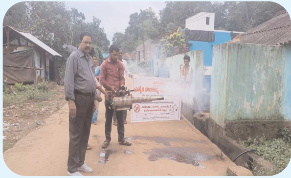
గూడెం కొత్తవీధి, పెన్ పవర్ ఆగస్టు 5