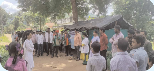
కొయ్యూరు పెన్ పవర్ ఆగస్టు 5

ఐటీడీవీ ఆధ్వర్యంలో సీజనల్ వ్యాధులపై కళాజాతర