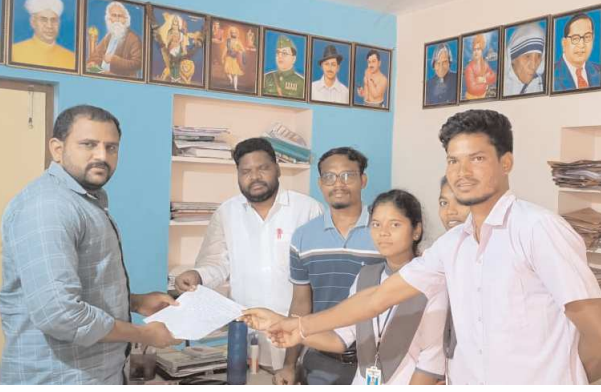
చింతపల్లి, ఆగస్టు 5 పెన్ పవర్ చింతపల్లి ప్రభుత్వ డిగ్రీ కళాశాల సమీపంలో ఉన్న చెత్త వేసే డంపింగ్ యార్డును వేరే ప్రాంతానికి మార్చాలని, దాని వకట్లో ఉన్న పశు

ప్రభుత్వ డిగ్రీ కళాశాల విద్యార్థులు ఆవేదన