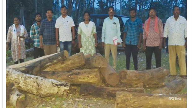
కొయ్యూరు, పెన్ పవర్ ఆగస్టు 5

అక్రమంగా కలప స్థావరంపై పారెస్ట్ అధికారులు దాడులు. 27గన్నర తేకు దుంగలు స్వాధీనం.