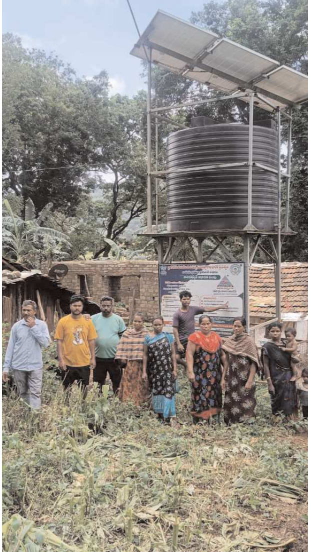
గూడెం కొత్తవీధి, పెన్ పవర్, ఆగస్టు 5

గూడెం కొత్తవీధి మండలంలోని దేవరపల్లి పంచాయతీ రామగడ్డ రోడ్డువీధి గ్రామంలో సోలార్ వాటర్ పంపు గత సంవత్సరం నుండి మరమ్మతులకు గురైందని, పంచాయతీ అధికారులకు విన్నవించుకున్న