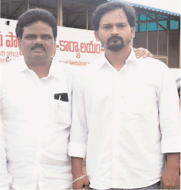
గూడెం కొత్తవీధి, పెన్ పవర్, ఆగస్టు 5

అరకు పార్లమెంట్ వర్కింగ్ కమిటీ మెంబర్ గొర్రె వీర వెంకట్