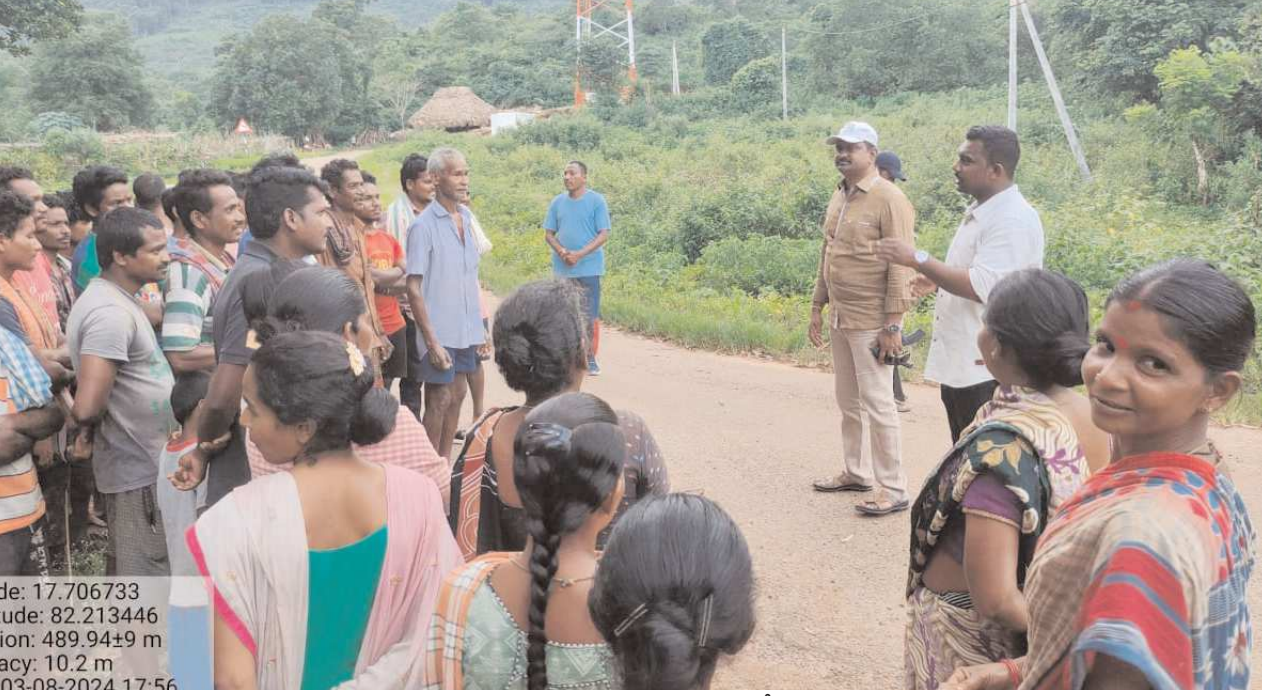
కొయ్యూరు పెన్ పవర్ ఆగస్టు 3

గంజాయి నాటు సారా జోలికి పోవద్దు... కొయ్యూరు సీఐ వెంకటరమణ మంప ఎస్సై లోకేష్