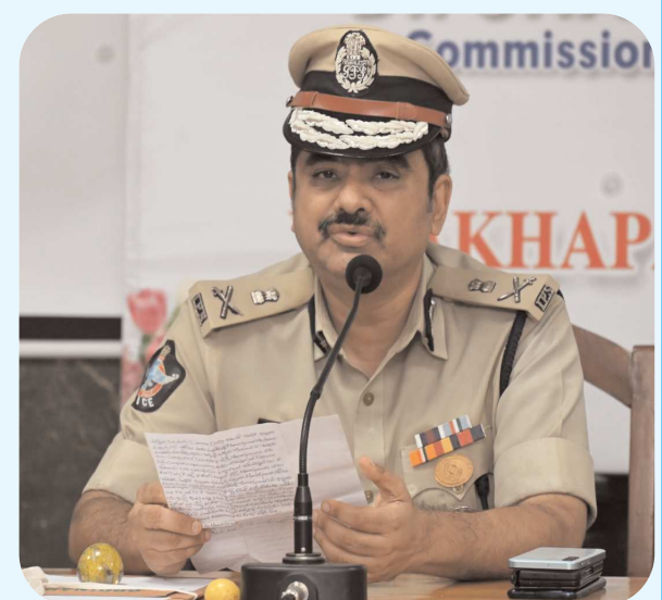
విశాఖ సిటీ షెన్ పవర్ ఆగస్టు 03 :