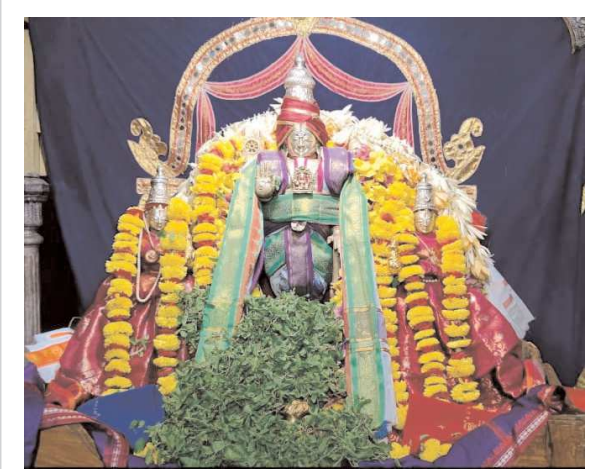
సింహాచలం, షెన్ పవర్, ఆగస్టు 3

శ్రీ వరాహ లక్ష్మీస్వనింహస్వామివారి దేవస్థానం, సింహాచలంలో స్వామివారి సహస్రనామార్చన నేత్రవర్ణంగా సాగింది. ఆర్షిత సేవల్లో భాగంగా ఉత్సవమూర్తి గోవిందరాజస్వామిని ఉభయ దేవేరులతో మండపం లో అధిష్టించజేశారు. పాల్గొన్న భక్తులు, గోత్రనామా లతో సంకల్పం చెప్పి పాంచరాత్రాగమశాస్త్రం విధానంలో విశ్వక్సేనారాధన, పుణ్యాహవనాలతో కార్యక్రమానికి కమనీయంగా జరిపించారు. మంత్రపుష్పం, మంగళాశాసనాల తర్వాత భక్తులకు వేదాశీర్వచనాలు, శేషవస్త్రాలు, స్వామివారి ప్రసాదాలను అందజేశారు.