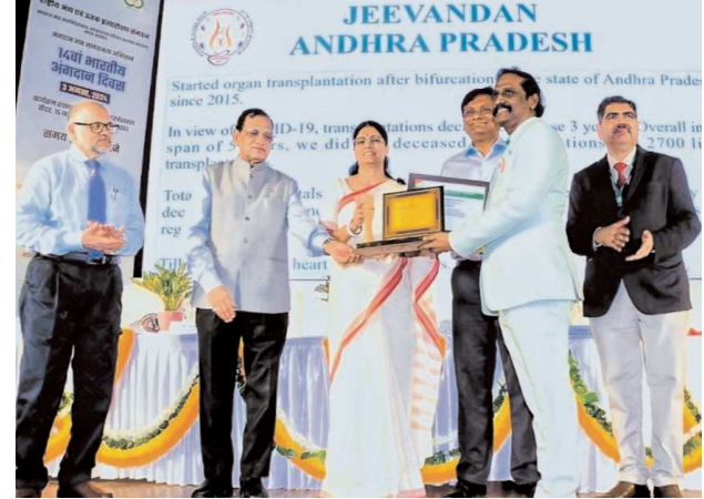
విశాఖ తూర్పు షెన్ పవర్ ఆగస్టు 3