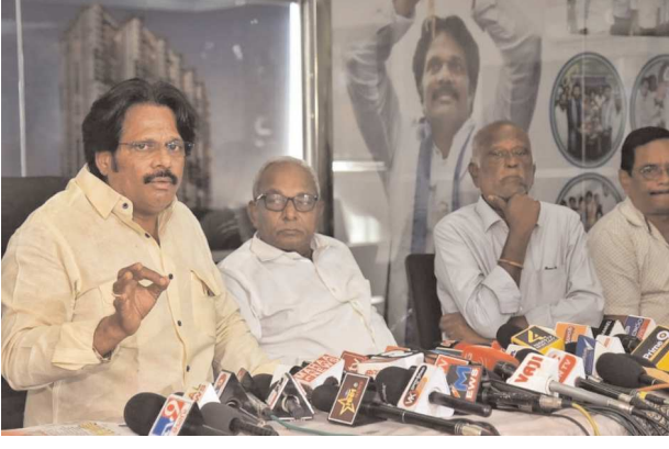
విశాఖ తూర్పు షెన్ పవర్ ఆగస్టు 3

నా పై పలు కథనాలు రాస్తూనే వున్నారు:మాజీ ఎంపీ ఎంవీవీ సత్యనారాయణ