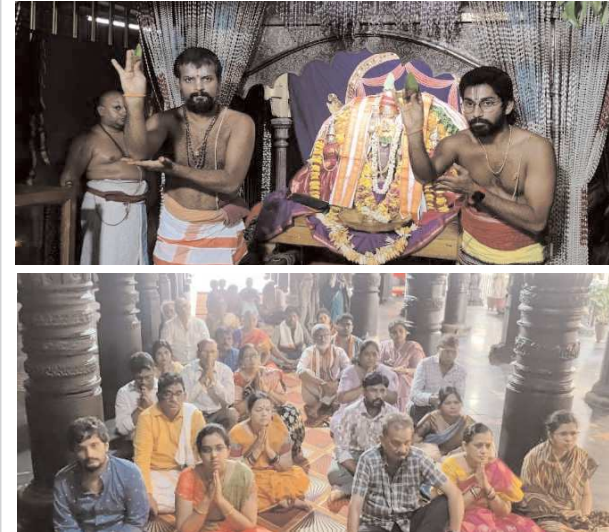
సింహాచలం, షెన్ పవర్, ఆగస్టు 3

శ్రీ వరాహలక్ష్మీస్వనింహ స్వామి నిత్య కల్యాణం నేత్రవర్ణంగా సాగింది. ఆర్షిత సేవల్లో భాగంగా ఉత్సవమూర్తి గోవిందరాజస్వామిని ఉభయ దేవేరులతో మండ పంత్ అధిష్టించజేశారు. పాల్గొన్న భక్తులు, గోత్రనామా లతో సంకల్పం చెప్పి పాంచరాత్రాగమశాస్త్రం విధానంలో విశ్వక్సేనారాధన, పుణ్యాహవనాలతో కార్యక్రమానికి రిక్షికారం చుట్టారు. కంకణధారణ, నూతన యజ్ఞోపవీత సమర్పణ, జీలకర్ర, బెల్లం, మాంగళ్య ధారణ, తలంజ్రాల ప్రక్రియలను కమనీయంగా జరిపించారు. మంత్రపుష్పం, మంగళాశాసనాల తర్వాత భక్తులకు వేదాశీర్వచనాలు, శేషవస్త్రాలు, స్వామివారి ప్రసాదాలను అందజేశారు.