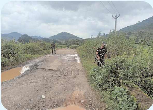
చింతపల్లి ఆగస్టు 3 పెన్ పవర్