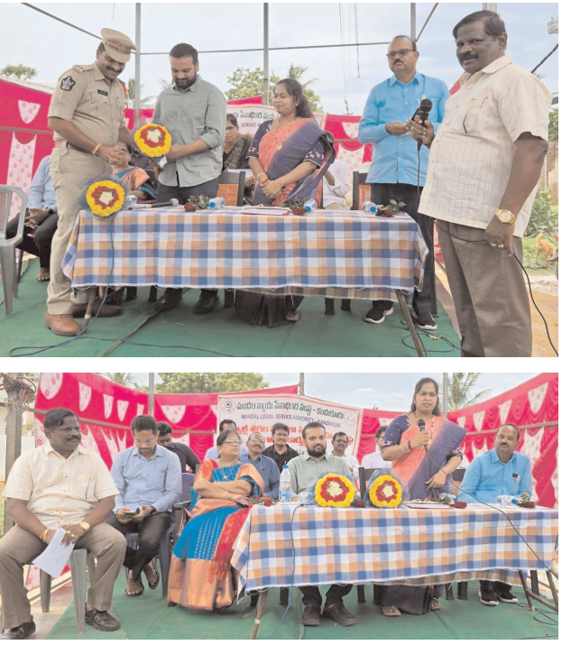
సింగరాయకొండ పెన్ పవర్, ఆగస్టు 3: ఆంధ్రప్రదేశ్ హైకోర్టు వారి ఆదేశాల మేరకు రాష్ట్ర వ్యాప్తంగా గిరిజన ప్రజల ఆవాస ప్రాంతాల్లో వైద్య శిబిరాలతో పాటుగా వారి కొరత ఉన్న హక్కులు, చట్టాల గురించి అవగాహన కార్యక్రమాలు నిర్వహిస్తున్న నేపథ్యంలో ఈరోజు సింగరాయకొండ పంచాయతీ పరిధి సుందర్ నగర్

(ప్రిన్సిపల్ జూనియర్ సివిల్ జడ్జి పి పూర్ణిమ దేవి