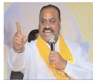
టెక్కలి (సంతకాపూర్తి), పెన్ పవర్, ఆగస్టు 3

టెక్కలి రావడానికి నిరాకరిస్తున్న అధికారులు, ఆఫీసర్లు. పాత పుస్తకాలు తిరగేస్తారేమోనని అధికారులు, నాయకుల్లో గుబులు. అన్యాయం, అక్రమాలు జరిగిందని తెలిస్తే ఎవరిని విడిచి పెట్టేదేలే. నేనున్నానని, మీకేం కాదని నియోజకవర్గ ప్రజలకు భరోసానిస్తూ అడుగులు ముందుకు వేస్తున్న అచ్చన్న.