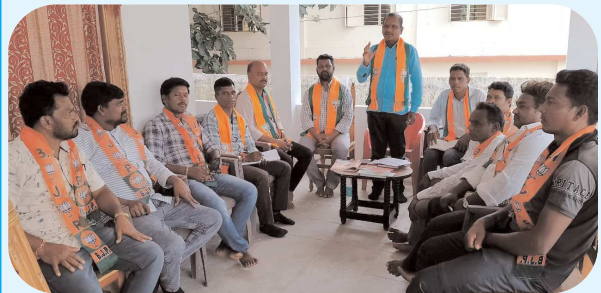
చింతపల్లి ఆగస్టు 28 పెన్ పవర్