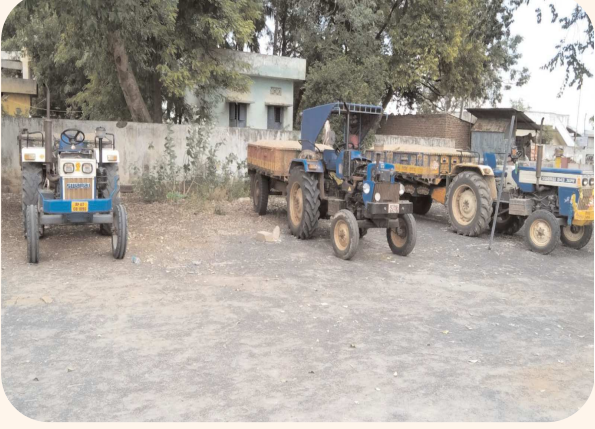
లింగసముద్రం పెన్ పవర్, ఆగస్టు 28