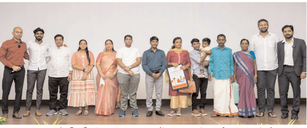
విశాఖ సిటి పెన్ పవర్ ఆగస్టు 28 : బ్లడ్ కేస్టర్, రక్త హీనత వంటి ప్రాణాంతక వ్యాధులతో