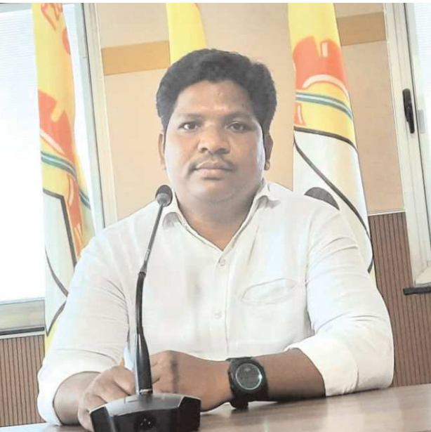
కొయ్యూరు,పెన్ పవర్ ఆగస్టు28

మండలంలో తొమ్మిది సంవత్సరాలుగా ఒకే వృత్తి ఇంజనీరింగ్