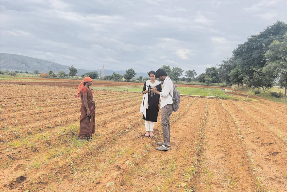
బేస్తవారిపేట, పెన్ పవర్ ఆగస్టు 28:

బెస్ట్ వారి పేట మండలంలోని 19 గ్రామపంచాయతీ పరిధిలోని రైతులు తమ సాగుచేసిన ఉద్యానవన పంటలకు ఇక నమోదు చేయించుకోవాలని బేస్తవారిపేట ఉద్యానవన శాఖ అధికారిని డి శ్లేత తెలిపారు. బుధవారం మండలంలోని ఓండుట్ల గ్రామంలో రైతులు సాగు చేసిన పంటల బిత్తాయి, టమాటం, మామిడి పంటలను శ్లేత పరిశీలించారు. రైతులు గ్రామాల్లో రైతు సేవ కేంద్రం వెళ్లి గ్రామ వ్యవసాయ / ఉద్యాన సహాయకులను కలిసి పొలం పానుబక్ ఆధారిత కార్డు జియో, కౌలు రైతు కార్డు ఉన్నట్లుంటే దానిని