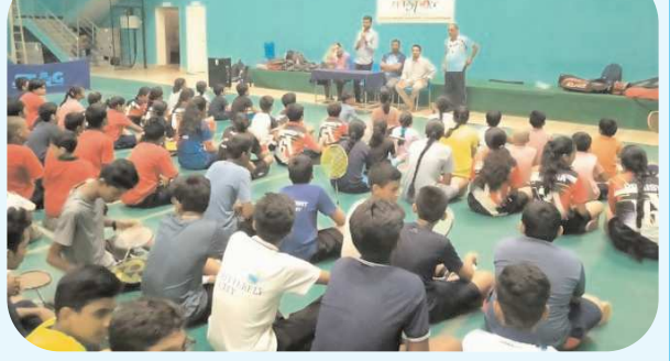
గోపాలపట్నం, పెన్ పవర్, ఆగస్టు 28