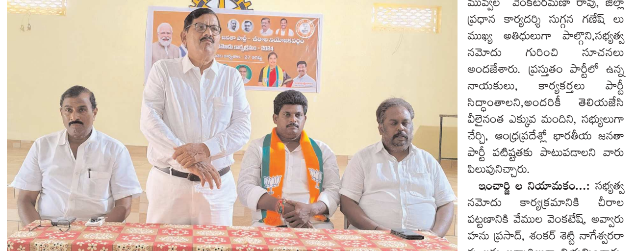
చీరాల, ఆగస్టు28, పెన్ పవర్ :