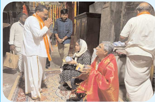
సింహాచలం, పెన్ పవర్, ఆగస్టు 28