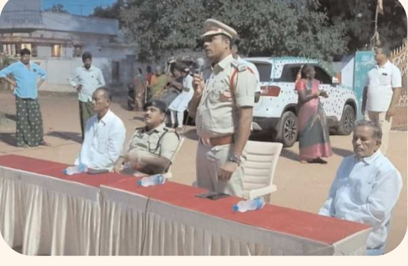
కావలి పెన్ పవర్ ఆగస్టు 28

యువత చెడు నడతను విడిచి మంచి మార్గంలో జీవించాలి