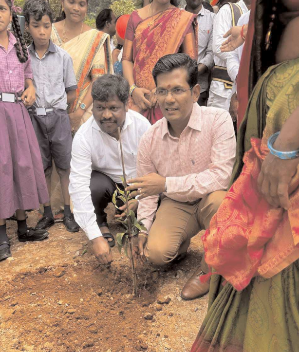
స్టాఫ్ రిపోర్టర్,పాదేరు,గూడెం కొత్తపేడి,పెన్ పవర్,ఆగస్టు 28