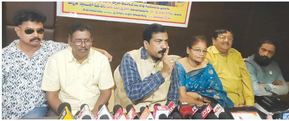
విశాఖ సిటీ పెన్ పవర్ ఆగస్టు 27