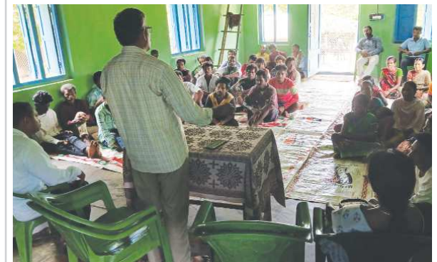
విశాఖ సిటీ పెన్ పవర్ ఆగస్టు 27

కూటమి ప్రభుత్వం ద్రుష్టి సారించి తిరిగి పేదలకు భూములు అప్పగించాలని డిమాండ్