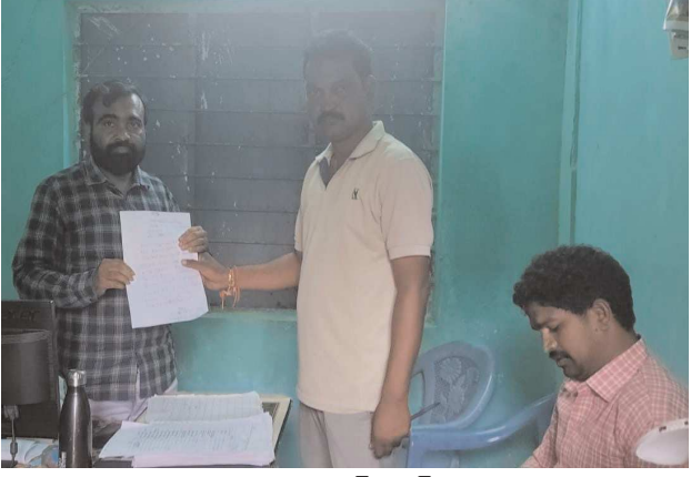
ముంచంగిపుట్ట, పెన్ పవర్, ఆగస్టు 27

మండల కేంద్రంలో జిసిసి గోదాము ఎదురుగా అక్రమ కట్టడం నిర్మిస్తున్న గిరిజనేతరుడు తక్షణమే అక్రమ నిర్మాణం నిల్వదల చేయాలని పీసా కమిటీ మండల బాడీ సెక్రటరీ డిమాండ్ అక్రమ కట్టడాన్ని నిలుపుదల చేస్తామన్న డిప్యూటీ తహసీల్దార్