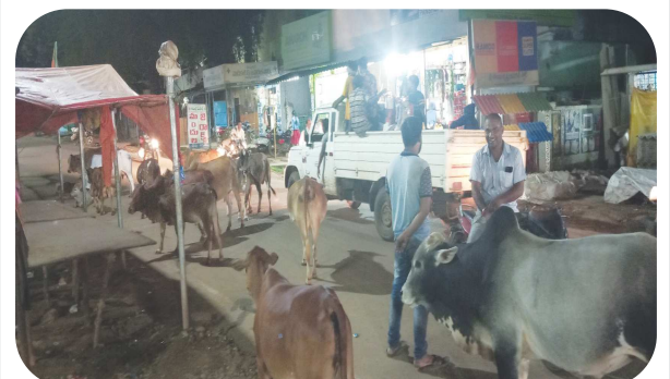
స్టాన్ రిపోర్టర్, పాడేరు, చింతపల్లి, పెన్ పవర్, ఆగస్టు 27

అల్లూరి సీతారామరాజు జిల్లా చింతపల్లి మండల కేంద్రంలో పశు వులను విచ్చలవిడిగా వదిలేయడంతో వాహనదారులు తీవ్ర ఇబ్బందులకు గురి అవుతున్నారు. మంగళవారం సాయంకాలం జీసీసి పెట్రోల్ బంక్, కొత్త బస్టాండ్ పరిధిలో పశువులు విచ్చలవిడిగా రోడ్డుపైకి రావడంతో ప్రయాణం చేసే వాహనదారులు తీవ్ర ఇబ్బందులకు గురి అవుతున్నారు. పశువుల వలన వాహనదారులకు, పాదచారులకు ఏదైనా ప్రమాదం పొచుతుందోమని బిక్కుబిక్కుమంటూ ప్రయాణాలు సాగిస్తున్నారు. పశువుల యొక్క యజమానులు పశువులను రోడ్డు పైన వదిలేయడంతో యజమానులకు పంచాయతీ అధికారులు తెలియజేయాలని పలువురు కోరుతున్నారు.