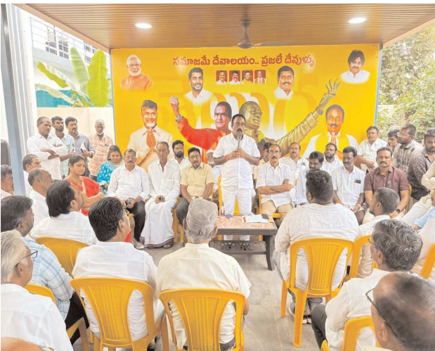
కావలి పెన్ పవర్ ఆగస్టు 27

కావలి పట్టణం తెలుగుదేశం పార్టీ శాసనసభ్యులు కావలి పట్టణాన్ని అభివృద్ధి పరిచేందుకు రోజురోజుకూ ముందగు చేయనున్నారు. కావలి రూరల్ మండలం ప్రాంతమైన తుమ్మలపెంట, అన్నగిరి పాలెం, ఒట్లూరు, నముద్ర తీరంలో ఉన్న గ్రామాలు నిత్యము కావలి పట్టణానికి కొన్ని వందల వాహనాలు రాకపోకలు జరుగుతుంటాయి. గత వైసీపీ ప్రభుత్వంలో ఎన్నోసార్లు ప్రతిపక్ష నాయకులు తెలుగుదేశం పార్టీ