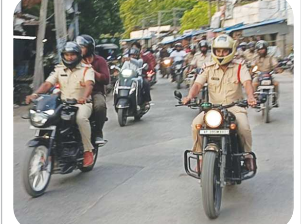
పొదిలి, పెన్ పవర్ ఆగస్టు 27

పొదిలి పోలీసు సర్కిల్ ఇన్స్పెక్టర్ వెంకటేశ్వర్లు సుప్రసం