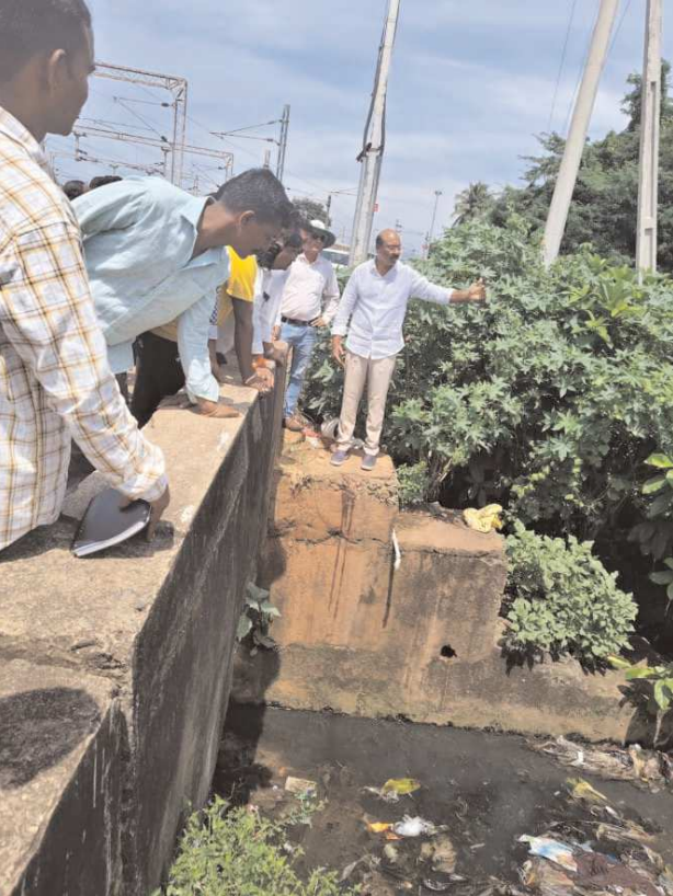
గోపాలపట్నం, పెన్ పవర్, ఆగస్టు 27 : జీవీఎంసీ 91వ వార్డు, పాత గోపాలపట్నం, హరిజన కాలనీ, 89వ