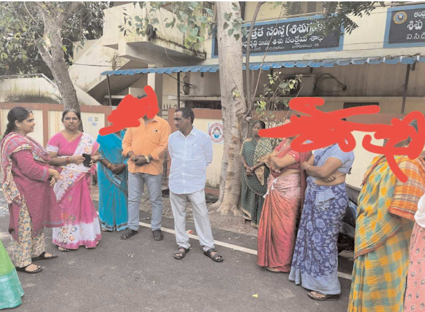
విశాఖ సీటీ, పెన్ పవర్, ఆగస్టు 27 :