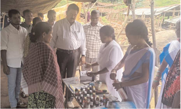
గూడెం కొత్తవీధి, పెన్ పవర్, ఆగస్టు 27

కేంద్ర ప్రభుత్వం అత్యంత ప్రతిష్టాత్మకంగా చేపడుతున్న పీఎం జాన్ మాన్ కార్యక్రమంలో భాగంగా పీవీటిజి గ్రామాలలో అధికారులు అవగాహన సదస్సులు నిర్వహిస్తున్నారు. ఇందులో భాగంగా మంగళ వారం అల్లూరి సీతారామరాజు జిల్లా గూడెం కొత్తవీధి మండలం దేవర పల్లి పంచాయతీ సాగులు గ్రామంలో ఎంపీడీవో ఉమామహేశ్వరరావు పర్యవేక్షణలో అవగాహన సదస్సు నిర్వహించారు. ఈ కార్యక్రమంలో