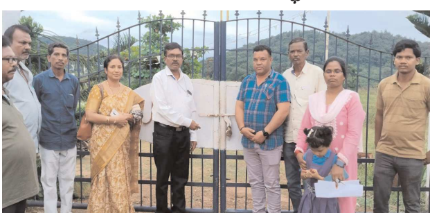
గూడెం కొత్తవీధి, పెన్ పవర్, ఆగస్టు 23

విద్యార్థులకు గవర్నమెంట్ హాస్టళ్లకు తరలింపు