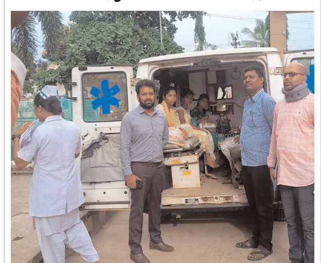
కొయ్యూరు, పెన్ పవర్ ఆగస్టు 23: