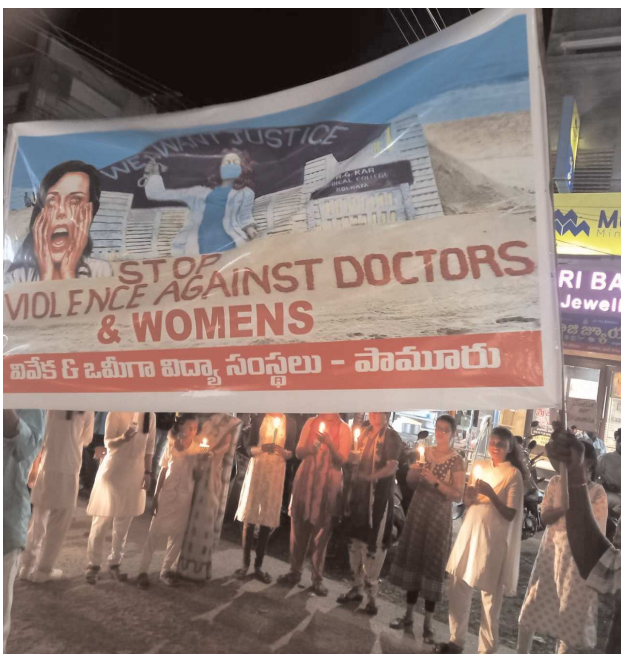
పెన్ పవర్ పామూరు ఆగస్టు 20