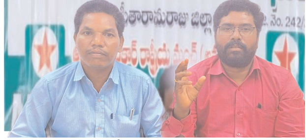
అలకతోడు పెన్ పవర్ ఆగస్టు 20

విద్యార్థుల కుటుంబానికి 25 లక్షలు ఎక్స్ గ్రేషియా ప్రభుత్వం చెల్లించాలి -ఆదివాసి గిరిజన సంఘం