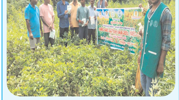
చింతపల్లి ఆగస్టు 20 పెన్ పవర్

సమగ్ర సస్యరక్షణ పద్ధతులపై ప్రతి రైతు అవగాహన పెంచుకొని వ్యవసాయం చేస్తే సత్ఫలితాలు సాధించేందుకు అవకాశం ఉంటుందని మండల వ్యవసాయ అధికారి బి శ్రీనివాసరావు అన్నారు. మండలంలోని తాజంగి పంచాయతీ లో రేగు బయలు గ్రామంలో జాతీయ ఆహార భద్రత పథకం లో భాగంగా ఏర్పాటు చేసిన వేరుశనగ పంట దెమా ఫాజ్ ను రైతులతో కలిసి పరిశీలించిన ఆయన గ్రామంలో సమావేశం ఏర్పాటు చేసి ఈ పంట నమోదు పై, వివిధ పంటల్లో సమగ్ర సస్యరక్షణ పద్ధతులు పై, ప్రధానమంత్రి ఫసల్ భీమా పథకం, ప్రభుత్వం కల్పిస్తున్న వివిధ పంటల మద్దతు ధరలపై, పొలం సరి హద్దులలో ట్రెంచ్ ఏర్పాటు, పొలంలో ఫార్మ్ పాండ్ నిర్మాణం, నీటి నిల్వ పై రైతులతో చర్చించి అవగాహన కల్పించారు. ఈ కార్యక్రమంలో వ్యవసాయ శాఖ ఉద్యోగులు, రైతులు పాల్గొన్నారు.