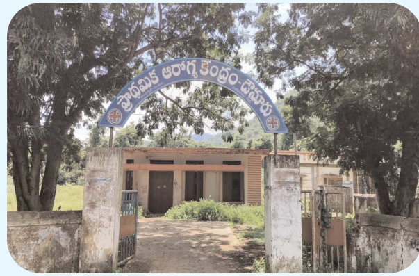
కొయ్యూరు, పెన్ పవర్ ఆగస్టు 20

“అత్యవసరం”లో అవస్థలు - రోగులకు తప్పని తిప్పలు 45 రోజులుగా అంబులెన్స్ లేని డౌనూరు ప్రాథమిక ఆరోగ్య కేంద్రం