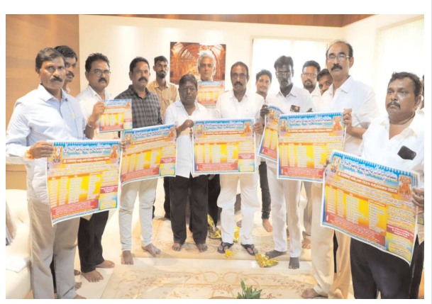
కావలి పెన్ పవర్ ఆగస్టు 20