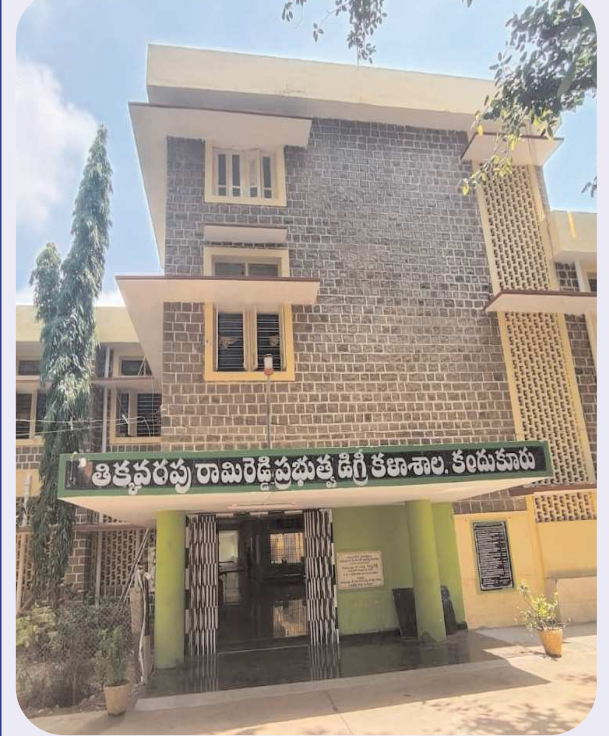
కందుకూరు పెన్ పవర్, ఆగస్టు 20

కళాశాలలో చేరే ప్రతి విద్యార్థికి 2000 రూపాయల ఫీజు ఉచితం