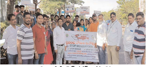
విశాఖ సీటీ, పెన్ పవర్ ఆగస్టు 20