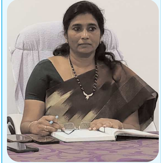
చింతపల్లి ఆగస్టు 20 పెన్ పవర్

చింతపల్లి ఎంపీడివోగా ఆశాజ్యోతి నియమితులయ్యారు. ఎన్నికల కమిషన్ ఆదేశాల మేరకు ఇక్కడ విధులు నిర్వహిస్తున్న ఆమెను కాకినాడ జిల్లా పెద్దాపురానికి బదిలీ చేశారు. అనంతరం సొంత జిల్లాల బదిలీ చేపట్టంలో తిరిగి ఆమెను చింతపల్లి బదిలీ చేశారు. దీంతో మంగళవారం మండల పరిషత్ కార్యాలయంలో ఆమె ఎంపీడివో గా బాధ్యతలు చేపట్టారు.