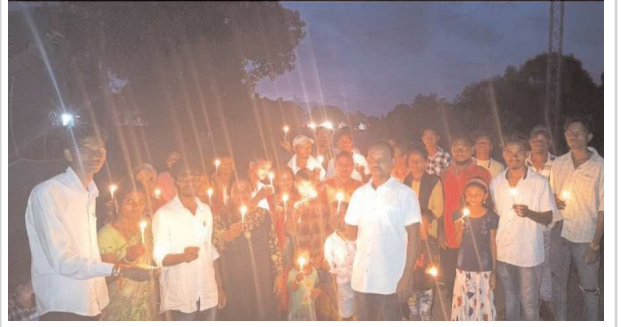
చింతపల్లి ఆగస్టు 20 పెన్ పవర్