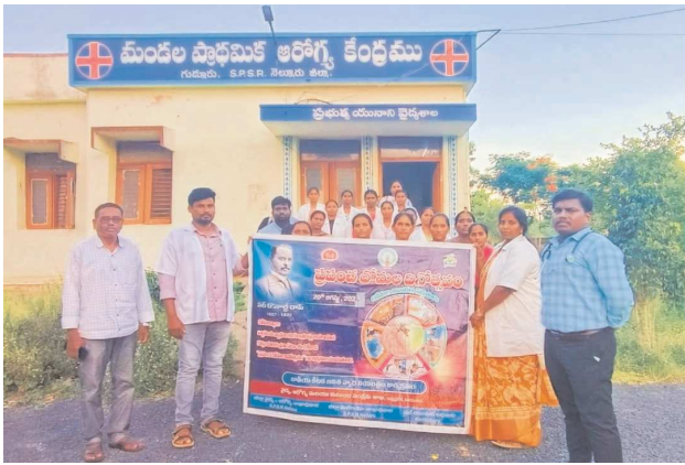
గుడ్లూరు, పెన్ పవర్, ఆగస్టు 20

మెడికల్ ఆఫీసర్ మారుతీరావు - గ్రామాల్లో అవగాహన కల్పించాలని పిలుపు