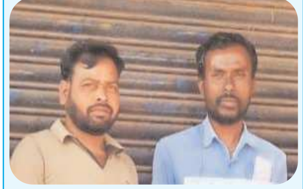
ముంచంగిపుట్టు, పెన్ పవర్, ఆగస్టు 20