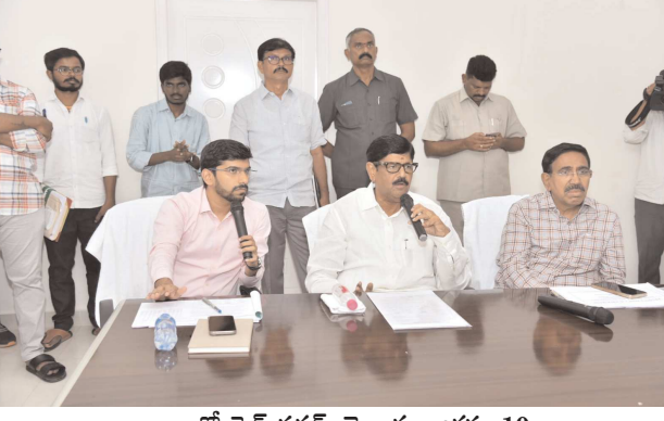
బ్యాంకో పెన్ పవర్, నెలగూరు, ఆగస్టు 10