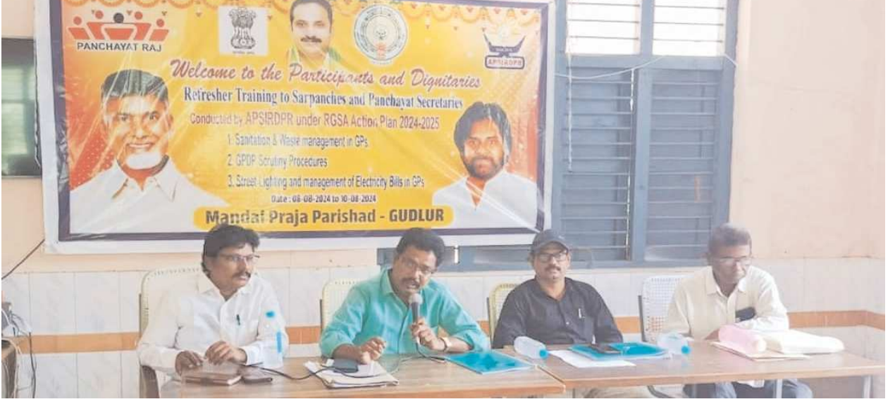
గుడ్లూరు, పెన్ పవర్, ఆగస్టు 10