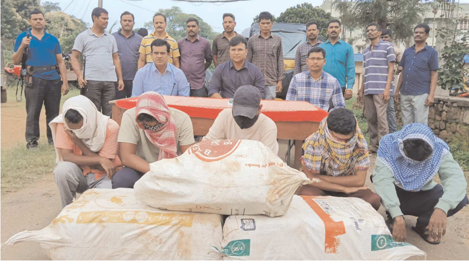
చింతపల్లి ఆగస్టు 10 పెన్ పవర్ అన్నవరం పోలీస్ స్టేషన్ పరిధిలో అక్రమంగా తరలిస్తున్న గంజాయిని పోలీసులు స్వాధీనం చేసుకున్నారు.