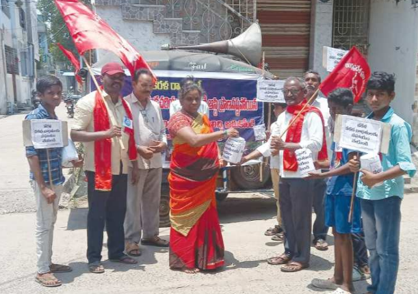
పాపన్నూ టౌన్ పెన్ పవర్ ఆగస్టు 10