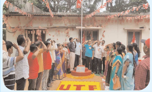
గుడ్లూరు, పెన్ పవర్, ఆగస్టు 10

పెన్ పవర్ - శ్రీకాళహస్తి, ఆగస్టు 10 ఐక్య ఉపాధ్యాయ ఫెడరేషన్ (50వ అవినీతి) స్వరోత్సవ వేడుకలు స్థానిక సిబిఐయి కార్యాలయం వద్ద శనివారం ఘనంగా జరిగాయి.