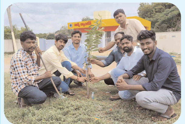
పెన్ పవర్ - శ్రీకాళహస్తి, ఆగస్టు 10