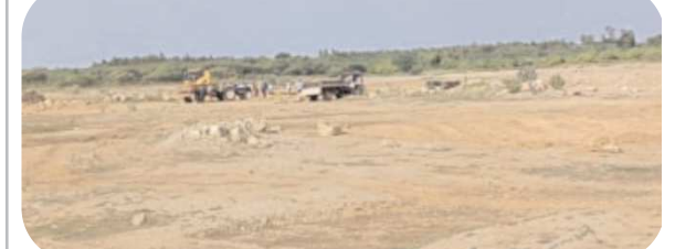
కందుకూరు పెన్ పవర్, ఆగస్టు 10

మండలం లోని కొండకందుకూరు గ్రామంలో పలువురు గ్రావెల్ అక్రమ దారులు యదేచ్ఛగా గ్రావెల్ ను అక్రమంగా తరలిస్తున్నారు. చెరువులో జెసిబి పెట్టి చదుల సంఖ్యలో ట్రాక్టర్లతో మట్టిని తరలిస్తున్న ఇంజనీర్ కి సంబంధించిన అధికారులకు పట్టణ ద్వారా సంబంధిత ఫోలోలను పంపించిన చోర్లు చూస్తున్నారు. ఎన్నికల ఫోన్ల చేసిన లిక్స్ చేయకుండా అక్రమంగా మట్టిని తరలిస్తున్న నాయకులకు అండగా నిలుస్తున్నారు. ప్రభుత్వ అనుమతి లేకుండా మట్టిని తరలించడం గ్రామస్థులు చెబుతున్న గ్రావెల్ అక్రమ దారులు తెక్కచేయడం లేదు. అక్రమ గ్రావెల్ తరలింపు గురించి అధికారులకు ఫోన్లు ద్వారా సమాచారం అందించిన అధికారులను పట్టణంలో పంటల గ్రామస్థులు ఆగ్రహం వ్యక్తం చేస్తున్నారు. అక్రమంగా మట్టిని తవ్వకున్న జెసిబి, ట్రాక్టర్లను, అక్రమంగా గ్రావెల్ త్రవ్వకాలు చేపడుతున్న వ్యక్తులపై కేసులు నమోదు చేసి కఠినంగా శిక్షించాలని కొండి కందుకూరు గ్రామస్థులు విజ్ఞప్తి చేస్తున్నారు.