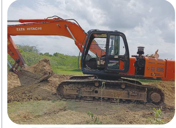
కొండి కందుకూరు గ్రామస్థల వేడుకోలు