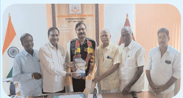
వేటపాలెం, ఆగస్టు 10, పెన్ పవర్