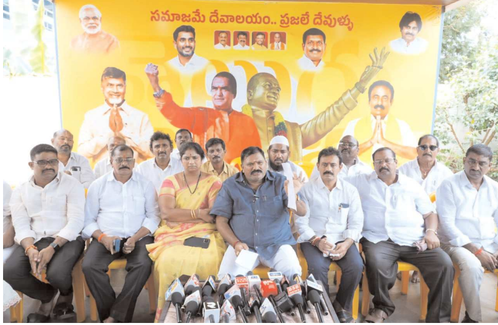
కావలి, పెన్ పవర్, ఆగస్టు 26