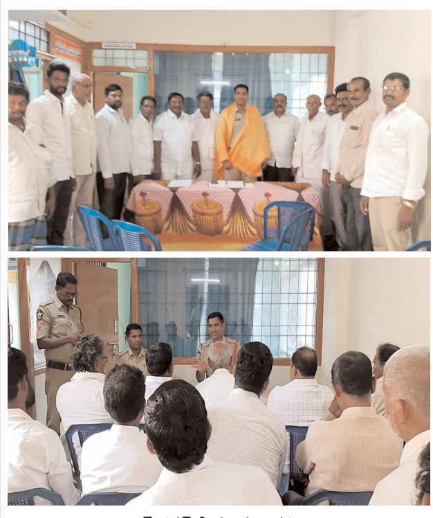
పెన్ పవర్ పామూరు ఆగస్టు 26