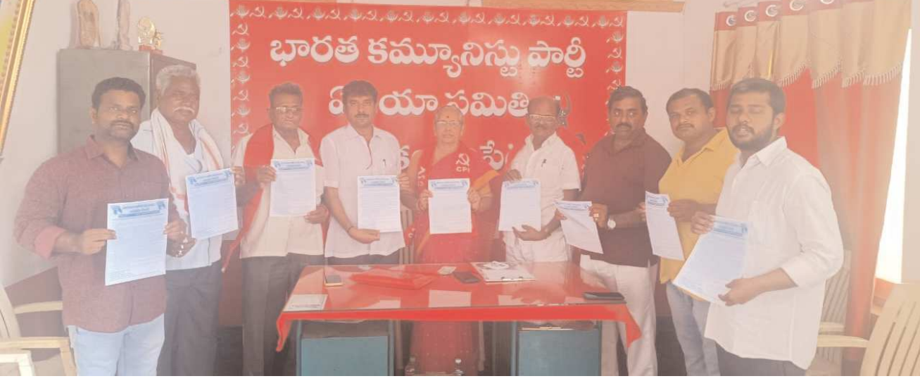
చిలకలూరిపేట పెన్ పవర్ ప్రతినిధి ఆగస్టు 26