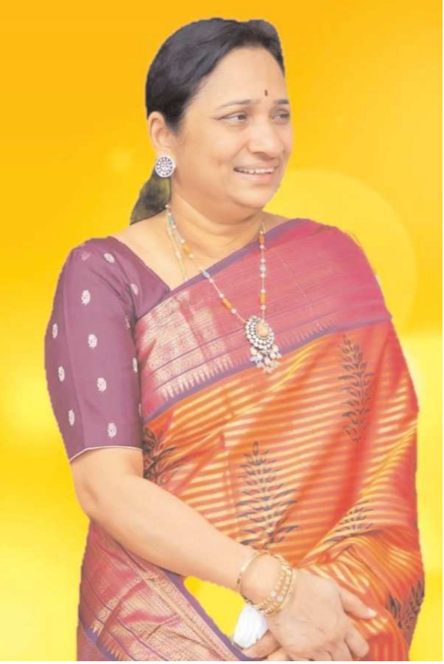
చిలకలూరిపేట పెన్ పవర్ ప్రతినిధి ఆగస్టు 26