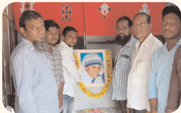
కందుకూరు పెన్ పవర్, ఆగస్టు 26