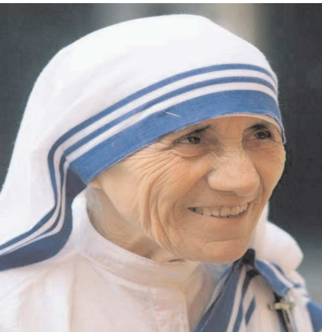
గడ్లూరు పెన్ పవర్ ఆగస్టు 26