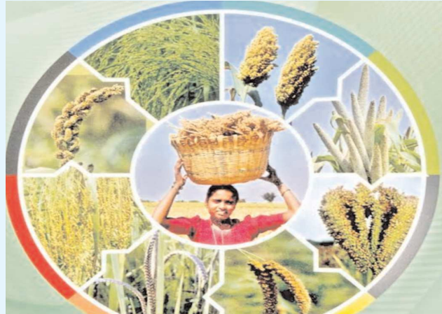
బ్యూరో పెన్ పవర్, ప్రకాశం, నెల్లూరు ఆగస్టు 26

మిల్లెట్ డైట్... ఈ మధ్యకాలంలో ఈ పదం బాగా ట్రెండ్ అవుతోంది. ముఖ్యంగా సోషల్ మీడియాలో చిరుధాన్యాలు వాటి ప్రాముఖ్యత, వ్యాధుల నివారణకు ఏ విధంగా ఉపయోగపడతాయోనే విషయాల వివరిస్తూ బాగా ప్రాచుర్యం చేస్తున్నాయి. చిరుధాన్యాలలో ప్రోటీన్, ఫైబర్, కాల్షియం, ఐరన్ వంటి పోషకాలు పుష్కలంగా ఉంటాయి. దీంతో వ్యాధులకు చిరుధాన్యాలు దివ్య ఔషధం అని చెప్పవచ్చు. ఇందులో ఫాస్ఫరస్ కాల్షియం సైతం ఎక్కువగా ఉంటాయి. ప్రాచీన కాలంలో వీటిని ఎక్కువగా వినియోగించేవారు. ఇటీవల కాలంలో సోషల్ మీడియా పుణ్యమా అని జనాలకు ఆరోగ్యంపై గత ఐదేళ్లుగా మరింత శ్రద్ధ పెరిగిందని భావించవచ్చు. ప్రస్తుతం హెల్త్ డైట్ అంటే మిల్లెట్స్ అనేంతగా జనాల్లో ప్రాచుర్యం పొందింది.