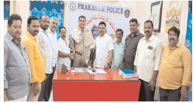
పెన్ పవర్ పామూరు ఆగస్టు 26