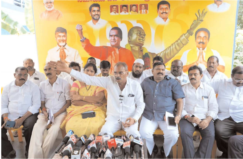
కావలి, పెన్ పవర్, ఆగస్టు 26