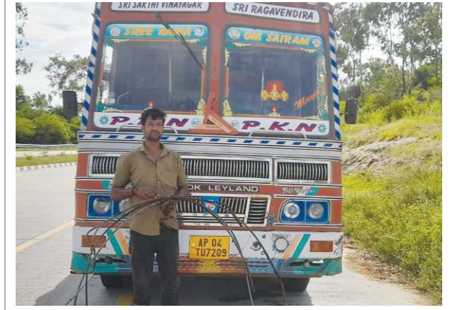
పలమనేరు ఆగస్టు 26 (పెన్ పవర్)