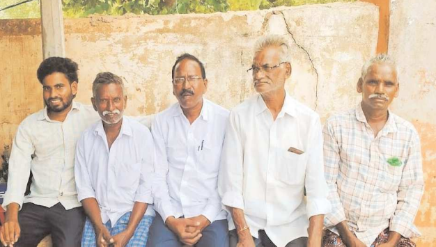
గుడ్లూరు, పెన్ పవర్, ఆగస్టు 26

ఆక్రమణలు తొలగించరా? -ప్రజలు ఇక్కట్ల పాలు కావాల్సిందేనా? రోడ్డుకు ఇరువైపులా ఆక్రమణలు తొలగించి రోడ్డు విస్తరణ చేపట్టాలి నూతనంగా ఎన్నికైన శాసనసభ్యులు అయినా పట్టించుకోవాలి సీపీఎం గుడ్లూరు కమిటీ డిమాండ్