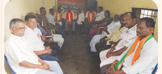
కందుకూరు పెన్ పవర్, ఆగస్టు 26