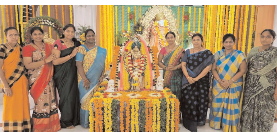
కనిగిరి ఆర్ట్స్ కాలనీ, పెన్ పవర్, ఆగస్టు 26