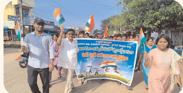
కందుకూరు పెన్ పవర్, ఆగస్టు 12