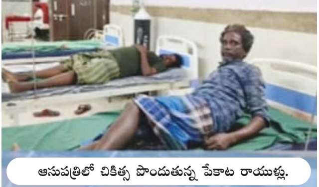
ఆసుపత్రిలో చికిత్స పొందుతున్న పేకట రాయుళ్లు.