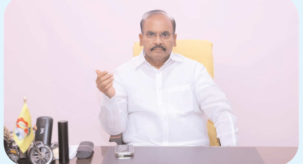
చిలకలూరిపేట పెన్ పవర్ ప్రతినిధి ఆగస్టు 12