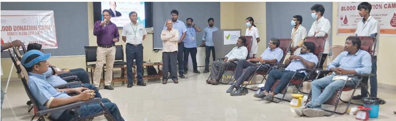
పరవాడ(పెన్ పవర్) ఆగస్టు 12