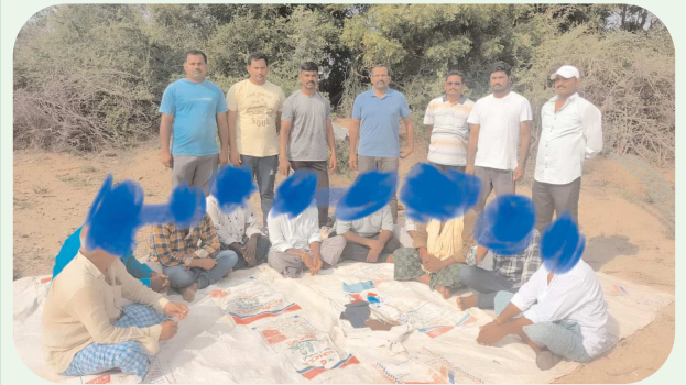
పొదిలి, పెన్ పవర్ ఆగస్టు 12