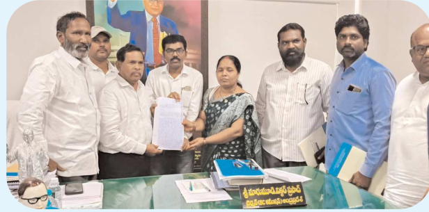
ఒంగోలు పెన్ పవర్ ఆగస్టు 12