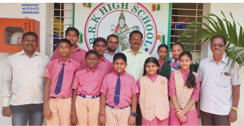
వేటపాలెం, ఆగస్టు 12, పెన్ పవర్

యలమంచిలి ఫౌండేషన్ ఆధ్వర్యంలో, వీరాల బి.ఆర్. ఎస్. అండ్ వై.ఆర్.యస్. కళా శాల సౌజన్యంతో, స్వాతంత్ర్య దినోత్సవాన్ని పురస్కరించుకొని, నిర్వహించిన మండల స్టా యి క్వీజ్, వక్రత్వ వ్యాసరచన తదితర పోటీలలో, కొత్తపేట బి.ఆర్.కె హైస్కూల్ విద్యార్థు లు విశేష ప్రతిభ కనబరిచి, ప్రశంసలను అందుకున్నారు. ఆగస్టు 9వ తేదీన వేటపాలెం బాలికాస్కూల్ పాఠశాలలో నిర్వహించిన, మండల స్టా యి క్వీజ్, వక్రత్వ పోటీ పరీక్షలలో సీని యర్స్, జూనియర్స్ విభాగాల రెండింటిలో,