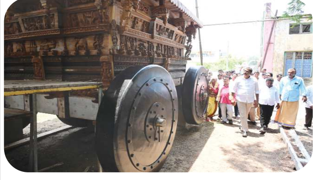
పెన్ పవర్ స్టాప్ రిపోర్టర్ బాపట్ల ఆగస్టు 12