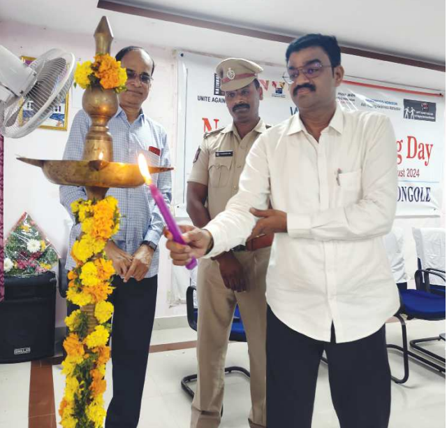
స్టాఫ్ రిపోర్టర్, పెన్ పవర్, ఆగస్టు, 12.