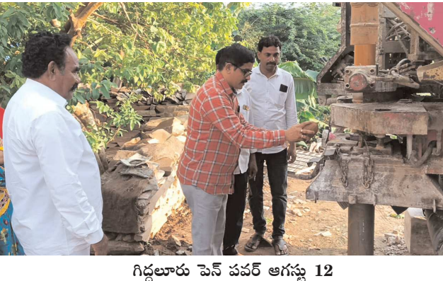
గిద్దలూరు పెన్ పవర్ ఆగస్టు 12