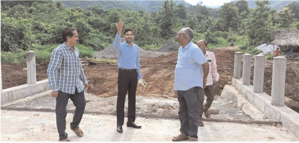
కొయ్యూరు,పెన్ పవర్ జూలై 31

పాడేరు ఐటీడిఎ పి ఓ అభిషేక్ అధికారులకు ఆదేశాలు