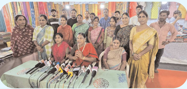
విశాఖ సిటీ, పెన్ పవర్, జూలై 31

మన ప్రాచీన హస్తకళలను పరిరక్షించుకోవాలి అని బాధ్యత నేటితరం అభ్యుదయ గ్రామీణ ద్వారా స్టేట్ కమిటీ సభ్యులు కోట దేవకి దేవి అన్నారు. ఆశీల మెట్ట కె.ఎ పాల్ ఫంక్షన్ హాల్లో అభ్యుదయ గ్రామీణ ద్వారా స్టేట్ కమిటీ అధ్యక్షులతో జరిపిన ఏర్పాటుచేసిన ద్వారా ఎగ్జిబిషన్ ను బుధవారం ద్వారా స్టేట్ కమిటీ సభ్యులు సందర్శించారు ఈ సందర్భంగా దేవకి దేవి మాట్లాడుతూ హస్తకళాకారులు తయారు చేసిన ఉత్పత్తులను ప్రతి ఒక్కరూ కొనుగోలు చేసి వారిని ప్రోత్సహించాలని కోరారు. హస్త కళాకారుల సంక్షేమాన్ని దృష్టిలో పెట్టుకొని ఇటువంటి ఎగ్జిబిషన్లు ఏర్పాటు చేయడం పట్ల హర్షం వ్యక్తం చేశారు. కేంద్ర ప్రభుత్వం హస్త కళాకారుల ప్రోత్సాహానికి, వారి సంక్షేమానికి అధిక ప్రాధాన్యత ఇస్తుంది చెప్పారు. అనంతరం ఎగ్జిబిషన్ లో ఉన్న పలు సాధనాలను సందర్శించారు. కార్యక్రమంలో అభ్యుదయ గ్రామీణ ద్వారా స్టేట్ కమిటీ సభ్యులు పాల్గొన్నారు.