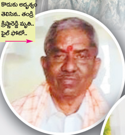
కొడుకు అదృశ్యం తెలిసిన.. తండ్రి క్రిస్టోరెడ్డి మృతి.. ఫైల్ ఫోటో..

ఓ బిల్డర్, కార్పొరేటర్ వేధింపులే ఇందుకు కారణమని కుటుంబ సభ్యులు ఆరోపణ..!