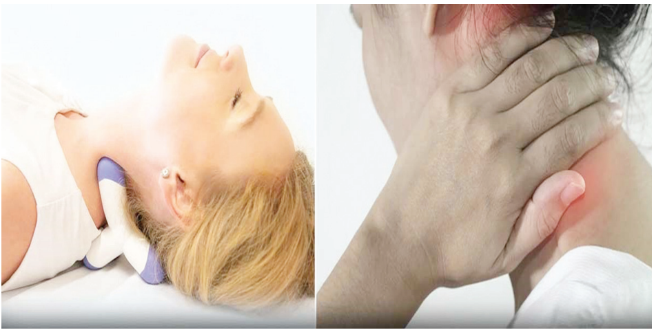
నొక్కుతూ ఉంటే క్రమంగా నొప్పి తగ్గుతుంది.

హైదరాబాద్ పెన్ పవర్: వెన్నునొప్పి, మెడనొప్పి ఈ రోజుల్లో చాలా కామన్ అయిపోయాయి. ఆఫీసుల్లో గంటల తరబడి కూర్చోవడం, మొబైల్, ల్యాప్టాప్ వాడటం వంటి అనేక కారణాలతో ఈ పెయిన్స్ వస్తున్నాయి. ఒకటి, రెండు రోజుల్లో నొప్పులు తగ్గితే పర్లేదు. కానీ, రోజుల తరబడి పెయిన్స్ వేధిస్తుంటే ఎలాంటా ట్రీట్? మెంట్? తీసుకోవాలి.. పెయిన్స్ తగ్గించే కొన్ని సులభమైన మసాజ్ ల గురించి తెలుసుకుందాం. .. ఫిజియోథెరపీ, మసాజ్ వంటివి చేయించుకుంటే నొప్పులు తగ్గుతాయి.. మసాజ్ చేసుకోవడానికి అన్నిసార్లు నిపుణుల సాయమే అక్కర్లేదు. కొన్ని మసాజ్ లు సొంతంగా కూడా చేసుకోవచ్చు. ఈజీగా ఉండే కొన్ని మసాజ్ లు చేయడం ఎలాగో తెలుసుకుంటే మీ నొప్పుల్ని మీరే తగ్గించుకోవచ్చు. అయితే వీటిని అవసరమైనప్పుడు ఒక పద్ధతి ప్రకారం చేసుకోవాలి. విశ్రాంతిగా అవసరమైన పొజిషన్ లో కూర్చుని, గట్టిగా ఊపిరి తీసుకుంటూ మసాజ్ చేసుకోగలిగితే మంచి ఫలితం ఉంటుందని నిపుణులు చెబుతున్నారు. పాదాలు...-చేతులు: ప్రతి పెయిన్ ను తగ్గించేందుకు ఒక అక్యుప్రెజర్ పాయింట్ ఉంటుంది. దాన్ని గుర్తించి ఆ ప్రదేశంలో నొక్కడం, మసాజ్ చేయడం చేస్తే నొప్పి చాలా వరకు తగ్గుతుంది. బ్యాక్ పెయిన్, నెక్ పెయిన్ కు సంబంధించి చాలా ట్రిగ్గర్ పాయింట్స్ ఉంటాయి. వాటిలో ముఖ్యమైనవి పాదాలు, చేతులు, పాదాల కింది భాగంలో బొటన, రెండో వేలుకు మధ్య ప్రదేశంలో ఉండే అక్యుప్రెజర్ పాయింట్లో నెమ్మదిగా నొక్కుతుండాలి. అరచేతికి సంబంధించి బొటనవేలి కింది భాగం, వేలు ప్రారంభమయ్యే ప్రదేశం, మణికట్టు భాగంలో కూడా ప్రెజర్ పాయింట్స్ ఉంటాయి. ఈ ప్రదేశాల్లో నెమ్మదిగా