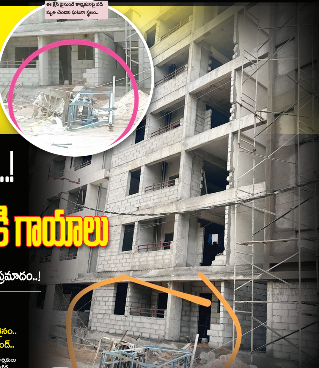
ఈ క్రేన్ సైనుండి కార్మికునిపై పడి మృతి చెందిన ఘటనా స్థలం..

నిర్మాణ సంస్థల నిర్లక్ష్యం..! హెచ్ఎండిపి నిబంధనలకు తిలీదకాలు..! అధికారుల పర్యవేక్షణలేక జిల్లర్ల ఇష్టానుసారంగా వ్యవహరిస్తూ..! భద్రతా చర్యలు చేపట్టకపోవడంతో ప్రమాదాలు సంభవించి భవన నిర్మాణ కార్మికులు మృతి చెందుతున్నారు.. హెచ్ఎండిపి అనుమతుల కన్స్ట్రక్షన్లో కార్మికుల ఆవాసాలు కూడా ప్రమాదకరంగా ఉంటున్నాయని గతంలోనే గండిమైసమ్మలోని "అపర్ట్లో పేకమేడల్లా.. జీ2 అక్రమ షెడ్లు" అన్న శీర్షికతో వార్తా కథనాలతో హెచ్ఎండిపి దృష్టికి తీసుకెళ్ళినా, నేటికీ చర్యలు శూన్యం అందినకాడికి "ముడుపులు పుచ్చుకుని" సంబంధిత అధికారులు మన్ను తిన్న పాములా పడి ఉంటున్నారు.. అపర్ట్లో చర్యలకు నోటీసులు జారీచేసి మరీ, నేటికీ చర్యలు తీసుకోక పోవడం హెచ్ఎండిపి, మున్సిపల్ అధికారుల అవినీతికి నిదర్శనం.. ప్రస్తుతం బాచుపల్లి డాల్ఫిన్ కన్స్ట్రక్షన్లో కూడా ఎలాంటి భద్రతా చర్యలు తీసుకోక పోవడం వల్లనే కార్మికుడు మృతిచెందాడు.. హెచ్ఎండిపి, మున్సిపల్ అధికారుల ధనదాహానికి కార్మికులు మృత్యువాత పడుతున్నారు.. మేడ్చల్ జిల్లా బ్యూరో, పెన్ పవర్, జూలై 3: