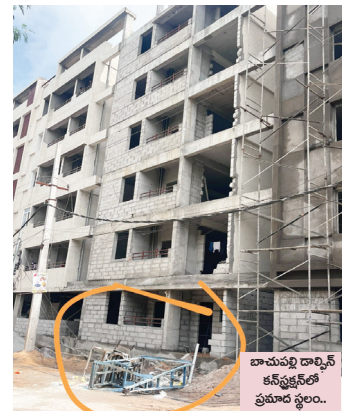
బాచుపల్లి డాల్ఫిన్ కన్స్ట్రక్షన్లో ప్రమాద స్థలం..