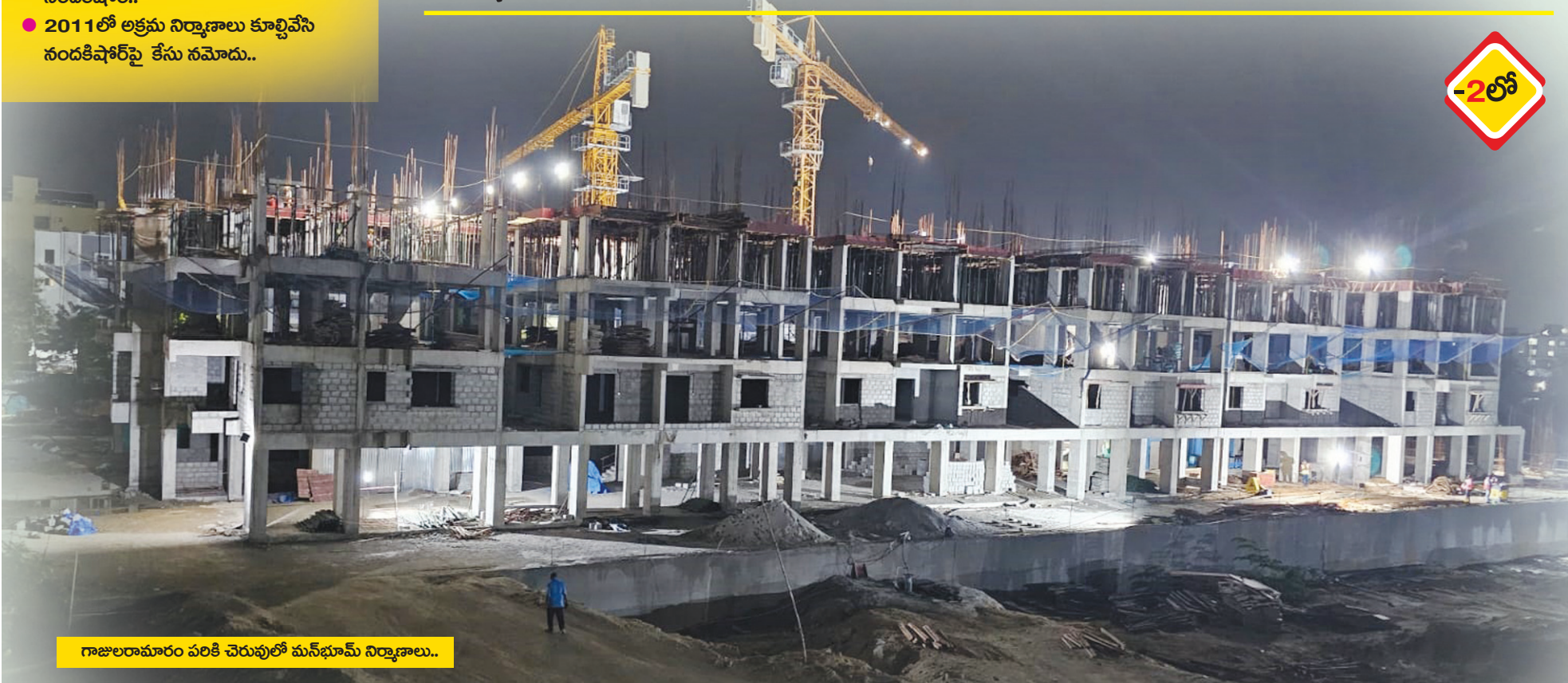
గాజులరామారం పరికి చెరువులో మన్భూమ్ నిర్మాణాలు..

తక్షణమే నిర్మాణ పనులు నిలిపి వేయాలని ఆదేశాలు..