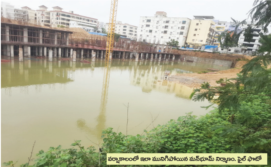
వర్షాకాలంలో ఇలా మునిగిపోయిన మన్ భూమ్ నిర్మాణం. ఫైల్ ఫోటో