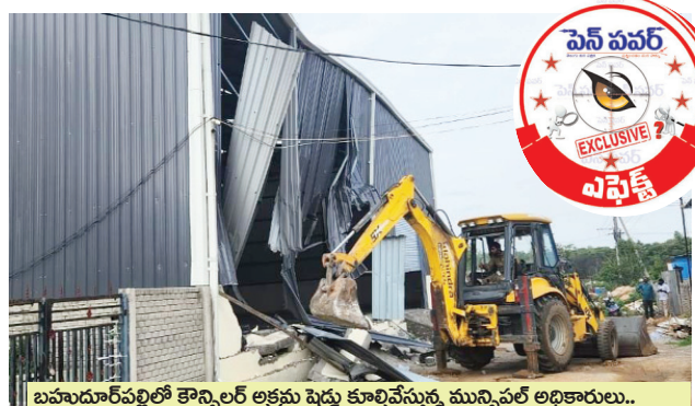
బహుదూర్పల్లిలో కౌన్సిలర్ అక్రమ షెడ్డు కూల్చివేస్తున్న మున్సిపల్ అధికారులు..