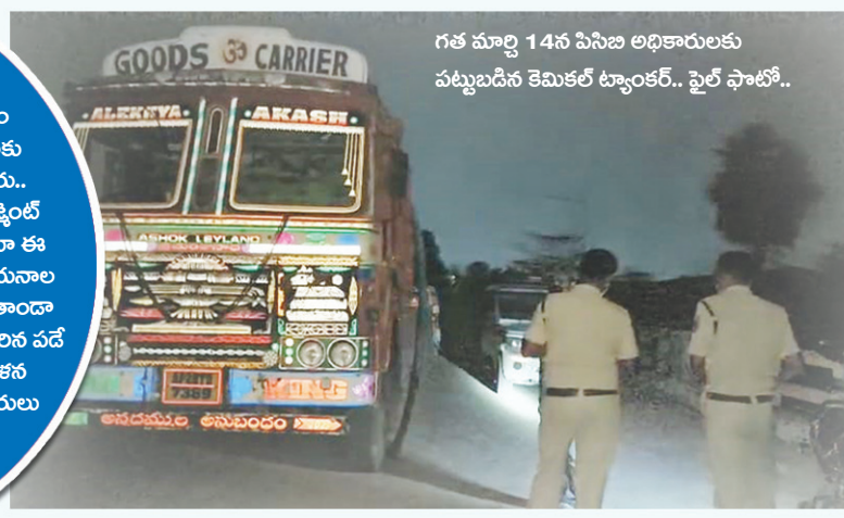
గత మార్చి 14న పిసిబి అధికారులకు పట్టుబడిన కెమికల్ ట్యాంకర్.. ఫైల్ ఫోటో..

కెమికల్ వ్యర్థ రసాయనాలను శుద్ధి కర్మాగారానికి తరలిస్తే లక్షల్లో ఖర్చు అవుతుందని.. కెమికల్ ఫ్యాక్టరీ యాజమాన్యం ఇలా మాఫియాతో కుమ్మక్కై, అక్రమ డంపింగ్ లకు పాల్పడుతూ ప్రజల ప్రాణాలతో ఆడుకుంటున్నారు.. దుండిగల్ చెత్త డంపింగ్ యార్డ్ రాంకి వేస్ట్ మేనేజ్మెంట్ సమీపంలోనే ఉండటం వలన..! కెమికల్ మాఫియా ఈ చోటును ఎంచుకున్నట్లు తెలుస్తోంది.. వ్యర్థ రసాయనాల పారబోతకు శాశ్వత పరిష్కారం చూపక పోతే..! తాండా వాసులు, మూగ జీవాలు క్యాన్సర్ కారక రోగాల బారిన పడే అవకాశం ఉందని తాండావాసులు భయాందోళన చెందుతున్నారు.. ఇప్పటికైనా సంబంధిత అధికారులు స్పందించి వెంటనే చర్యలు తీసుకోవాలని వేడుకుంటున్నారు..