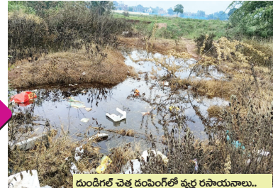
దుండిగల్ చెత్త డంపింగ్లో వ్యర్థ రసాయనాలు..