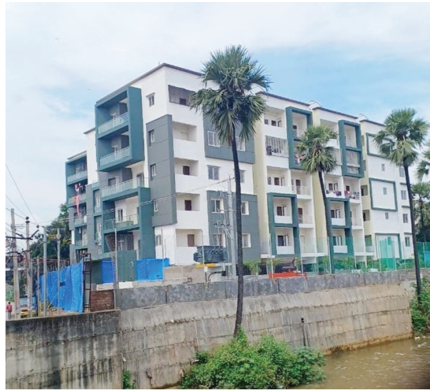
ఫ్యాక్సీసాగర్ నాలాపైనే మరో అపార్ట్‌మెంట్.. జీహెచ్‌ఎంసీ సౌజన్యంతో..