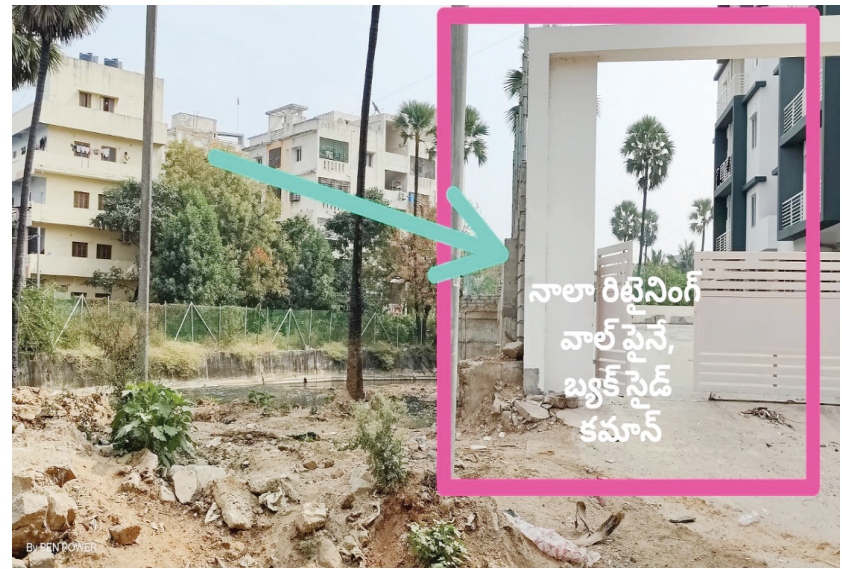
ఫ్యాక్సీసాగర్ నాలా కబ్జాతో అపార్ట్‌మెంట్ కమాన్..