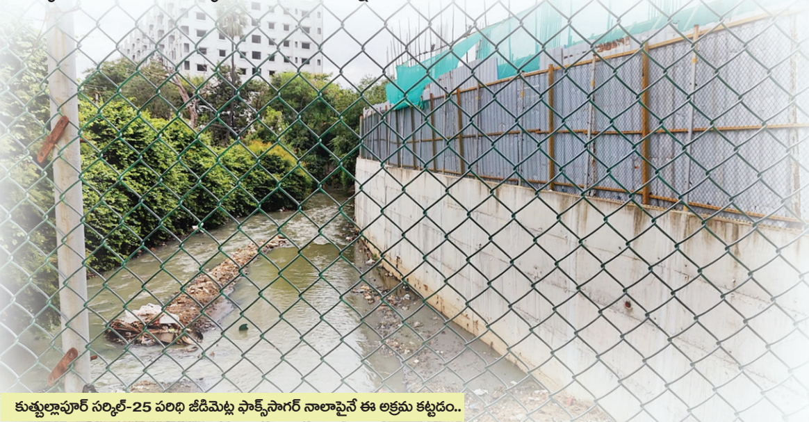
కుత్బుల్లాపూర్ సర్కిల్-25 పరిధి జిడిమెట్ల ఫాక్స్ సాగర్ నాలాపైనే ఈ అక్రమ కట్టడం..