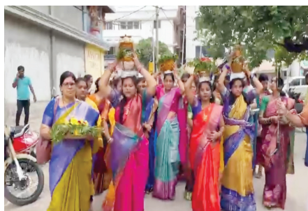
బెంగళూరులో తెలంగాణ వాసుల బోనాల వేడుకలు..

కర్ణాటక తెలంగాణ కల్చరల్ అసోసియేషన్ ఆధ్వర్యంలో ఆదివారం బోనాల సందడి..