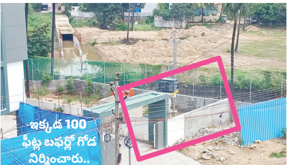
అదే ఫ్యాక్సీసాగర్ నాలా బఫర్ ఆక్రమించి కాంపౌండ్ వాల్.. అదే అపార్ట్‌మెంట్ కోసం..

- మొదటి పేజీ తరువాయి ప్రభుత్వ భూములు కబ్జాలు.. చెరువులు, కట్టుకాలువ లు, చారిత్రక నాలాలు ఆక్రమణలకు