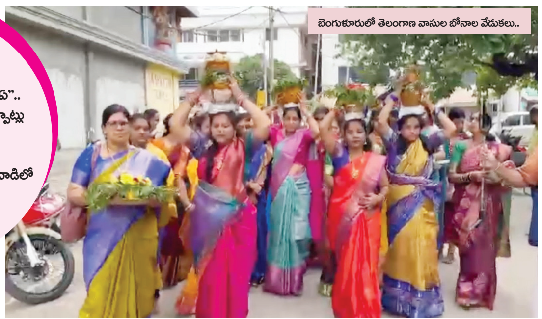
బెంగుళూరులో తెలంగాణ వాసుల బోనాల వేడుకలు..