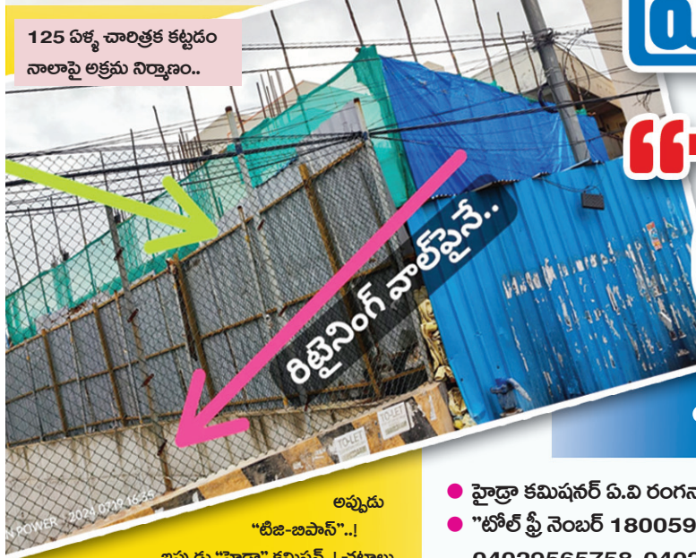
125 ఏళ్ళ చారిత్రక కట్టడం నాలాపై అక్రమ నిర్మాణం..

వాట్సాప్ చేయండి.. ప్రభుత్వ ఆస్తులు రక్షించండి..