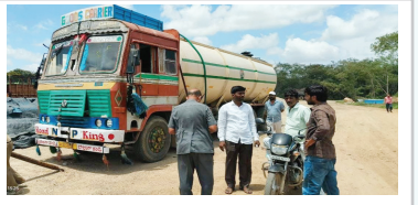
ఈనెల 10న దుండిగల్ లింగ్ రోడ్డు సమీపంలో పట్టుబడిన కెమికల్ ట్యాంకర్.. ఫైల్ ఫోటో..