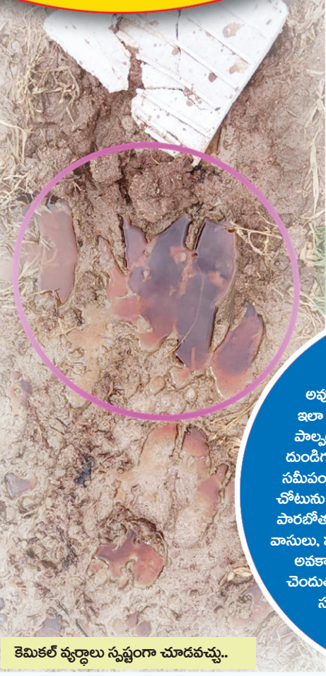
కెమికల్ వ్యర్థాలు స్పష్టంగా చూడవచ్చు..

దుండిగల్ చెత్త డంపింగ్ యార్డ్ లో వ్యర్థ రసాయనాలు..