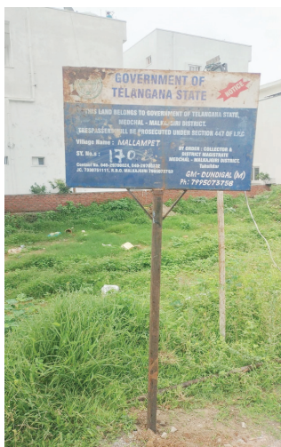
మల్లంపేట్ సర్వే నెం.170లో బోర్డు తొలగించిన ఆనవాళ్ళు..

పాత బోర్డును తొలగించడంతో.. శనివారం ఈ కొత్తబోర్డు ఏర్పాటు..