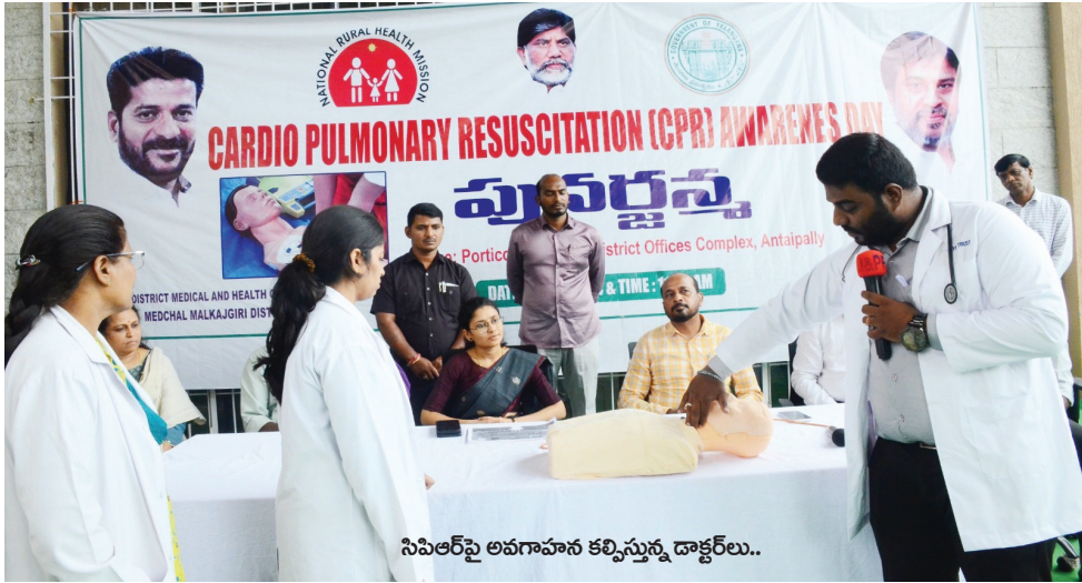
సిపిఆర్పై అవగాహన కల్పిస్తున్న డాక్టర్లు..