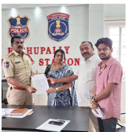
బాచుపల్లి ఇన్స్పెక్టర్ కు ఫిర్యాదు అందజేస్తున్న కౌసల్య నగర్ కాలనీ ప్రజలు..