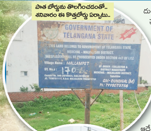
పాత బోర్డును తొలగించడంతో.. శనివారం ఈ కొత్తబోర్డు ఏర్పాటు..