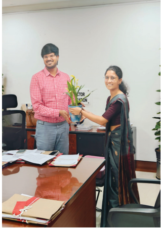
సిడిఎంపి కమిషనర్ వి.పి.గౌతమ్ ను కలిసిన జేసి రాధికా గుప్తా ఐపిఎస్..