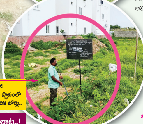
జూలై 12న ఒకసారి తొలగించిన బోర్డు స్థానంలో మరోక కొత్త హెచ్చరిక బోర్డు..