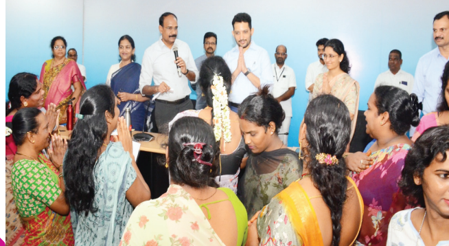
ట్రాన్స్ జెండర్స్ కి పునరావాస ఆర్థిక పథకం కింద కలెక్టర్ చెక్కులు పంపిణీ..

ప్రజావాణి ఫిర్యాదు అనంతరం మీడియాతో బీజేపీ నేతలు..