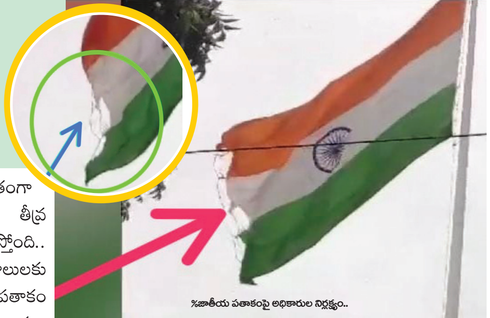
%జాతీయ పతాకంపై అధికారుల నిర్లక్ష్యం..

మహబూబాబాద్ జిల్లా, పెన్ పవర్, జూలై బాధ్యతా రహితంగా 21: తెలంగాణ రాష్ట్రంలోనే అతిపెద్ద రెండవ వ్యవహరించడంపై తీవ్ర జాతీయ పతాకంగా ప్రసిద్ధిగాంచి 100 విమర్శలకు తావిస్తోంది.. అడుగుల ఎత్తులో ఆవిష్కరణ గావించిన తీవ్రంగా వీస్తున్న గాలులకు జాతీయ జెండా నేడు నిర్లక్ష్యానికి గురౌతుంది.. జాతీయ పతాకం 20 అడుగుల ఎత్తు, 30 అడుగుల వెడల్పుతో ధ్వంసమై, అధికారుల గత ప్రభుత్వంలో అంగరంగవైభవంగా రాష్ట్ర నిర్లక్ష్యానికి సాక్ష్యంగా దర్శనమిస్తోంది.. పంచాయతీరాజ్ శాఖ మాజీ మంత్రి ఎర్రబెల్లి తెలంగాణలో ఇది రెండో అతిపెద్ద జాతీయ పతాకంకగానూ..! ఉమ్మడి వరంగల్ జిల్లాలోనే జాతీయ పతాకంకగానూ..! ఉమ్మడి వరంగల్ జిల్లాలోనే ప్రప్రథమంగా ఆవిష్కరించిన భారతదేశ గౌరవం పట్ల నిర్లక్ష్యం వహిస్తున్నారు.. దేశ స్వాతంత్ర్యం కోసం, ఐక్యత కోసం తన, మన, ధన, ప్రాణత్యాగాలు చేసిన వారందరినీ గుర్తుచేసే, వారి త్యాగాల స్ఫూర్తితో..! నవభారత నిర్మాణంలో అందరూ భాగస్వాములు కావాలనే గొప్ప సంకల్పంతో అప్పటి ఎమ్మార్వో రాఘవరెడ్డి నేతృత్వంలో తొర్రూరులో భారీ జాతీయ పతాకాన్ని ఏర్పాటు చేశారు. కానీ ప్రస్తుతం జాతీయ జెండా చినిగిన పరిస్థితిలో ఉండటం పలువురిని బాధిస్తుంది.