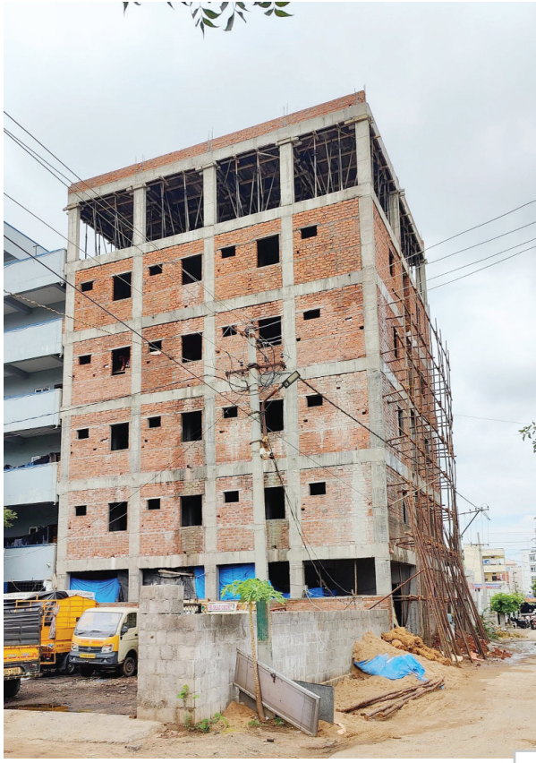
సిద్ది వినాయక నగర్లో స్పీకింగ్ ఆర్డర్ జారీచేసిన అక్రమ నిర్మాణం.. పైలే ఫాటో.. ప్రస్తుతం రంగులు వేశారు..