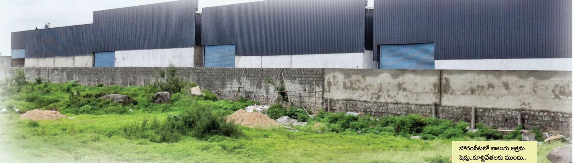
బొరంపేటలో నాలుగు అక్రమ షెడ్యూ..కూల్చివేతకు ముందు..

అక్రమ నిర్మాణాలపై ఎప్పటికప్పుడు సమాచారాన్ని టౌన్‌ప్లానింగ్ అధికారినికే చేరవేయాలని, మున్సిపల్ చైన్‌మెన్లను కమిషనర్ ఆదేశించారు.. ఫిర్యాదులు వచ్చేవరకు జాప్యం చేయకుండా, అక్రమ నిర్మాణాల జాబితాను ఎప్పటికప్పుడు తమ దృష్టికి తీసుకు రావాలన్నారు.. ఇకమీదట అక్రమ షెడ్యూ, అనుమతులేని బహుళ అంతస్తుల నిర్మాణాలపై చైన్‌మెన్ల పర్యవేక్షణ ఉండాలని సూచించారు.. చైన్‌మెన్లు నిర్లక్ష్యంగా విధులు నిర్వహిస్తే, చర్యలు తప్పవని కమిషనర్ హెచ్చరించారు.. ఇకమీదట అక్రమ కట్టడాలపై నిరంతర చర్యలు ఉంటాయని కమిషనర్ సత్యనారాయణ అన్నారు..