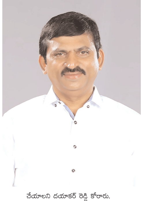
చేయాలని దయాకర్ రెడ్డి కోరారు.

సొరంగ ప్రవేశ భాగాన్ని పరిశీలిస్తారని పేర్కొన్నారు. 11:30 గంటలకు బీరోలు కెనాల్ సొరంగ ఆడిట్ ను పరిశీలిస్తారని తెలిపారు. ఆ తర్వాత మధ్యాహ్నం 12:30 గంటలకు కూసుమంచి మండలం పోచారం కెనాల్ సొరంగ నిష్కమణ భాగాన్ని మధ్యాహ్నం 1:30 గంటలకు నర్సింహులగూడెం గ్రావిటీ కెనాల్ ను పరిశీలిస్తారని దయాకర్ రెడ్డి తెలిపారు. అనంతరం మధ్యాహ్నం మూడు గంటల నుంచి కూసుమంచి లోని మంత్రి క్యాంప్ కార్యాలయంలో పాలేరు నియోజకవర్గ అభివృద్ధి పనులపై రెవెన్యూ, పంచాయతీరాజ్, ఆర్ అండ్ బీ, ఇరిగేషన్, నియోజకవర్గంలోని మండల అధికారులతో మంత్రి పొంగులేటి సమీక్ష సమావేశం నిర్వహిస్తారని తెలిపారు. కావున మంత్రి పర్యటనలో కాంగ్రెస్ నాయకులు, కార్యకర్తలు, అభిమానులు అధిక సంఖ్యలో పాల్గొని జయప్రదం