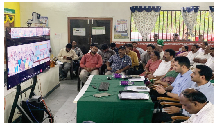
రైతుల సంబరాలలో, సీఎం రేవంత్ రెడ్డి.. కలెక్టర్ గౌతమ్ వీక్షిస్తున్న దృశ్యం..

అద్దైర్య పడవద్దని, రెండో విడత, మూడో విడతలో రుణమాఫీ జరుగుతుందన్నారు. వర్షాలు కురుస్తున్నందున వ్యవసాయం చేసే రైతులు రుణాల కోసం రెస్యూవల్ చేసుకోవాలన్నారు. రైతులకు ఏమన్నా సందేహాలు ఉంటే నివృత్తి చేసుకోవడానికి జిల్లా, మండల వ్యవసాయ అధికారులు అందుబాటులో