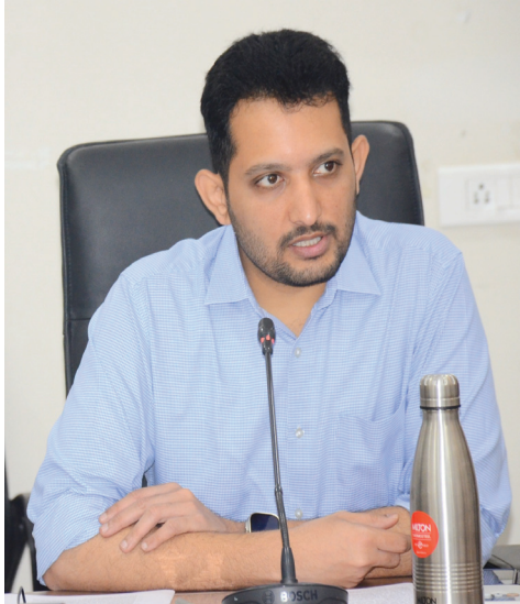
మేడ్చల్ జిల్లా కలెక్టర్ గౌతమ్ పోట్లు..

ప్రభుత్వ నిబంధనల మేరకు అర్జులైన రైతులకు రుణమాఫీ పథకం అందజేయాలి..