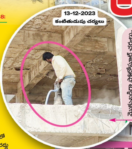
మొక్కుబడిగా ఫోటోషూట్ చర్యలు..

చెరువులు, గొలుసుకట్టు కాలువలు, ప్రభుత్వ భూముల ఆక్రమణలో సంబంధిత అధికారులే సూత్రధారులుగా వ్యవహరిస్తున్నారని స్పష్టమవుతుంది.. స్థానిక కౌన్సిలర్ ఫిర్యాదును కూడా పట్టించుకోకుండా..! ఓ ప్రజాప్రతినిధి నిఘాంతులకే ప్రాధాన్యత ఇస్తూ, వక్రమార్గంలో చెరువులోనే మున్సిపల్ అనుమతులు మంజూరు చేశారు..