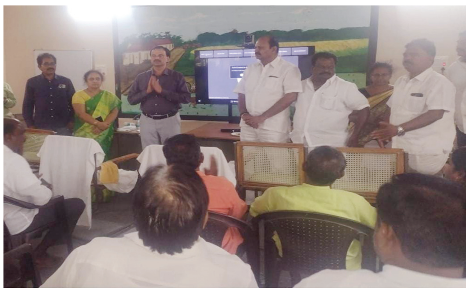
కీసర రైతు వేదికలో మాట్లాడుతున్న అదనపు కలెక్టర్..