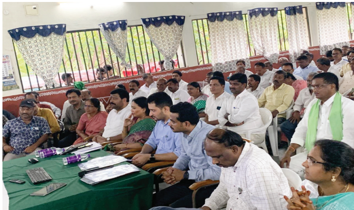
ముఖ్యమంత్రి రేవంత్ రెడ్డి వీడియో సమీక్షను వీక్షిస్తున్న కలెక్టర్, రైతులు..