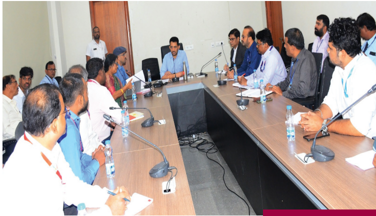
బ్యాంకర్లు, సంబంధిత వ్యవసాయ అధికారులతో కలెక్టర్ సమీక్ష..