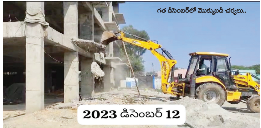
గత డిసెంబర్ లో మొక్కుబడి చర్యలు..