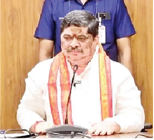
ఎన్టీఆర్ఎఫ్ బృందాలతో పాటు ఇతర విభాగాల అధికారులను ప్రభుత్వం అప్రమత్తం చేసింది. నీటిని కాలువల ద్వారా బయటకు పంపించే

హైదరాబాద్ పెన్ పవర్: తెలంగాణ రాజధాని నగరం హైదరాబాద్ లో ఇవాళ (మంగళవారం) సాయంత్రం నుంచి భారీ వర్షాలు కురిసే అవకాశం ఉండటా వాతావరణ శాఖ హెచ్చరించిన నేపథ్యంలో రాష్ట్ర ప్రభుత్వం అప్రమత్తమైంది. ప్రభుత్వం హైఅల్టర్ ప్రకటించింది. జీహెచ్ఎంసీ, జలమండలి, హెచ్ఎంఓ, వాటర్ వర్క్, డీఆర్ఎఫ్,