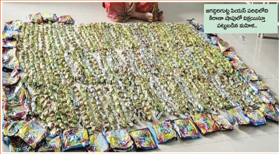
జగద్గిరిగుట్ట పియస్ పరిధిలోని కిరాణా షాపులో విక్రయిస్తున్న పట్టుబడిన మహిళ..